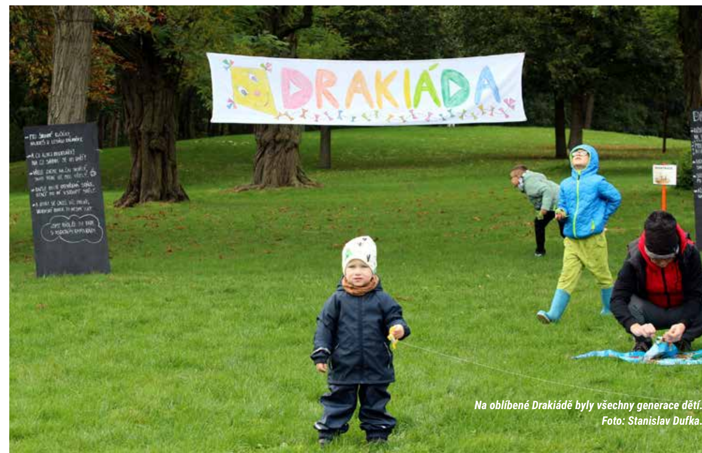
Na oblíbené Drakiádě byly všechny generace dětí.