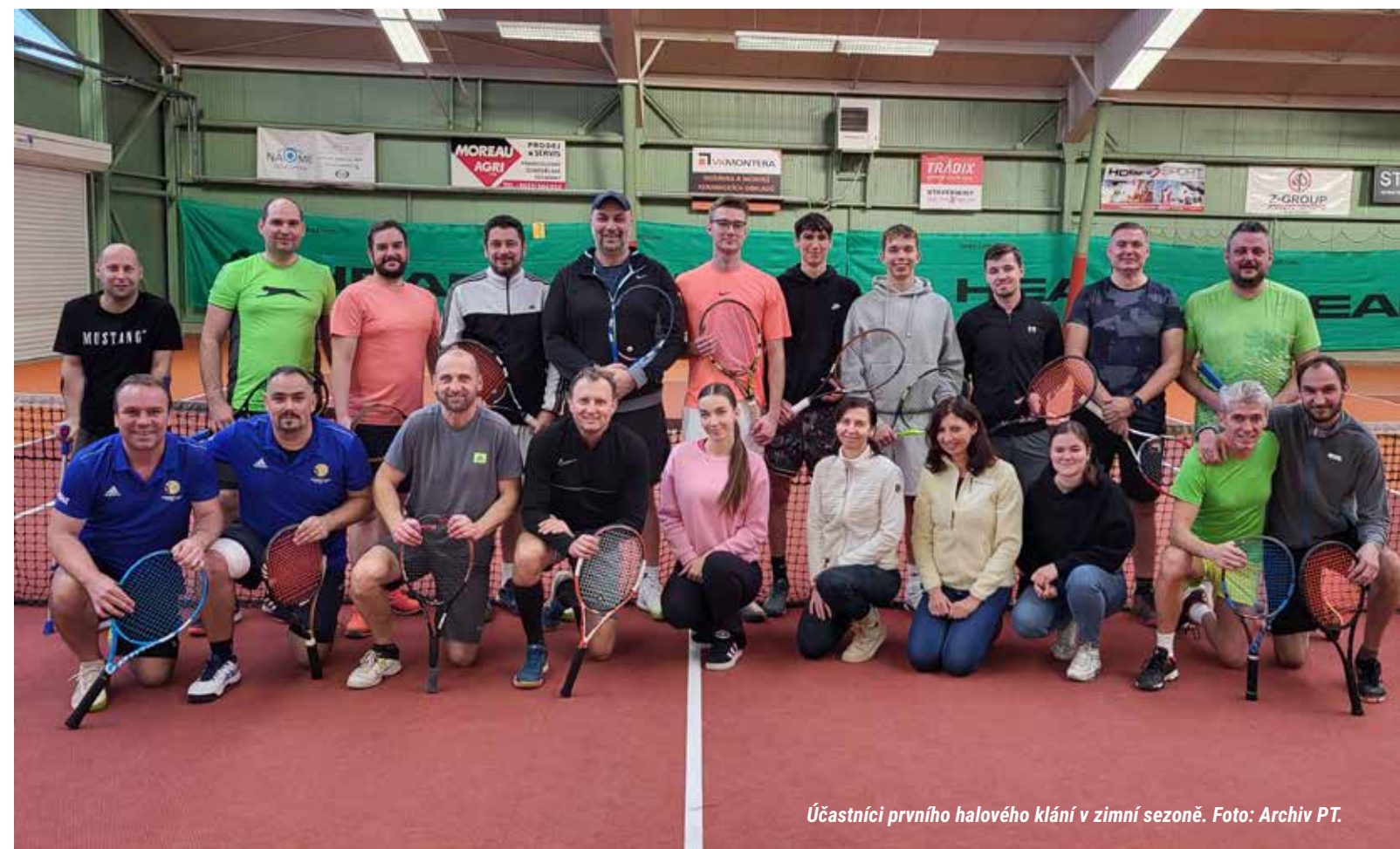
Účastníci prvního halového klání v zimní sezoně.