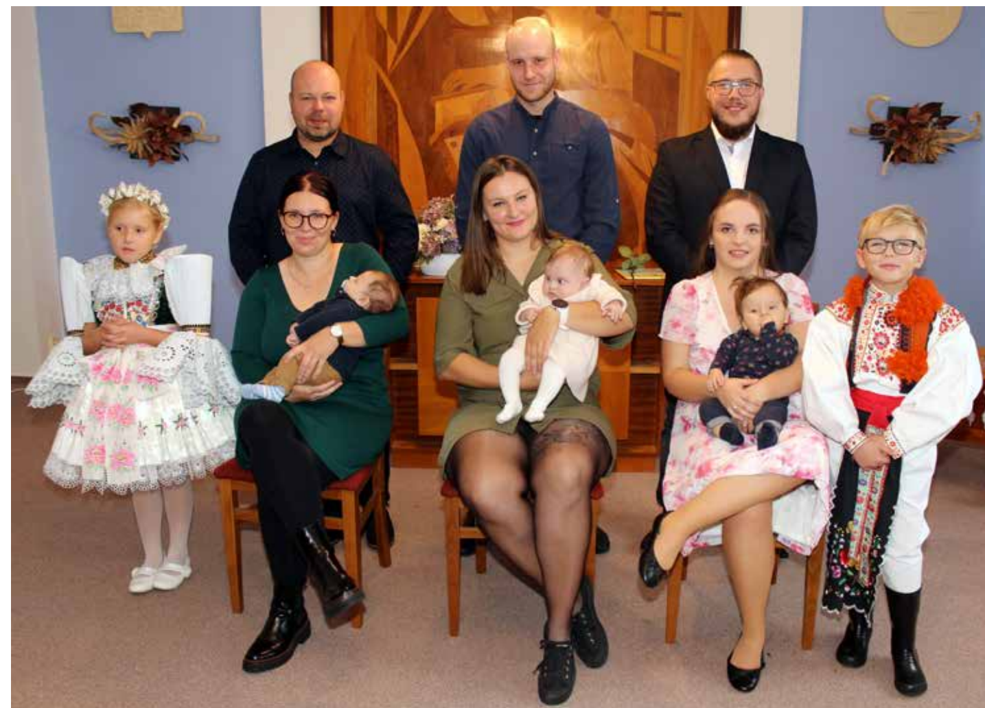
Třetí vítání občánků v naší obci se v letošním roce uskutečnilo první říjnovou nedělí.

Celkem bylo v letošním roce v naší obci přivítáno 20 dětí. Leden – 5 dětí, duben - 8 dětí, říjen – 7 dětí.