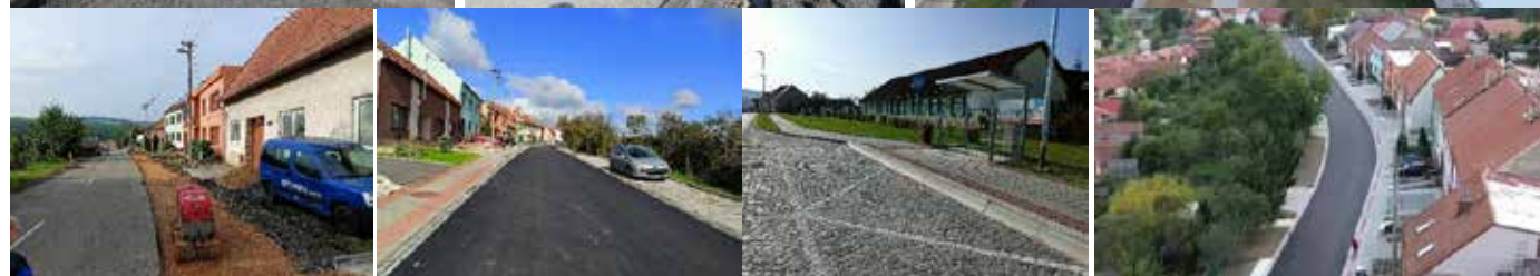
Evropská cena pro obnovu vesnice 2024