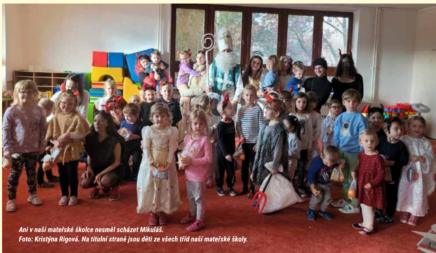
Ani v naší mateřské školce nesměl scházet Mikuláš. Na titulní straně jsou děti ze všech tříd naší mateřské školy.