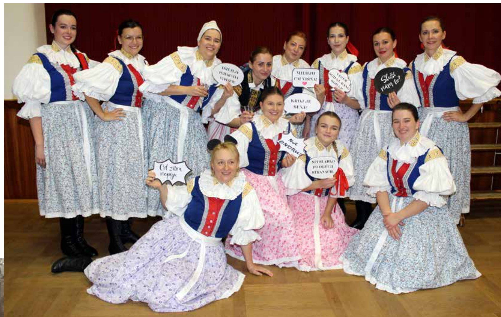
Na Kateřinské besedě byl hodně oblíbený vtipný fotokoutek, jak dokazují Děvčice z Háječku.