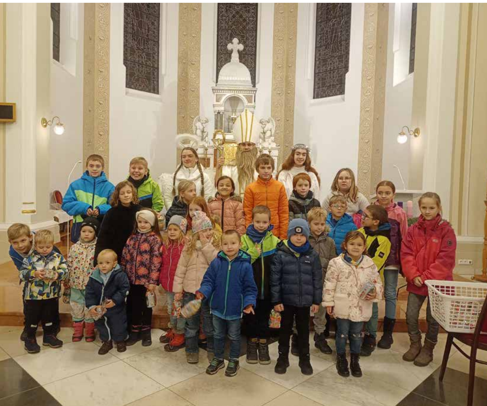
Svatý biskup Mikuláš přišel v pátek 6. 12. během své každoroční obchůzky po světě také do našeho kostela. A našel zde dokonce i několik dětí.