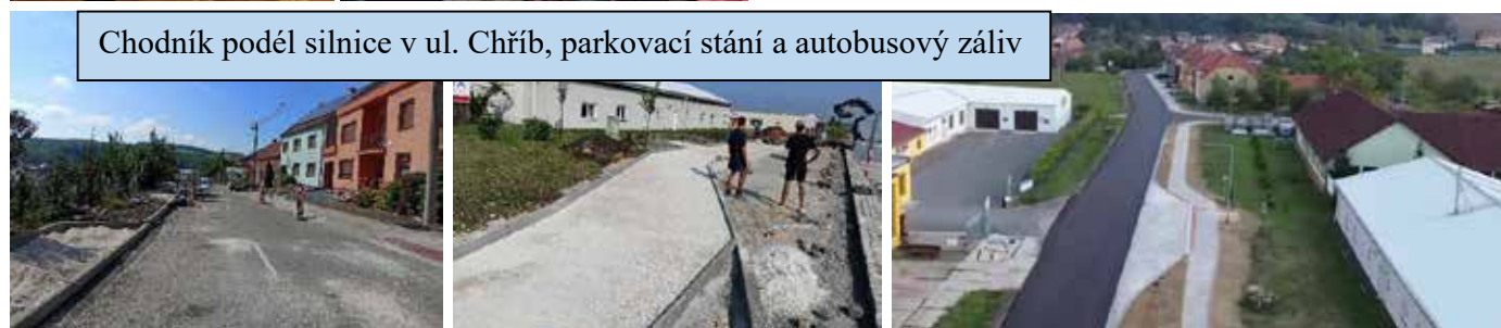
Chodník podél silnice v ul. Chřib, parkovací stání a autobusový záliv