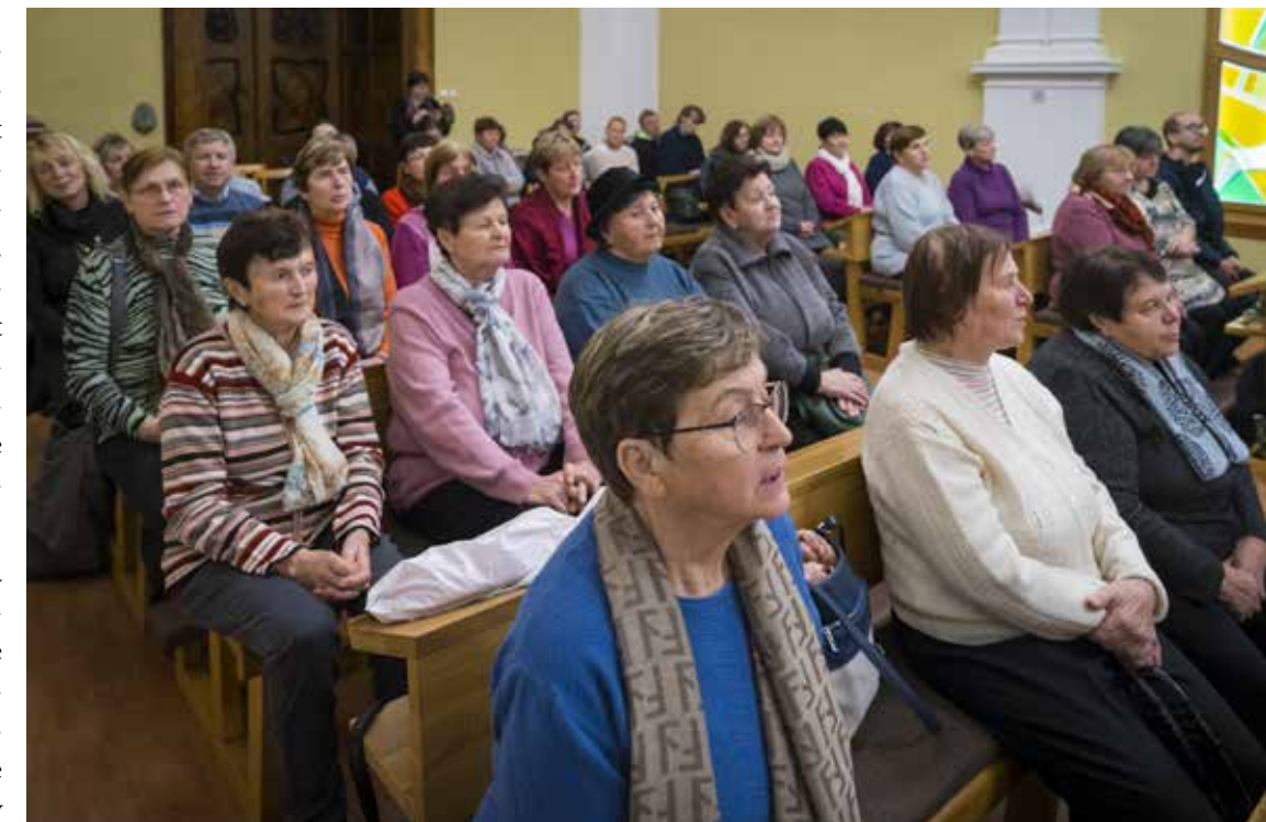
Do Olomouce vyrazila pestrá skupina skládající se nejen ze Lhoťanů, ale zastoupena byla i Blatnice, Blatnička, Hluk a Boršice u Buchlovic.

Pater Uhřík dosvědčil, že i přes svůj věk se dokázal přiblížit mladé generaci a všechny velké změny (zrušení latiny při