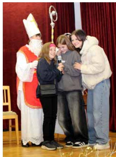
Obecní sál, plný dětí, vítal na pódiu Mikuláš s čertem a andělem.

Právě starosta měl u stroměčku kratší řeč. „Chtěl bych poděkovat za organizaci členkám červeného kříže v čele