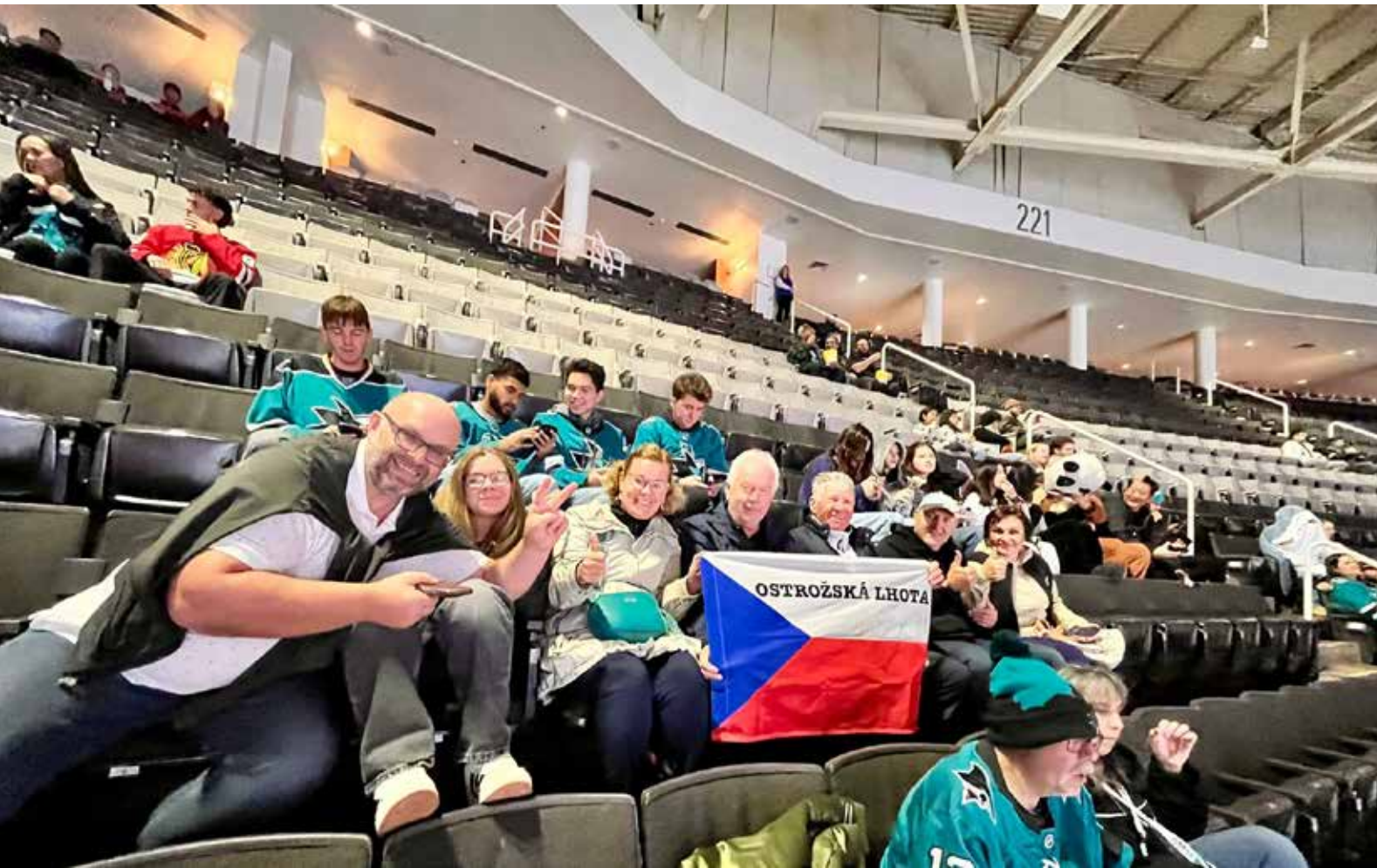
Část výpravy byla na zápase kanadsko - americké NHL San Jose Sharks - Chicago Blackhawks.

států. Během dvanácti dnů výprava projela několik zajímavých míst, měst a národních parků. Tady je seznam.