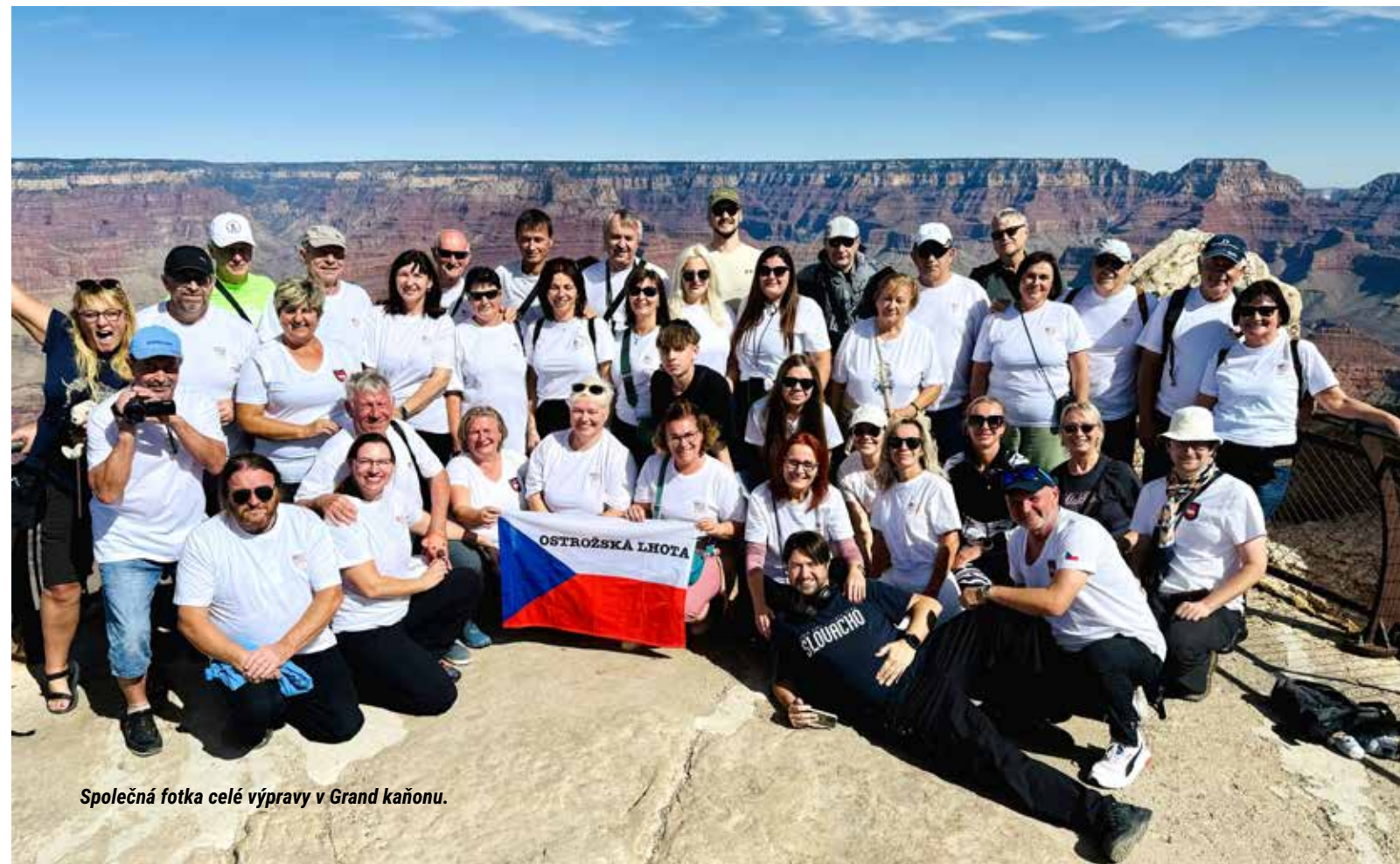
Společná fotka celé výpravy v Grand kaňonu.

Na pokojích nejsou stropní světla, na záchodech nejsou šetky, všechny sprchy na hotelu jsou pevné, na veřejnosti je zákaz pití alkoholu, při vstupu do restaurace vás usadí obsluha, spropitné vám účtují přímo na doklad, cenovky jsou bez DPH, na cestách dodržují všichni předepsanou rychlost.