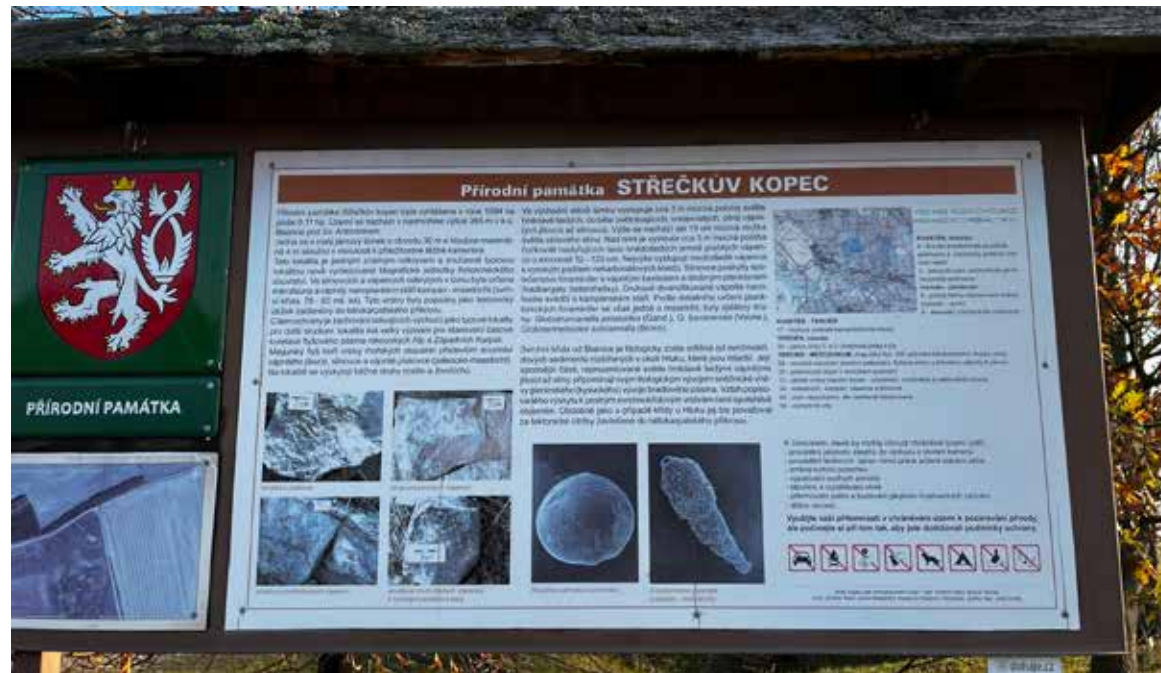
Střečkův kopec je přírodní památka severovýchodně od Blatnice.