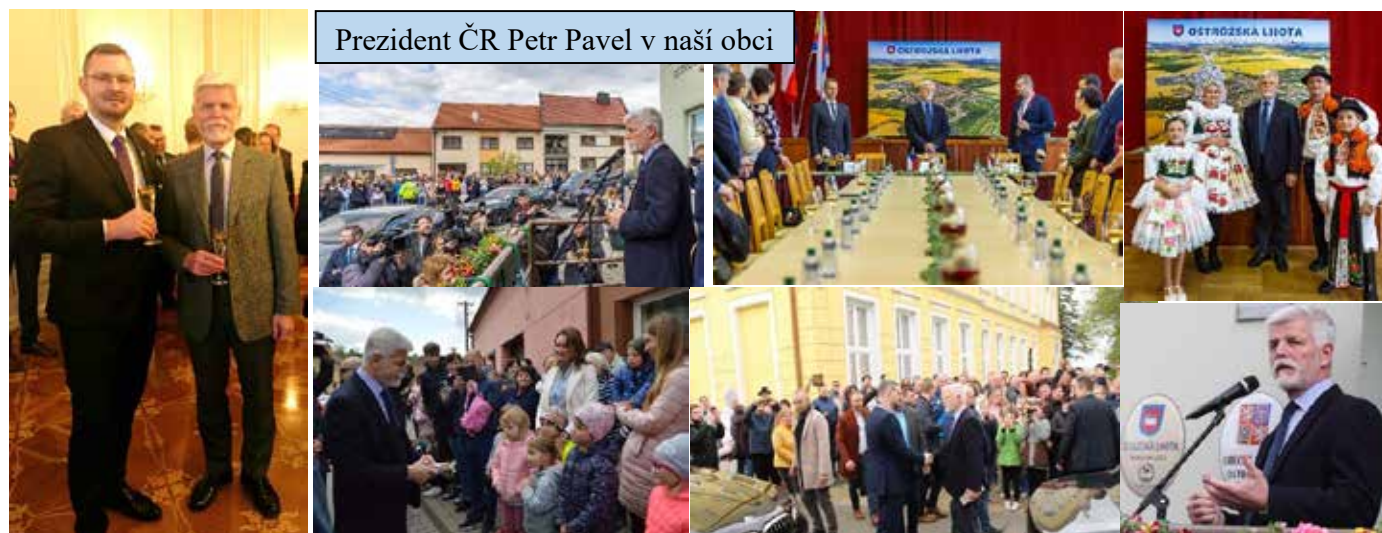
Prezident ČR Petr Pavel v naší obci