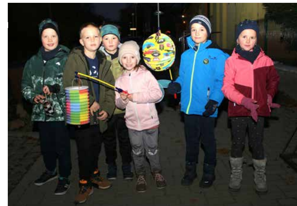
Třetí uspávání broučků v naší obci zorganizovaly Maminky z Domečku ve spolupráci s mládeží farnosti.

Třetí uspávání broučků v naší obci zorganizovaly Maminky z Domečku ve spolupráci s mládeží farnosti. „Uspávání broučků symbolizuje příchod zimy,“ prozradila jedna z organizátorek vydařené akce.