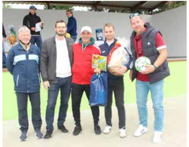
Zástupce domácího týmu přebírali cenu za 4. místo.