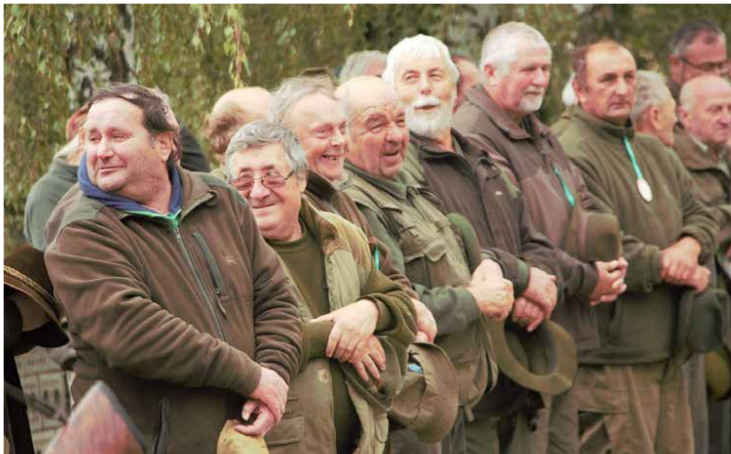
Lhotští myslivci zajišťovali pořadatelskou službu a servis. Zkoušek se v letošním roce žádný domácí myslivec nezúčastnil.