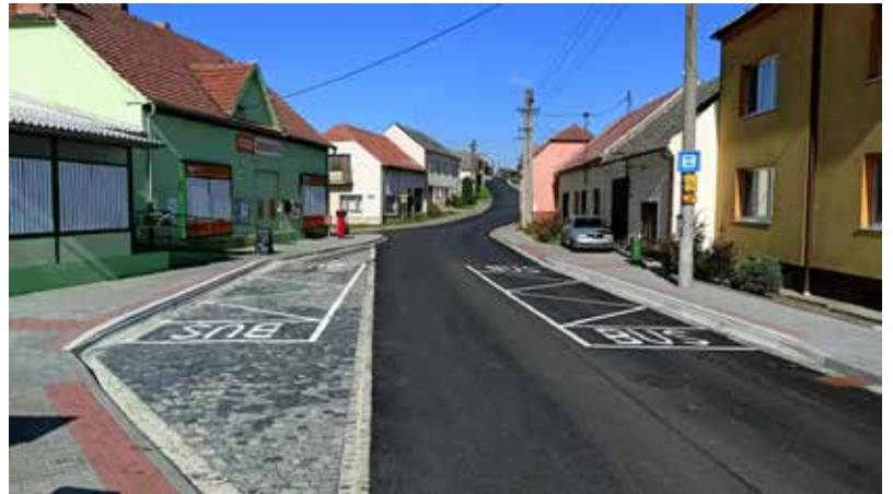
Nová komunikace ul Lánová až po křižovatku u sv. Jana