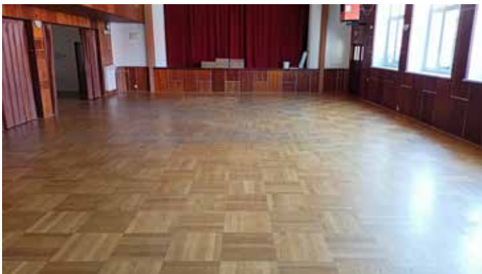
Původní parkety v obecním sále.

Práci provedla firma SUKUP parkety – Martin Sukup, cena díla je 141 tis. Kč (vč. DPH). Součástí ceny je oprava čela pódia a vyčištění a ošetření podlah obou přísálí.