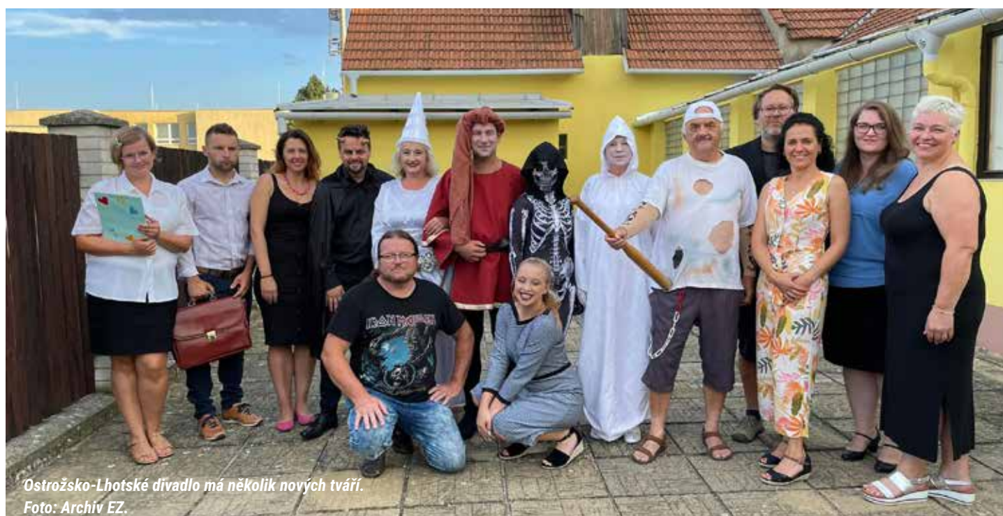
Ostrožsko-Lhotské divadlo má několik nových tvářů.

Tam jsme hráli úplně poprvé. Byla to taková hrr akce, kterou bylo škoda nevyužít. Divadlo bylo v přístavišti u Bařova kanálu. Byl velký vítr, který nám ještě před začátkem shodil kulisy. Pomohl pan starosta Spytihněvi. Byl připravený na všechno, pro jistotu přivezl dlažební