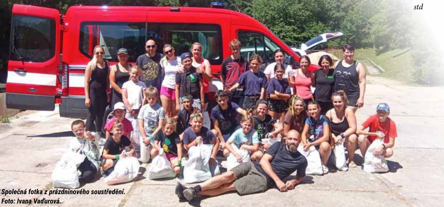
Společná fotka z prázdninového soustředění.