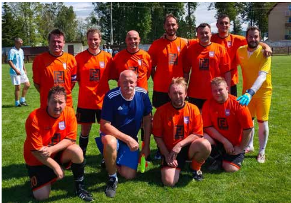
Lhotské internacionály v Moravském Berouně doplnili domácí fotbalisté.

První srpnovou sobotu se staří páni naší Lhoty zúčastnili 13. ročníku turnaje v Moravském Berouně. Letošního ročníku se opět zúčastnila mužstva z partnerských měst pořadatele – slovenské Tepličky nad Váhom a polského města Bieruň, které vyslalo dokonce dvě družstva.