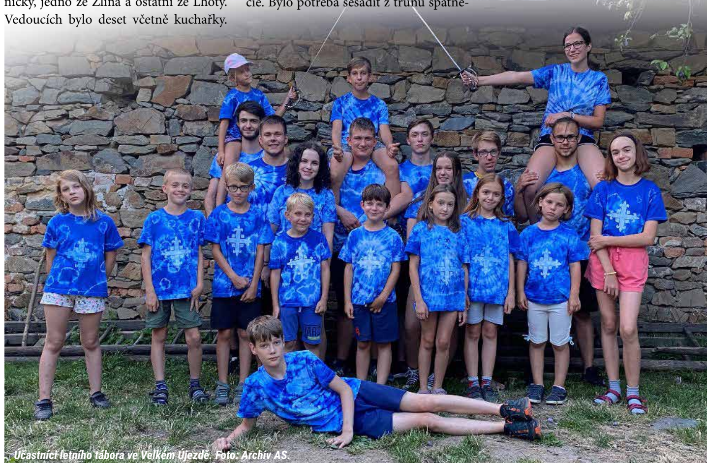
Účastníci letního tábora ve Velkém Újezdě.