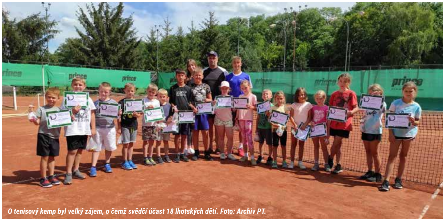
O tenisový kemp byl velký zájem, o čemž svědčí účast 18 lhotských dětí.