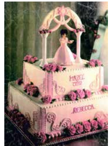
Dorty – to byla specialita vyhlášené cukrářky.