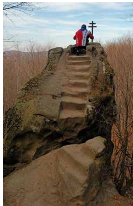
Známy útvar Kazatelna v Chřibech.

Máte i vy tip na výlet v blízkém nebo i vzdálenějším okolí? Napište nám, rádi ho i s vaším komentářem zveřejníme.