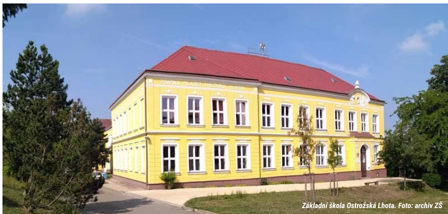
Základní škola Ostrožská Lhota.