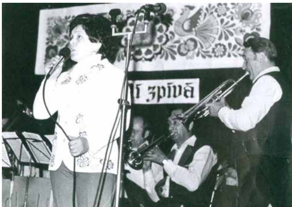
Slavné roky s dechovkou Rozmarýnka.