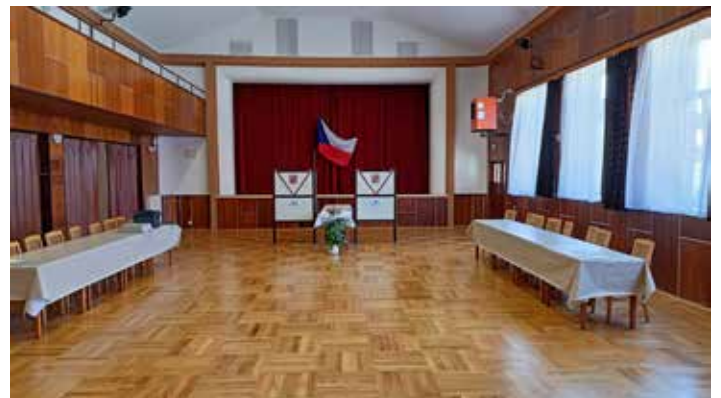
Parkety po renovaci v obecním sále.