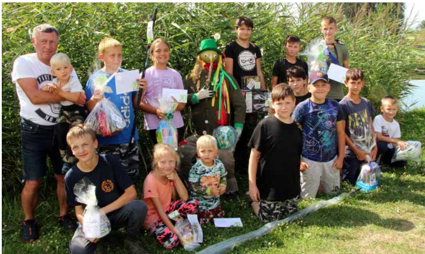
Dětské rybářské závody, které se uskutečnily o prvním víkendu v srpnu. Tady jsou nejlepší.