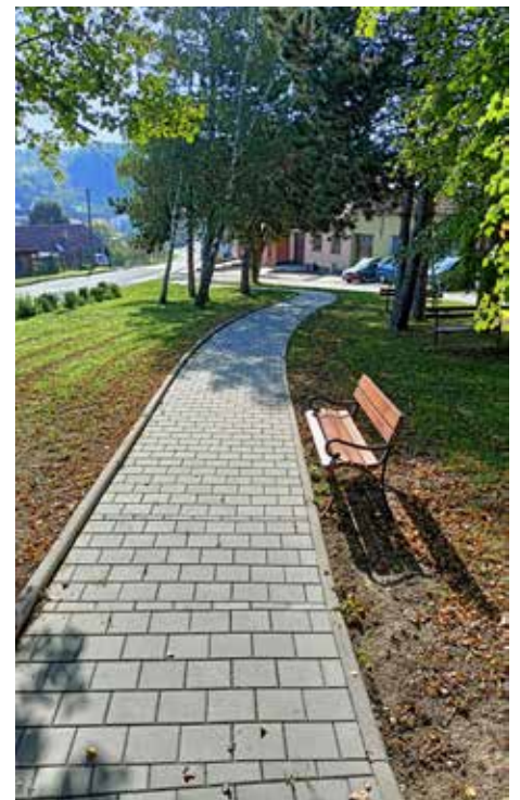
Nový chodník v ul. Chřib