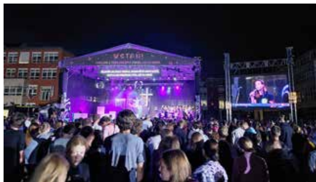
Atmosféra na setkání, na kterém probíhaly také koncerty.

Ve městě Lisabon, které je rodištěm nám dobře známého světce sv. Antonína Paduánského.