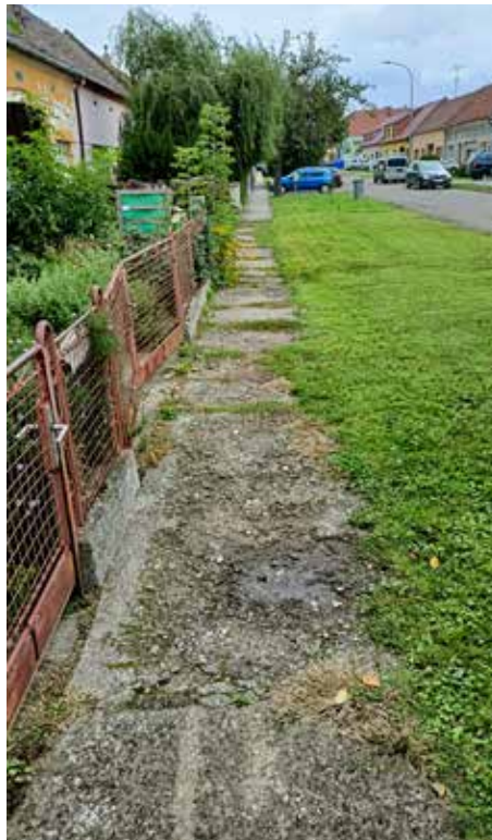
Chodník ul. Býčiny. Původní stav (vlevo) a nový chodník →

Oprava stávajícího chodníku v délce cca 128 m vč. uložení „elektrochráničků“ pro optické kabely, kterou realizuje firma SVS-Correct, cena díla dle smlouvy je 343 tis. (vč. DPH).