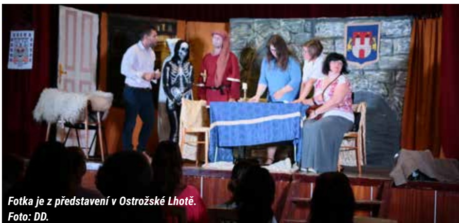
Fotka je z představení v Ostrožské Lhotě. Foto: DD.