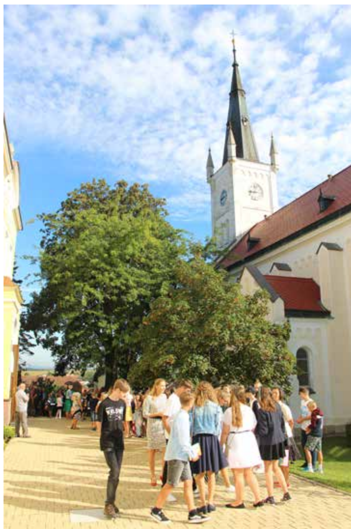
Zahájení nového školního roku 2022/2023.