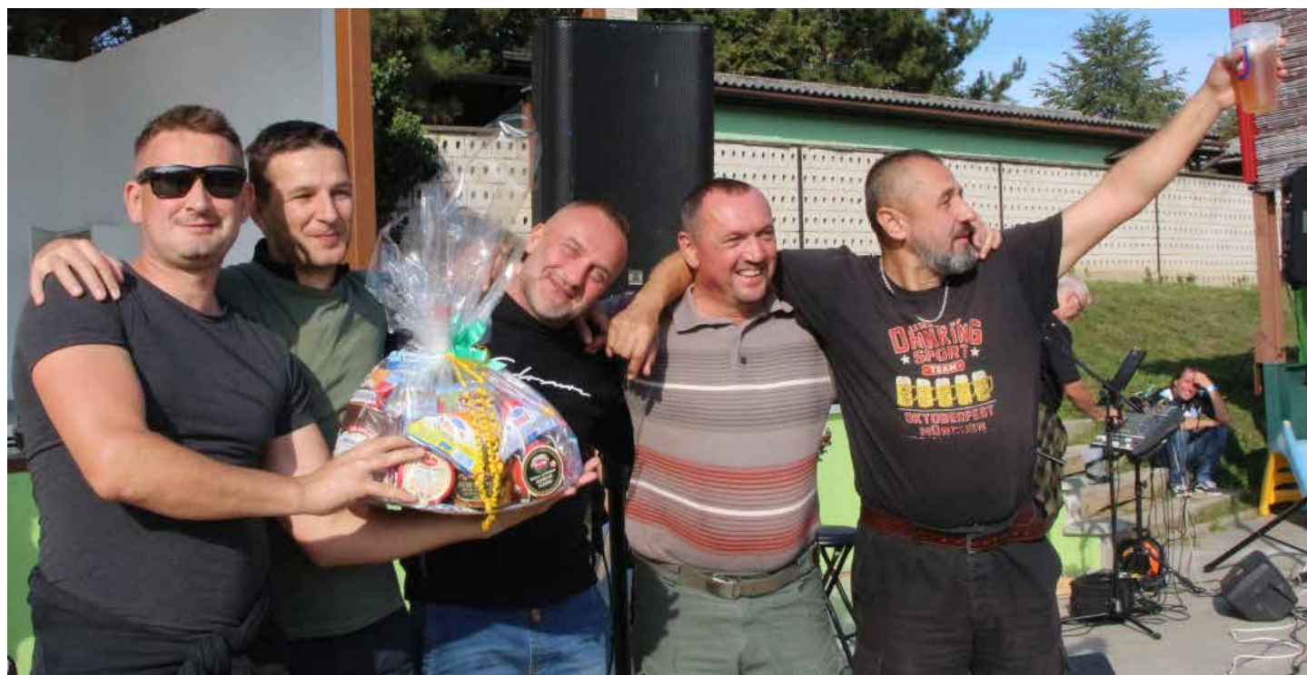
První místo získal tým, který si říkal Márná snaha a přijel z Nového Města nad Váhom.