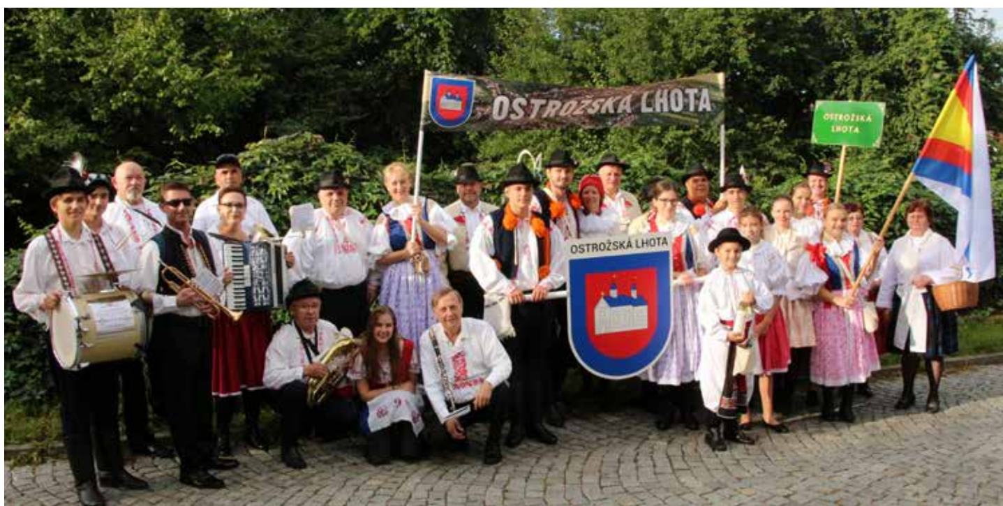
Výprava naší Lhoty na letošních slavnostech.