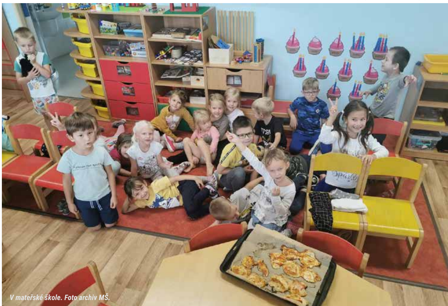
V mateřské škole.

Za kolektiv MŠ Radka Bočková, zástupkyně ředitele školy pro MŠ