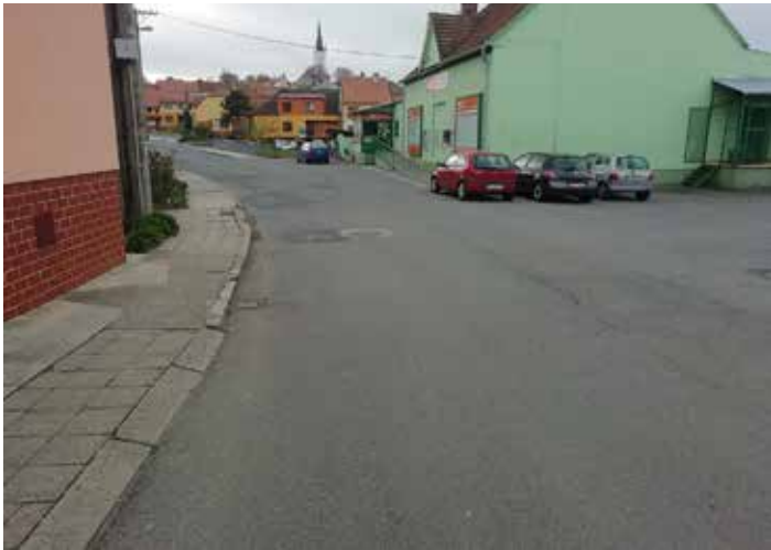
Prostor před prodejnou Jednota před zahájením prací.