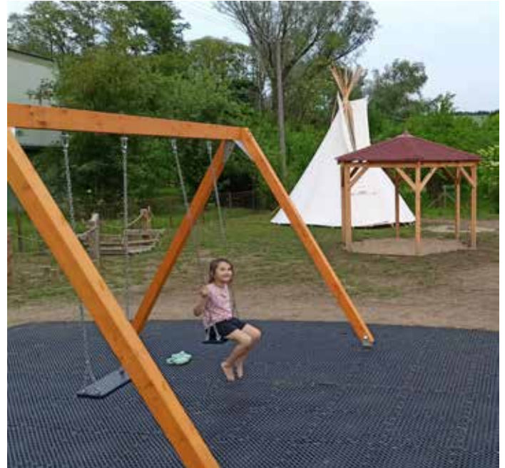
Úprava veřejného prostoru u zdravotního střediska