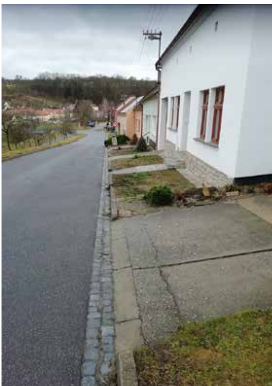
Ul. Chřib před zahájením prací