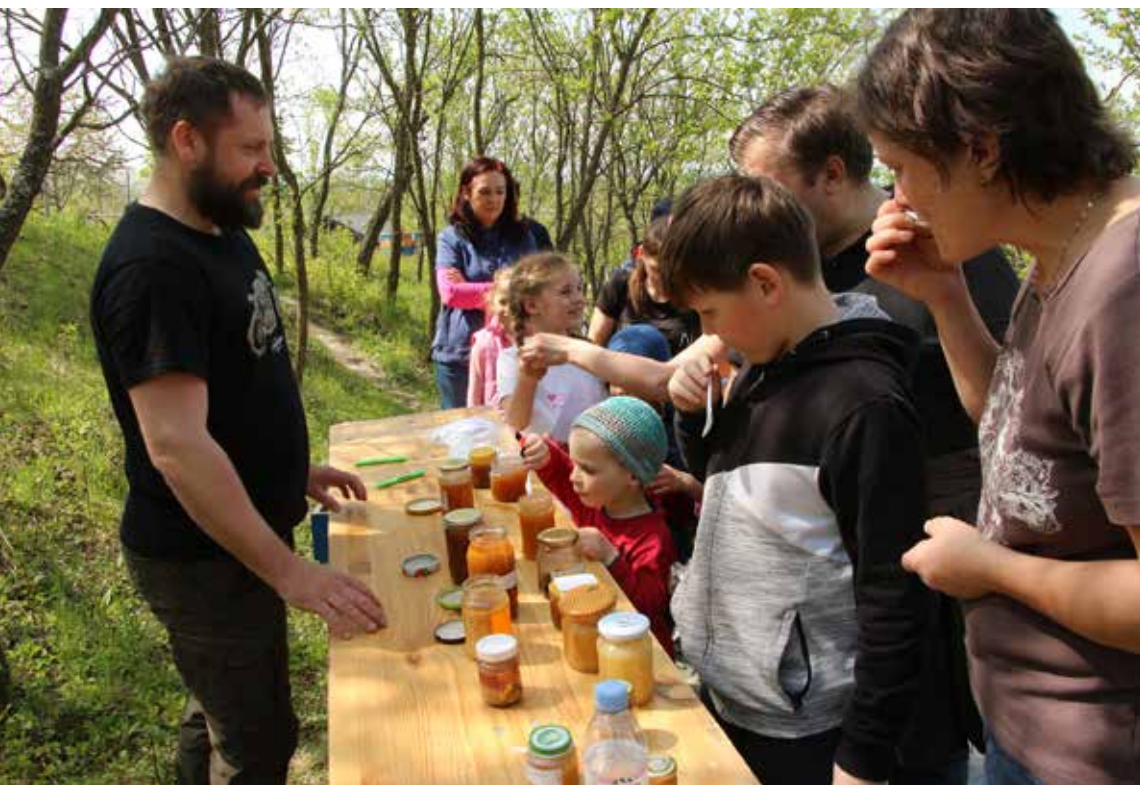
Jedno ze zastavení na stezce bylo u ochutnávání medu.