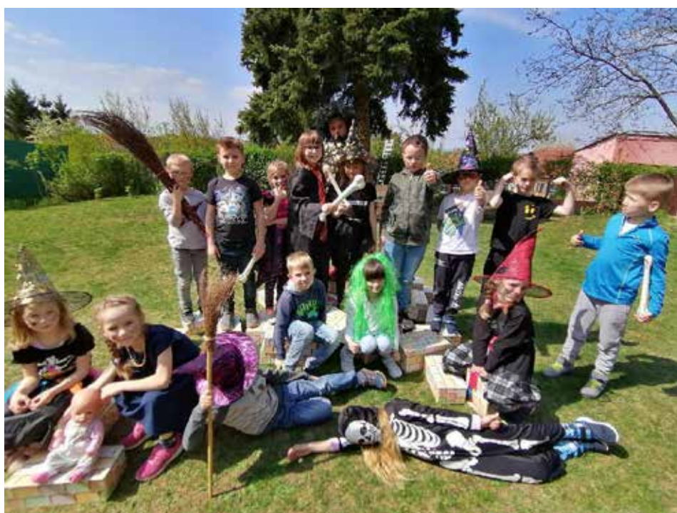
Koncem dubna se na školní zahradu sletěli ti nejlepší uchazeči o čarodějnické studium.