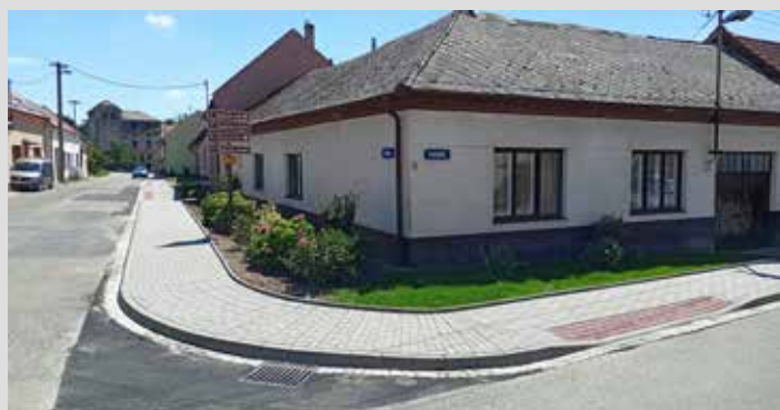
Nový chodník v ul. Burešín