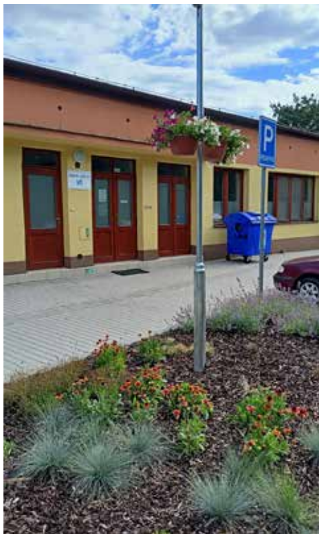
Vysázený prostor u zdravotního střediska