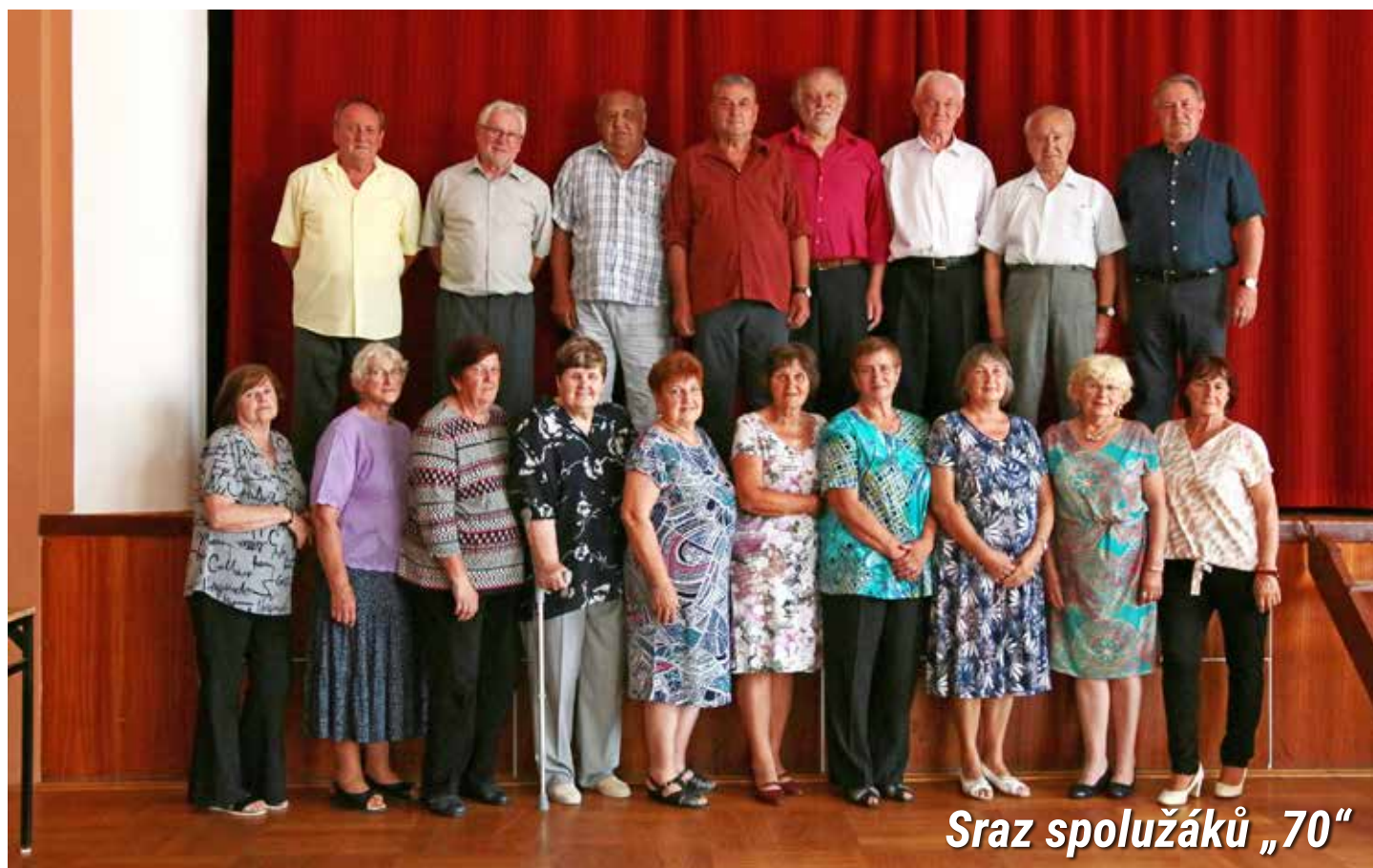
Sraz spolužáků „70“