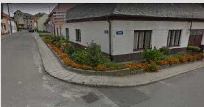
Ul. Burešín před zahájením prací