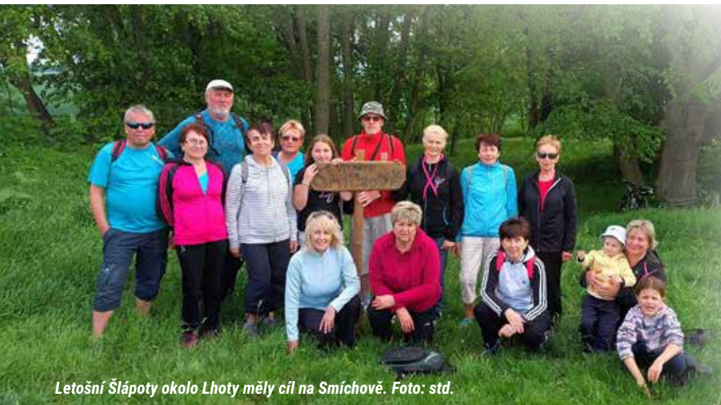
Letošní Šlápoty okolo Lhoty měly cíl na Smíchově.