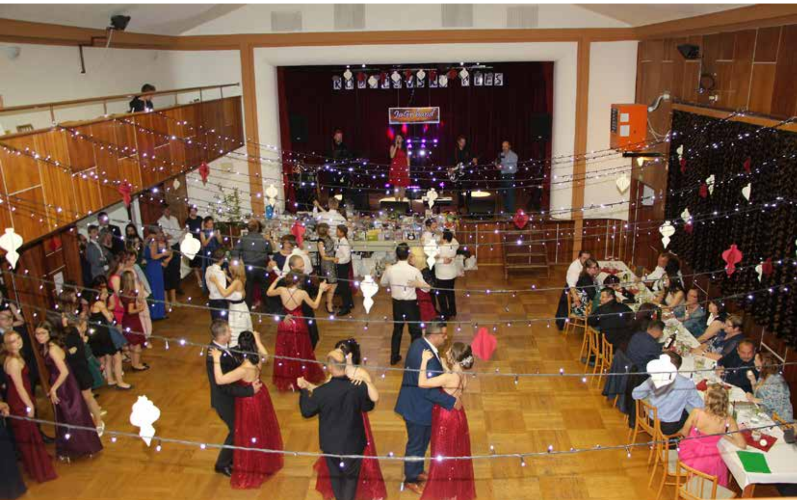
Po polonéze bylo sólo pro rodiče a deváťáky.

Žáci nacvičovali polonézu pod vedením Kateřiny Pěničkové a Michaely Mačátové.