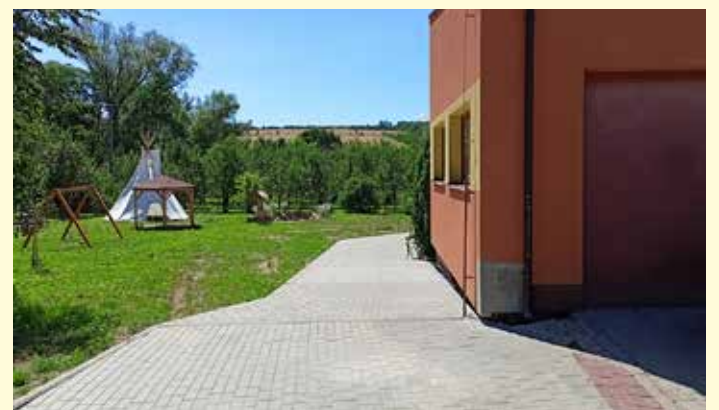
Nový chodník a sjezd ke zdravotnímu středisku