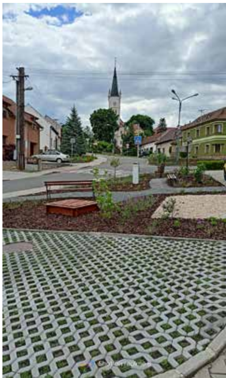
Vysázený prostor u cukrárny

Poděkování patří dárcům rodině Šuránkových a Ostrožsko, a.s., kteří přispěli peněžitými dary na doplnění herních prvků v obci.