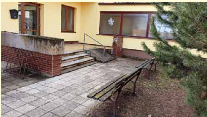
Rampa u zdravotního střediska před zahájením prací