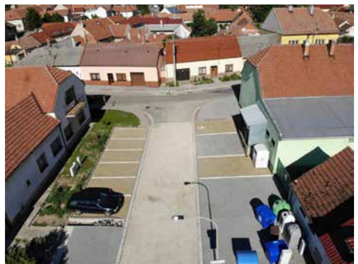
Parkovací stání před dokončením