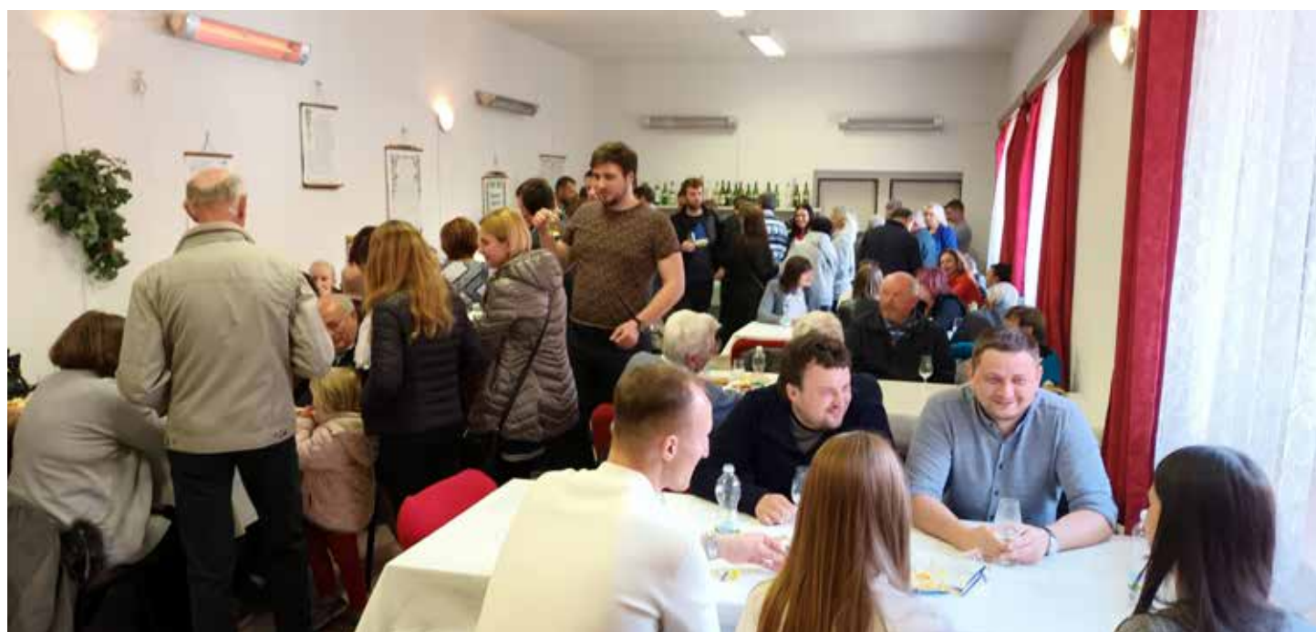
Objekt zahrádkářů na staré sokolovně byl takřka celé odpoledne plný.