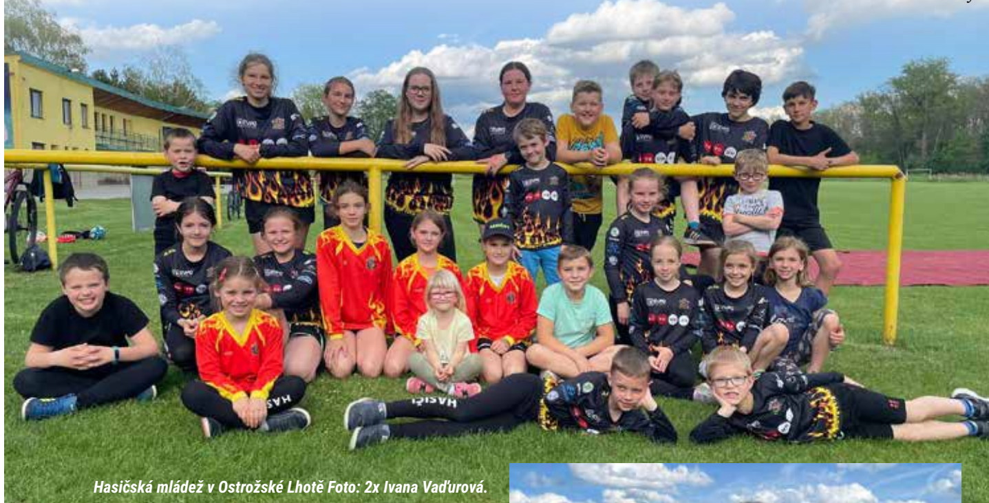
Hasičská mládež v Ostrožské Lhotě