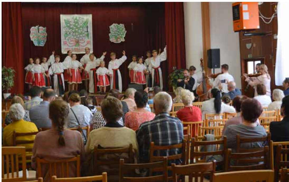
V zaplněném sále se představily děti z Kameňáčku.