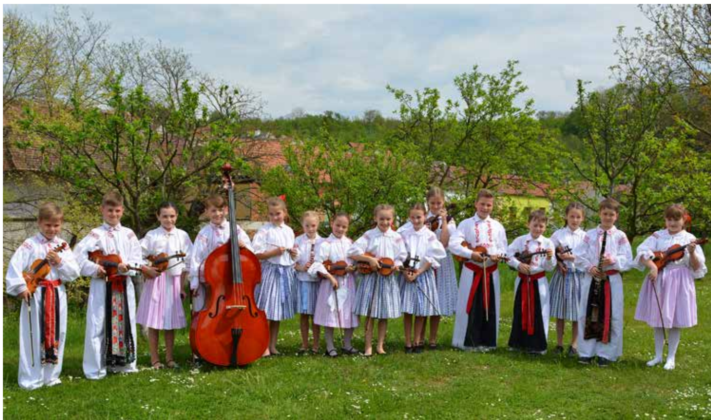
Mladí muzikanti ze Základní umělecké školy v Uherském Ostrohu.