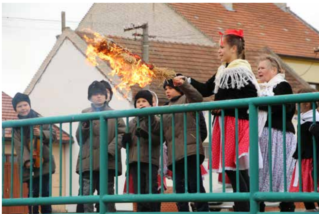
Po dvou letech koronavirových zákazů se v naší obci znovu obnovil starodávný zvyk. Děti u mostu v Hájků hodily do potoka Morenu, ozdobily létečko a přivítaly jaro.