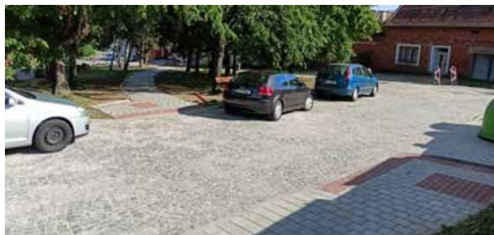
Část nového chodníku v ulici Chřib