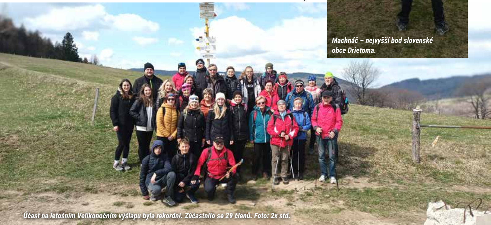
Účast na letošním Velikonočním výšlapu byla rekordní. Zúčastnilo se 29 členů.