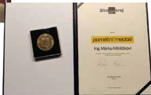
Pamětní medaile.