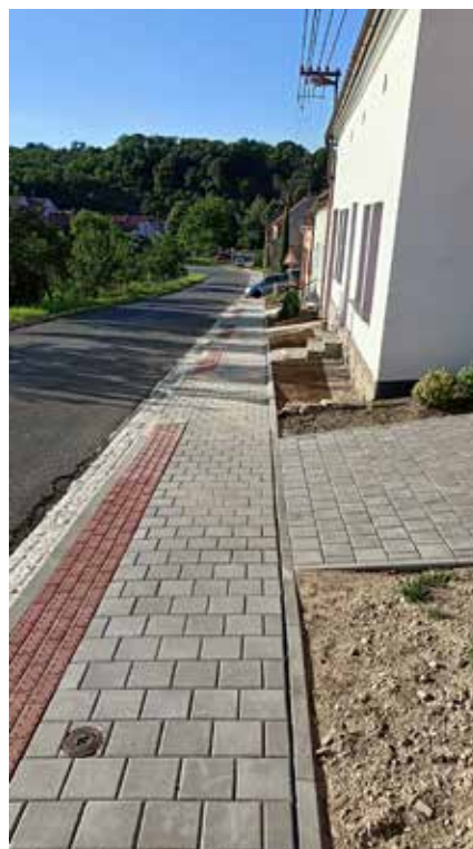
Nový chodník v ul. Chřib