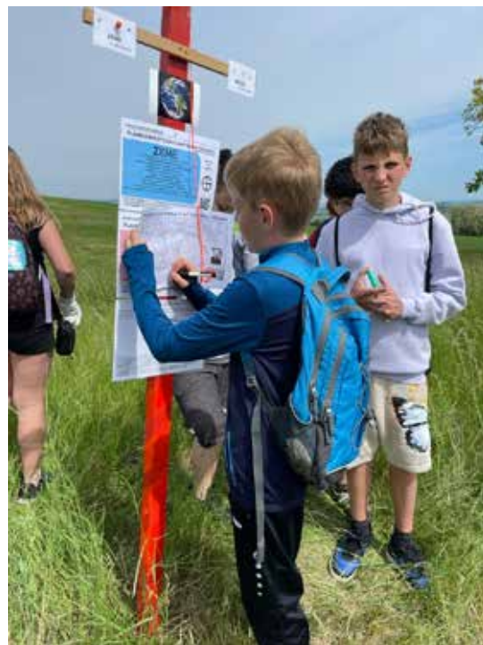
Po cestě využili školáci Planetární stezku P. Antonína Šuránka.