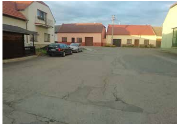
Prostor před prodejnou Jednota před zahájením prací.