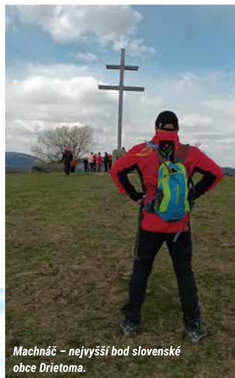
Machnáč – nejvyšší bod slovenské obce Drietoma.