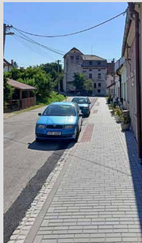
Nový chodník v ul. Burešín