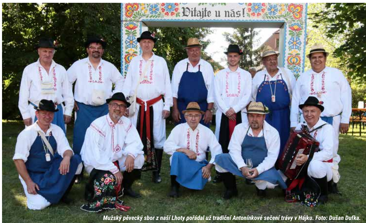
Mužský pěvecký sbor z naší Lhoty pořádal už tradiční Antonínkové sečení trávy v Hájků.