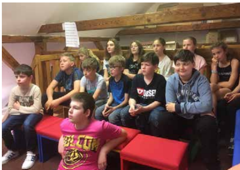
Do čtenářské výzvy se zapojili také žáci naší školy.