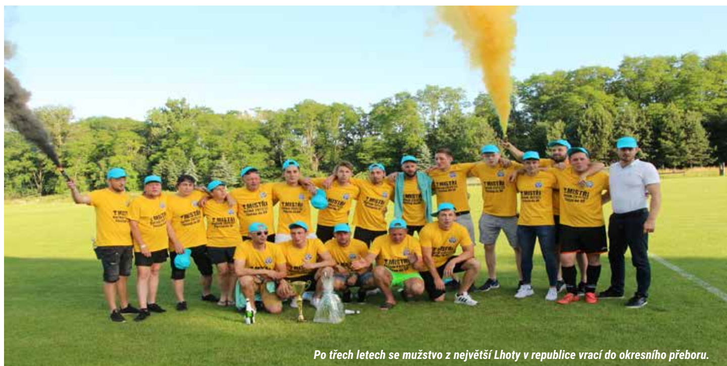
Po třech letech se mužstvo z největší Lhoty v republice vrací do okresního přeboru.