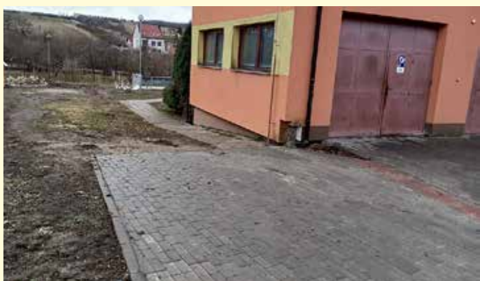
Chodník a sjezd ke zdravotnímu středisku před zahájením prací.

Svépomocí jsme upravili vstup k praktickému lékaři. Místo staré nevyhovující rampy jsme vybudovali novou, pohodlnou, funkční rampu, která zajišťuje bezbariérový přístup k lékaři. Byly vybudovány taktéž nové schody, které mají o jeden stupeň méně než předchozí (viz foto). Pracovníkům obce děkují za dobře odvedenou práci.