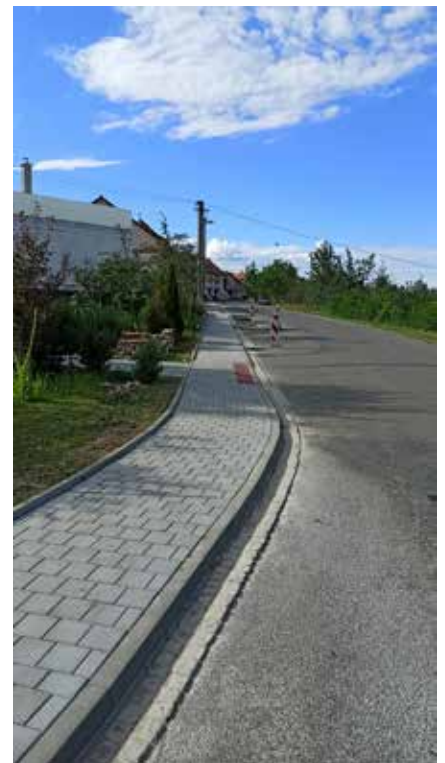
Nový chodník v ul. Chřib