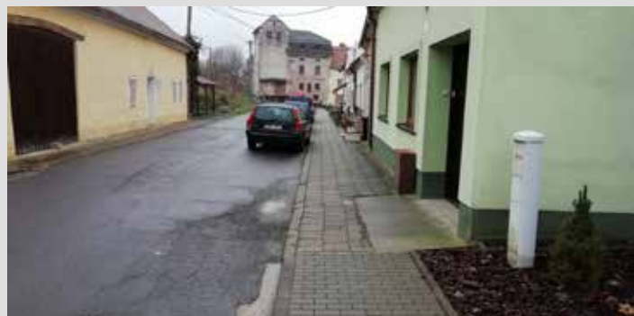
Ul. Burešín před zahájením prací