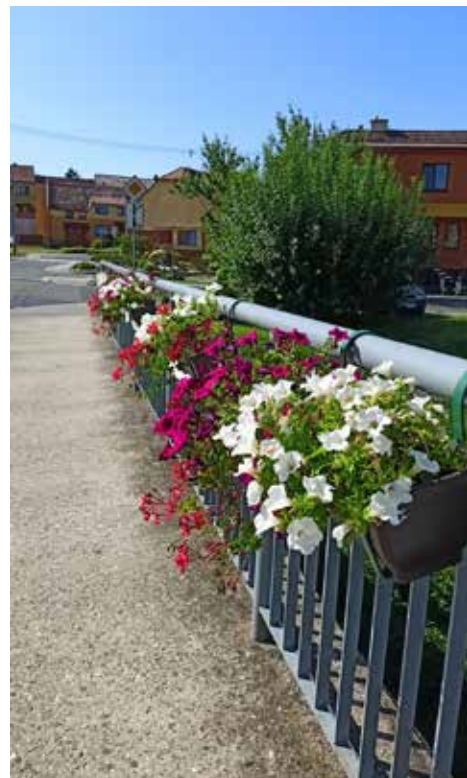
Vysázené květináče na mostě.