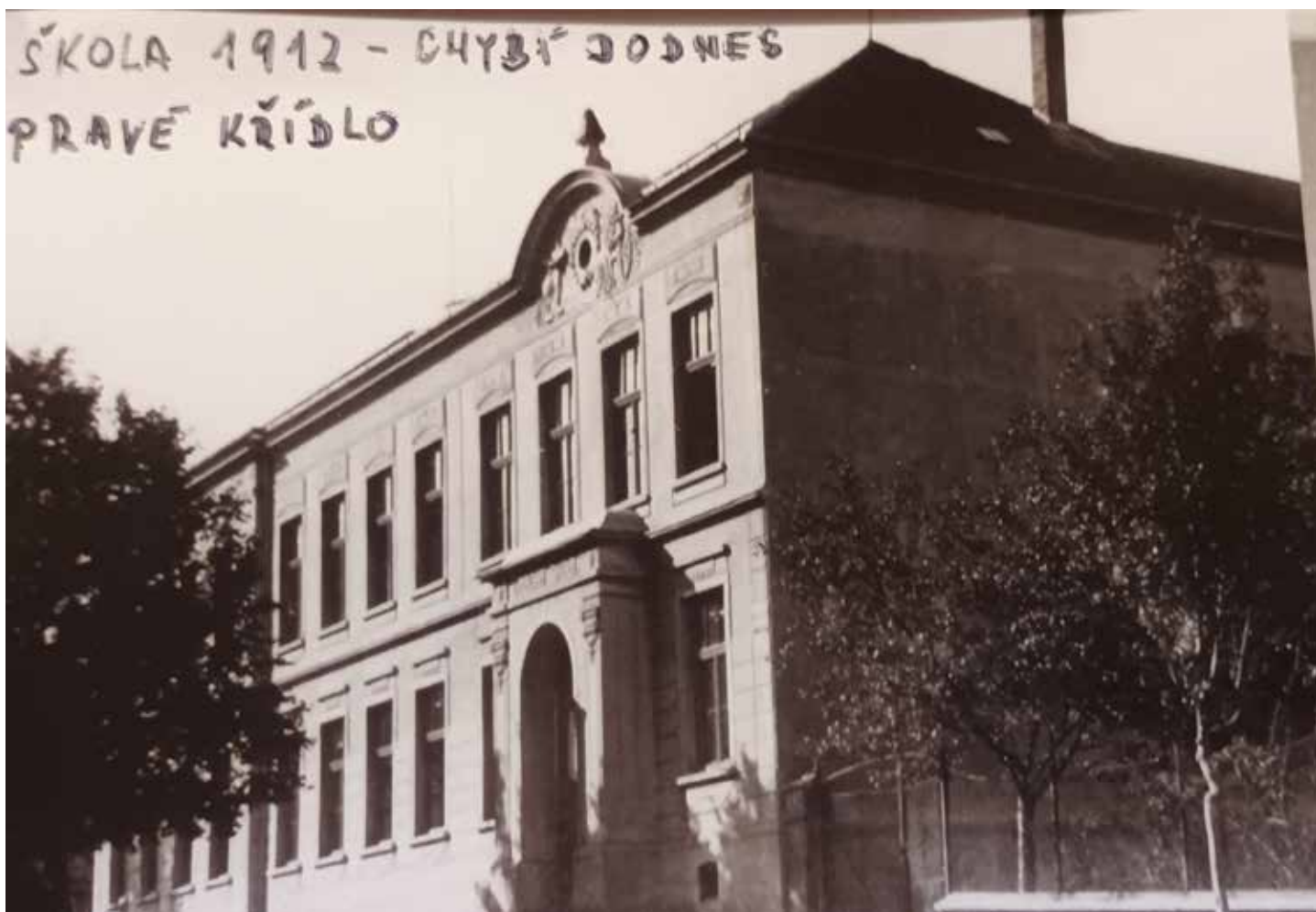
Současná škola je už třetí školní budovou ve Lhotě. Schází jí pravé křídlo, to se nakonec kvůli nedostatku peněz ani nestavilo.

Lhotská škola a všechno kolem ní. Takové bylo letošní téma výstavy fotografií v Lidovém domečku Háječek, který se otvíral poslední dubnovou nedělí.