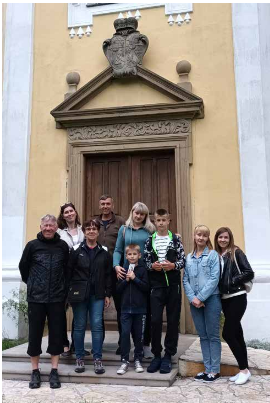
Společná fotka u kaple na Antonínku.