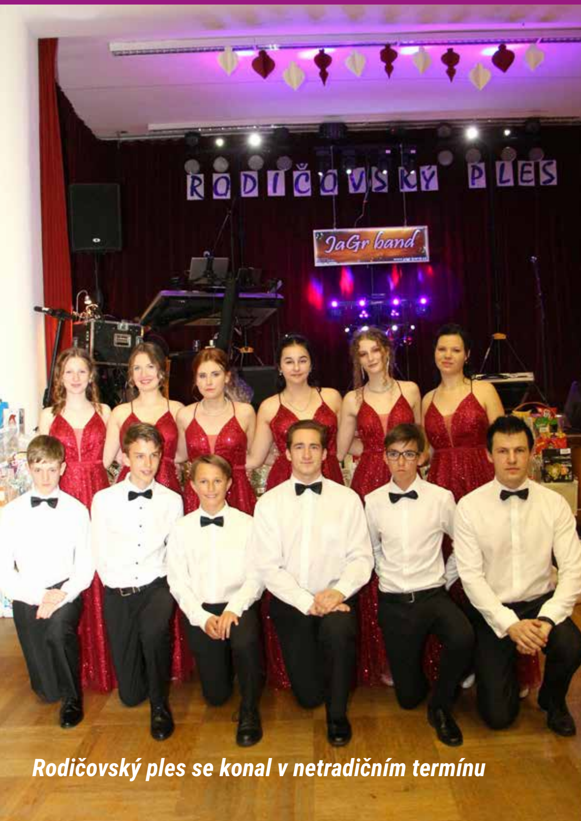
Rodičovský ples se konal v netradičním termínu

ČERVENEC 2022 • ČTVRTLETNÍK OBČANŮ OSTROŽSKÉ LHOTY • CENA 10Kč