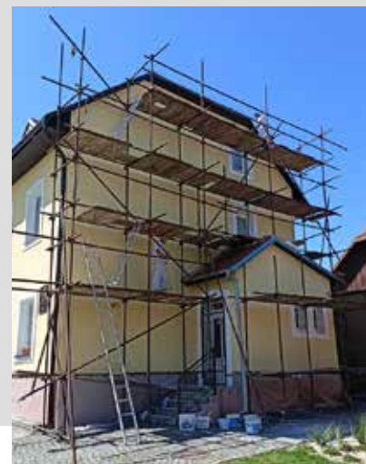
Oprava fasády na budově pošty