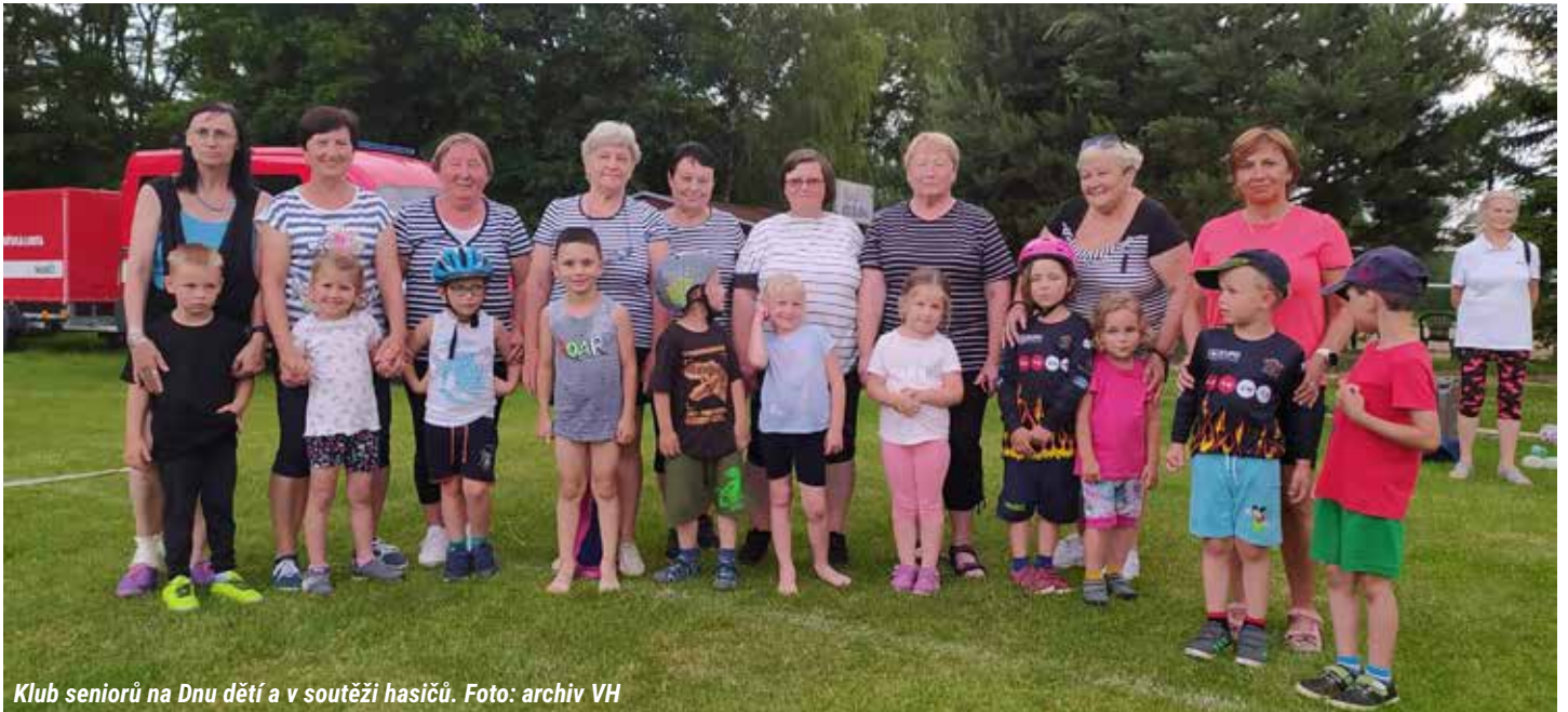
Klub seniorů na Dnu dětí a v soutěži hasičů.