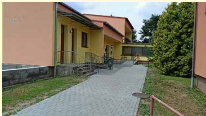
Nový chodník ke zdravotnímu středisku