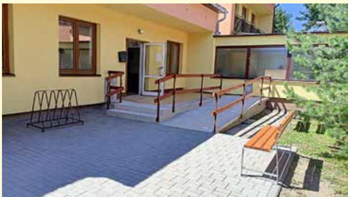
Nová rampa u zdravotního střediska