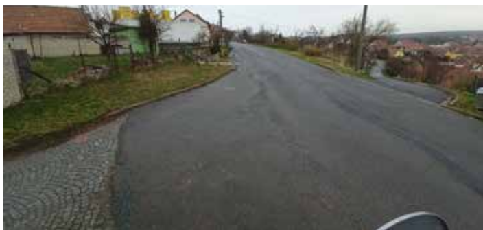
Ul. Chřib před zahájením prací