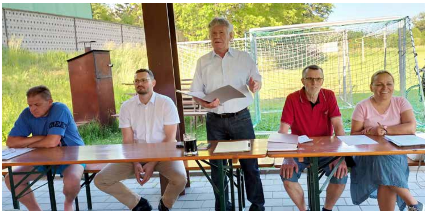
Výroční konference se stejně jako v uplynulém roce uskutečnila pod přístřeškem na hřišti.