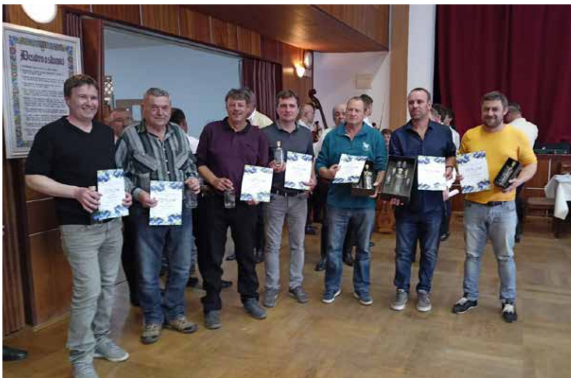
Ocenění vítězové lhotského koštu slivovice.