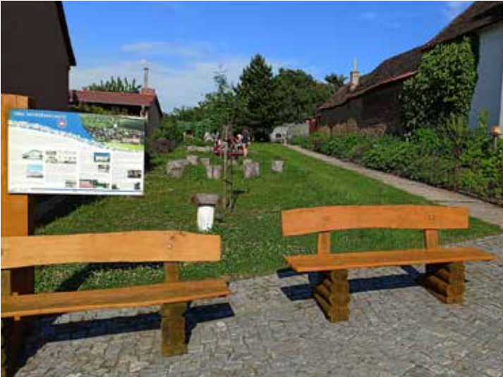
Úprava veřejného prostoru u Sv. Jana