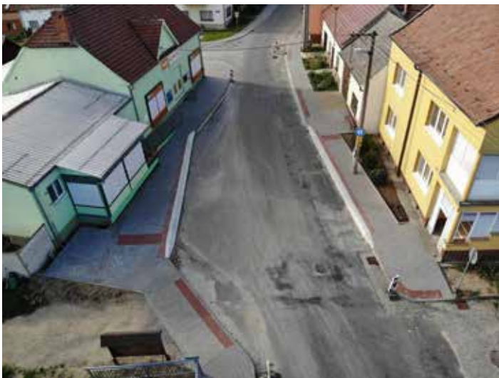
Nová autobusová zastávka před dokončením