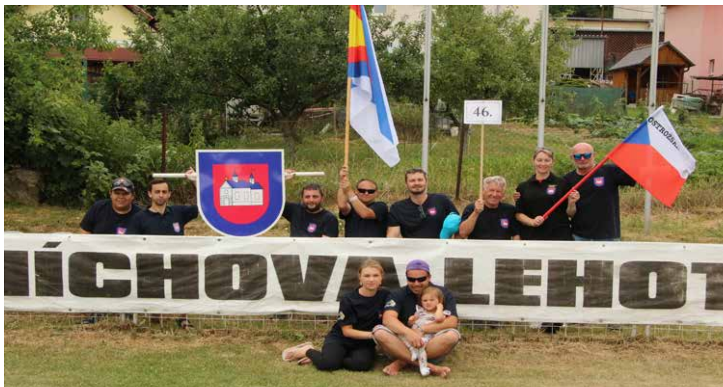
Sraz Lhot: Výprava naší obce na letošním srazu.