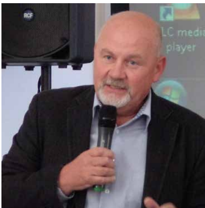
Od pohanství ke křesťanství aneb Moravané vstupují do dějin. Přednášel doc. PhDr. Luděk Galuška, CSc.