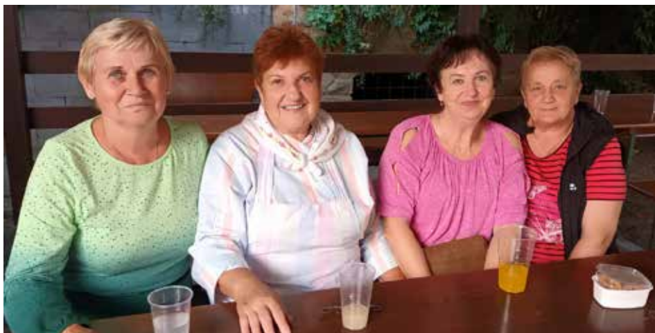
Organizátorům podzimního posezení vyšlo nádherné počasí. Na snímku pravidelné účastnice akcí v Lidovém domku.