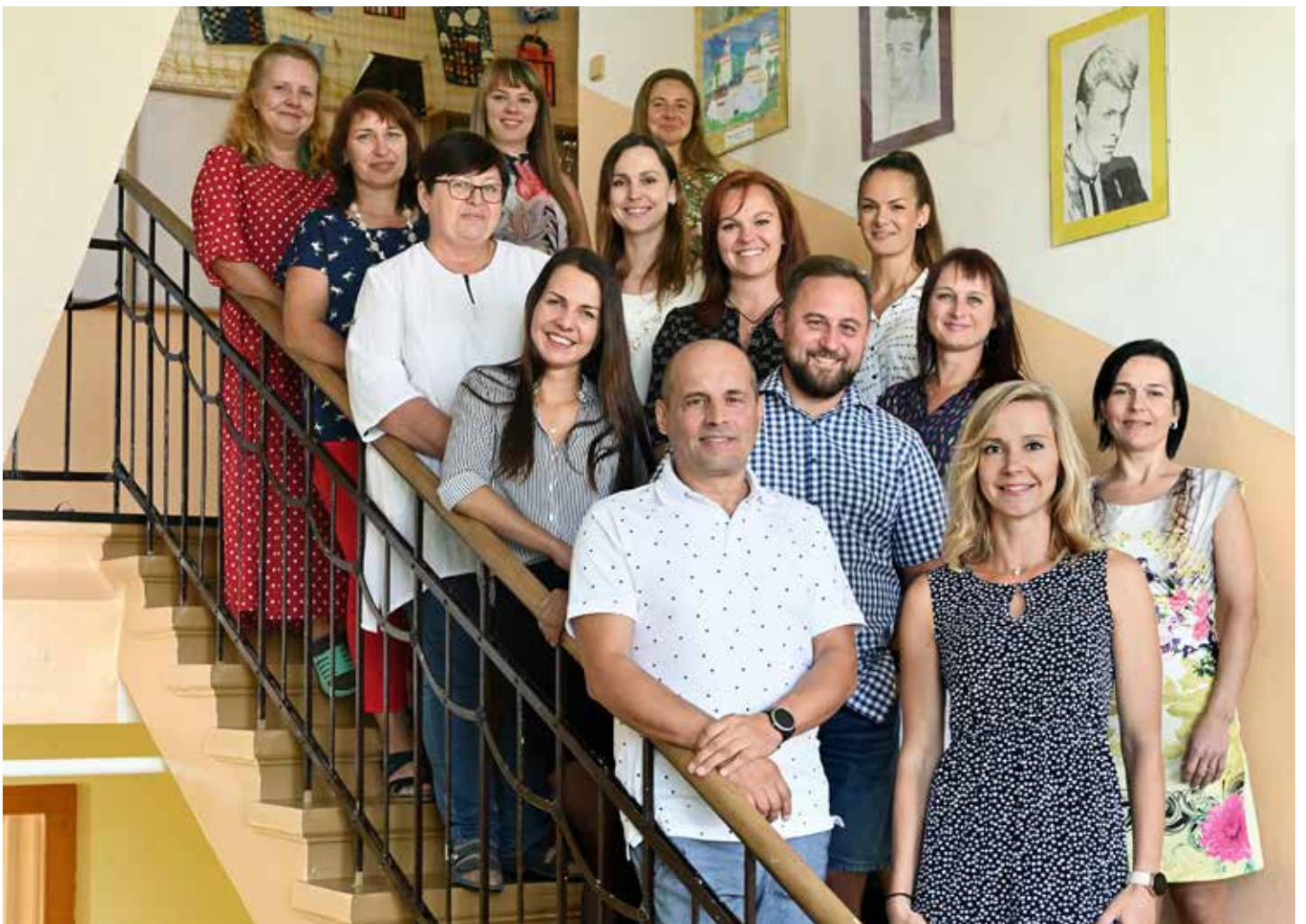
Učitelský sbor ZŠ