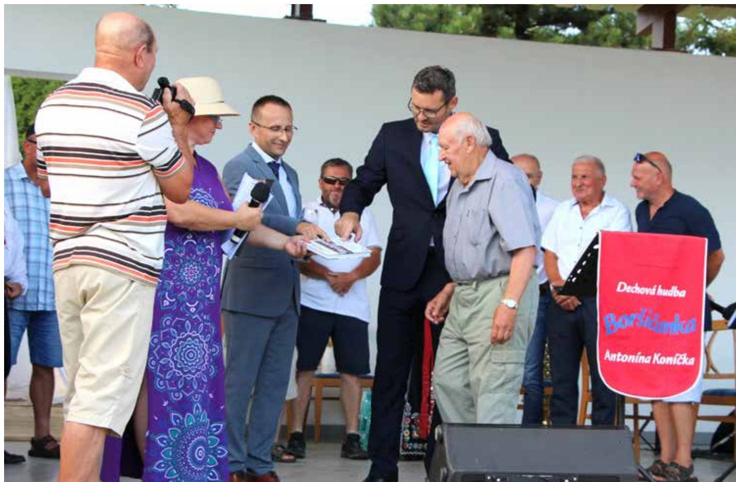
Křest knihy Když Lhota žila dechovkou proběhl v rámci oslav 650. výročí zmínky o obci.