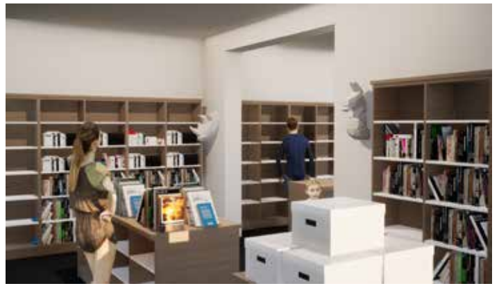
Interiér nové knihovny