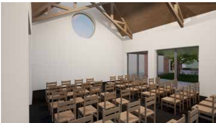
Interiér přednáškového sálu