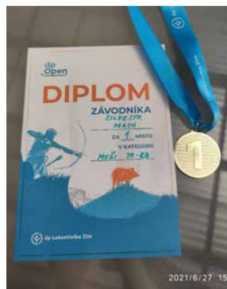
Diplom a medaile z dalších zlínských závodů.

„Jako vždy je konkurence veliká a cením si každého umístění. Mnohokrát o umístění rozhoduje i jeden jedi-