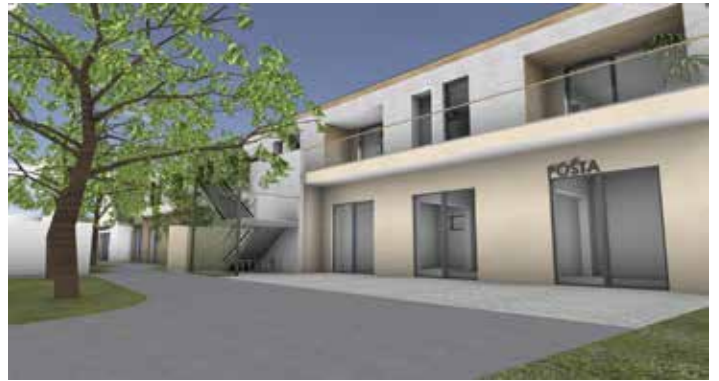
Vize polyfunkčního domu na „Býkárkách“