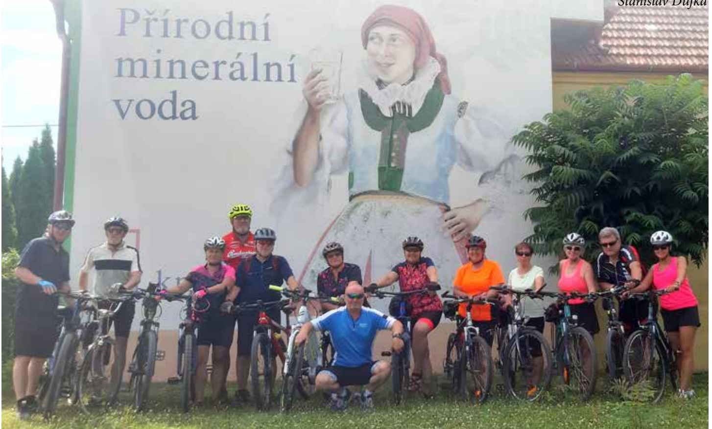
Na kole ze Lhoty do Suché Lozi. Trasa (tam i zpět) měří 44 km.