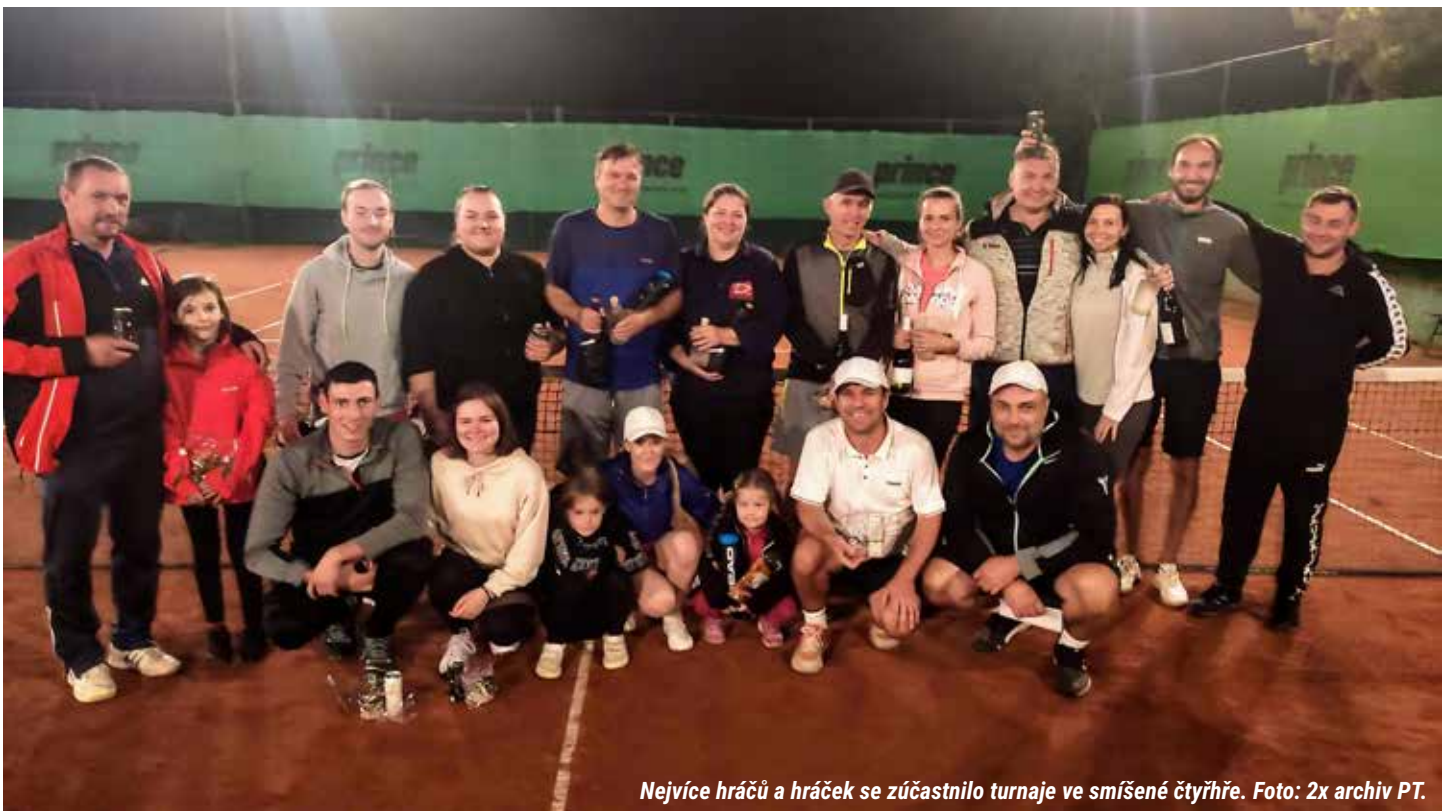
Nejvíce hráčů a hráček se zúčastnilo turnaje ve smíšené čtyřhře.