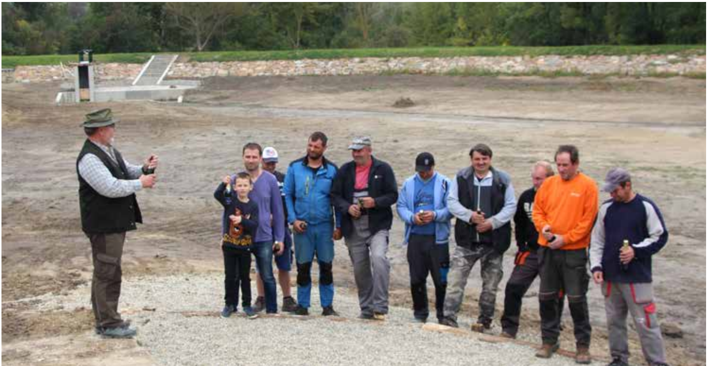
Zaměstnanci firmy Paleso při spuštění zkušebního provozu.