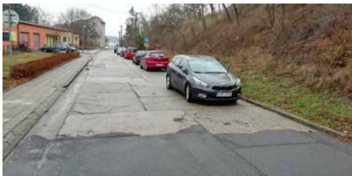
Prostor před MŠ před rekonstrukcí.

Souběžně s výše uvedenou zakázkou jsme zrekonstruovali veřejné osvětlení před MŠ a sportovní halou. Tento