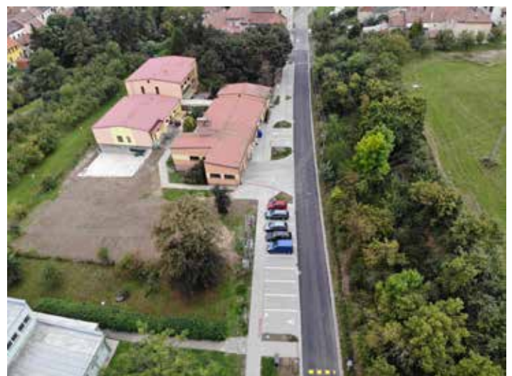
Prostor před MŠ po rekonstrukci.

Od sportovní haly ke hřišti v délce 74 m máme zrekon-