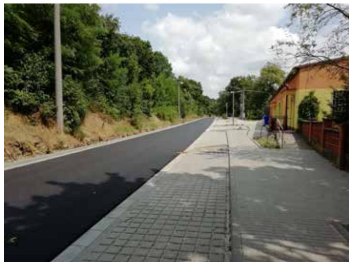
Prostor před MŠ po rekonstrukci.