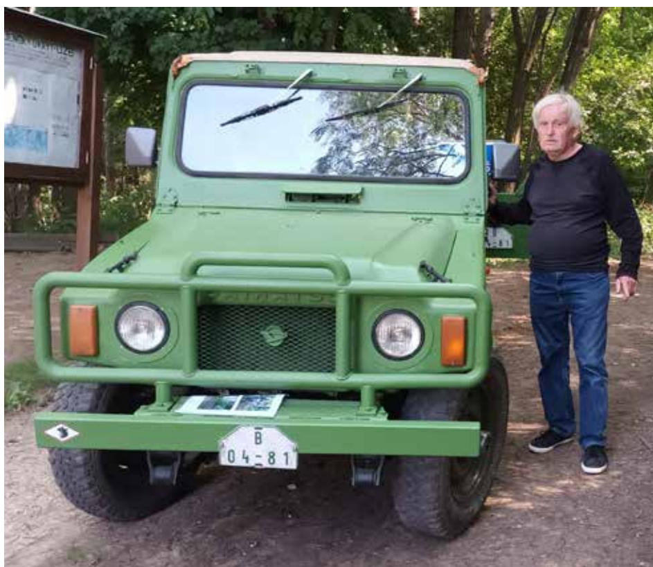
Poprvé se Jeep představil o letošních prázdninách. Premiérově ho viděly děti z příměstského tábora uherskohradištského Mesitu.

„Pořizovali jsme ho primárně na vožení dětí u bunkru. Budeme ho využívat na dětský den, zahájení sezony