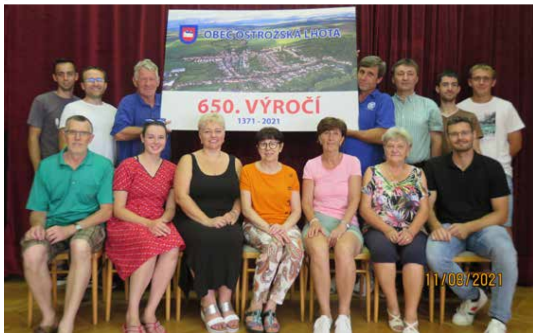
Vedoucí spolků a hlavní organizátoři oslav 650. výročí první zmínky o obci.

Všechno se navrhovalo postupně. První námět byl pozvat nějakou velkou kapelu – třeba Čechomor. Bylo to ještě v rámci různých covidových nařízení a omezení. Nakonec jsme zvolili variantu, ve které vystoupily většinou místní složky, něco jako Lhota pro Lhotu. Drželi jsme se při zemi, protože nebylo jasné, jaká bude situace ohledně opatření proti covidu-19.