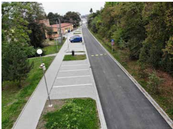
Prostor před MŠ po rekonstrukci.

struovaný chodník za 215 tis Kč s DPH. Taktéž proběhla rekonstrukce chodníku před mlýnem v úseku od sjezdu k pálenici po mlýn v délce 45 m (za 141 tis. Kč s DPH). Dále máme opravenou cestu za školkou (k pálenici) o ploše 121 m 2 (cena 127 tis.). Realizaci zmíněného díla provedla společnost Správa a údržba silnic Slovácka, s.r.o., kde celková cena byla 483 tis. Kč.