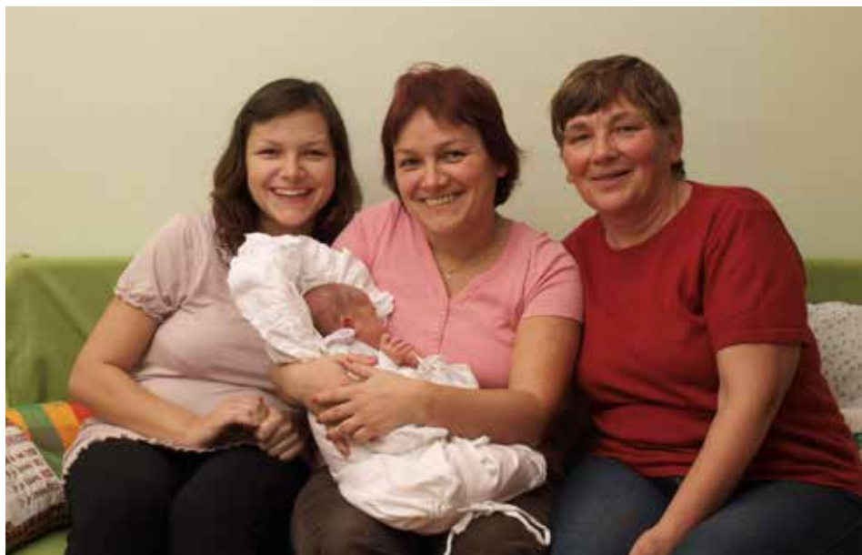
Čtyři generace Ludmil. Od nejmladší Lidušky (8), přes maminku (31), babičku (50) až po prababičku (72).