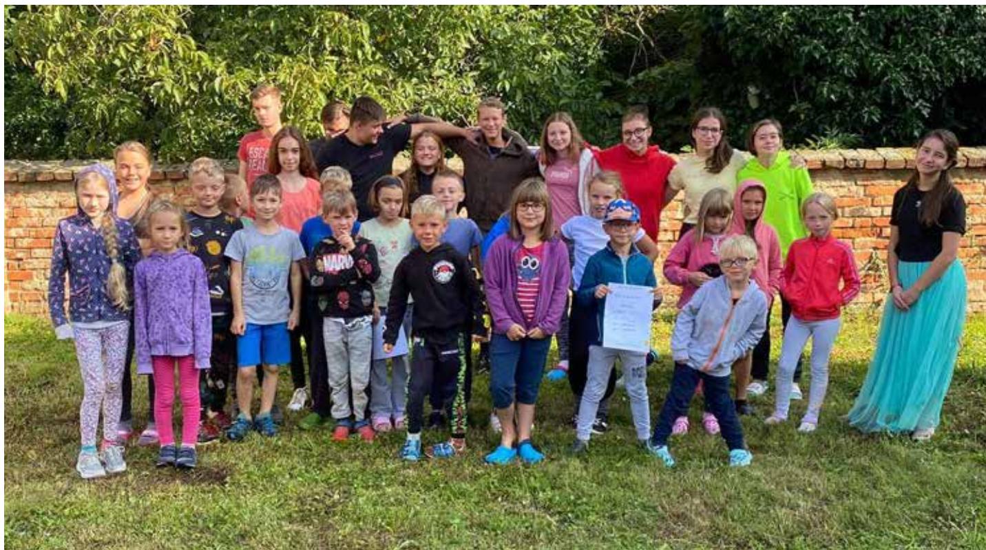
Poslední prázdninové dny jsme si všichni moc užili.