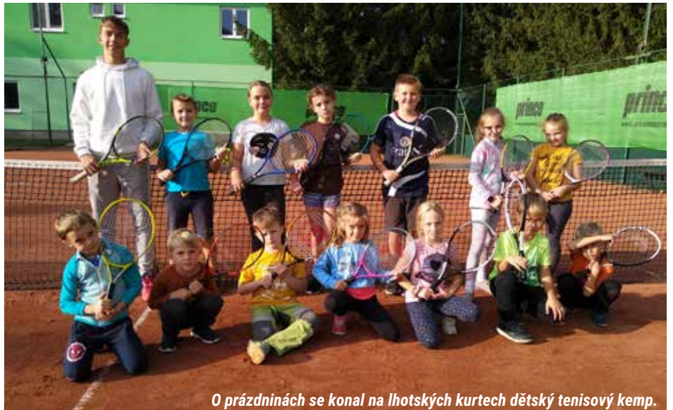
O prázdninách se konal na lhotských kurtech dětský tenisový kemp.