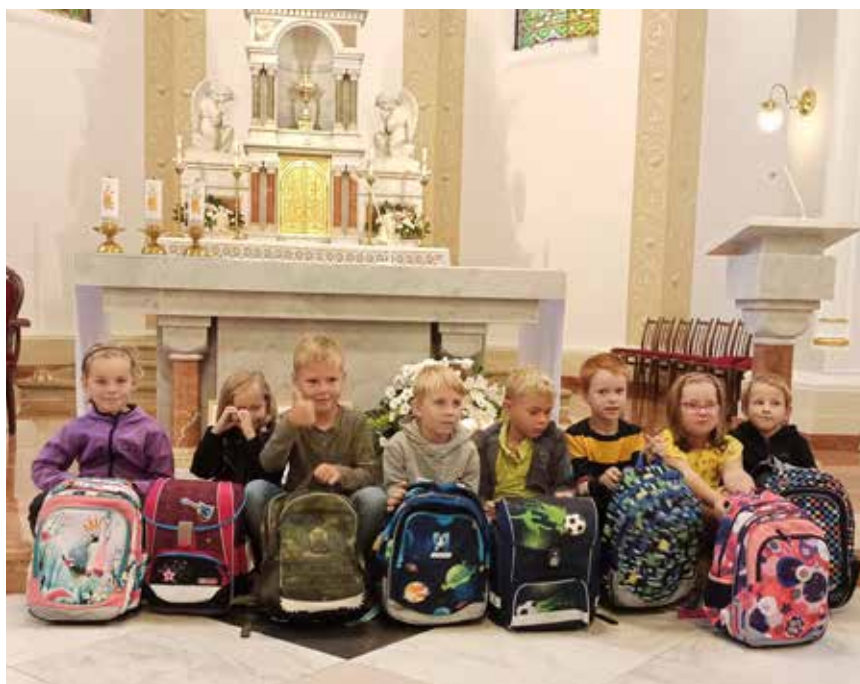
Žehnání aktovek lhotských prvňáčků.

I život školáka je někdy nelehký a není mu vždy vše v