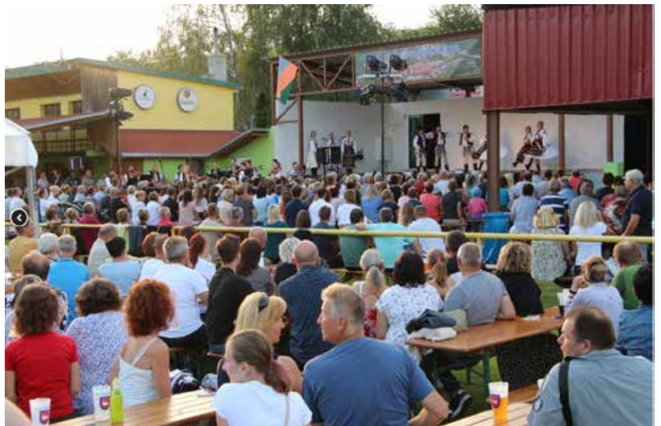
Čtvrteční vystoupení VUS Ondráš přilákalo přes tisíc návštěvníků.