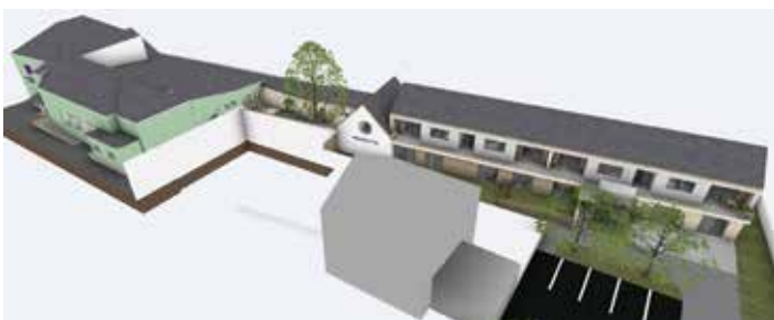
Vize polyfunkčního domu na „Býkárkách“