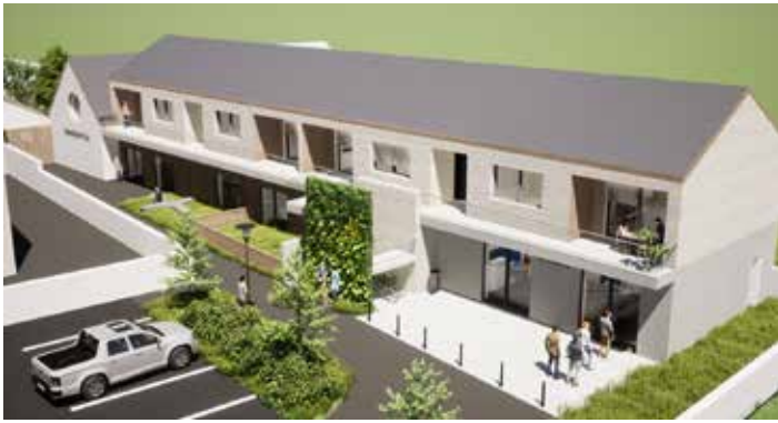
Vize polyfunkčního domu na „Býkárkách“