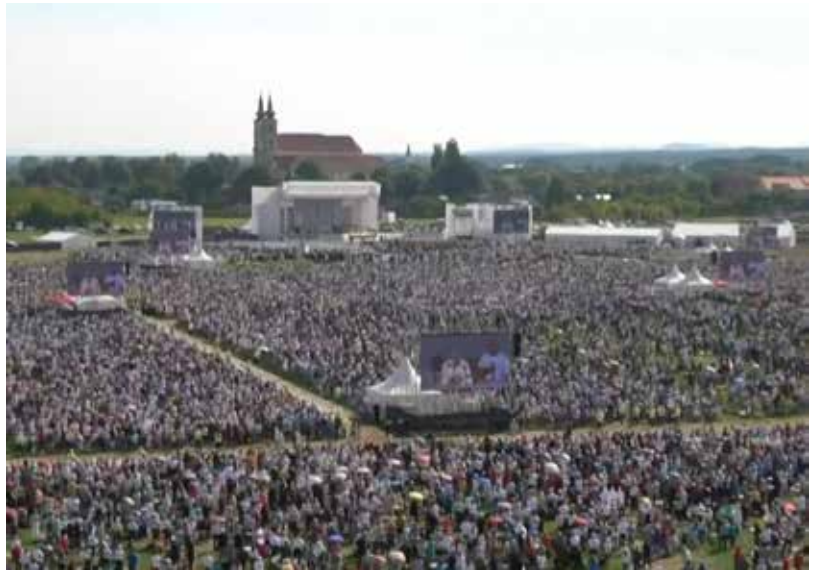
Šaštín – Stráže. Městečko je z naší Lhoty vzdáleno asi 60 km. Takto to vypadalo při návštěvě papeže.

Papež František dorazil na místo necelou půl hodinu po deváté, davu věřících zdravil ze svého papamobilu a během jízdy požehnal několika malým dětem. V deset