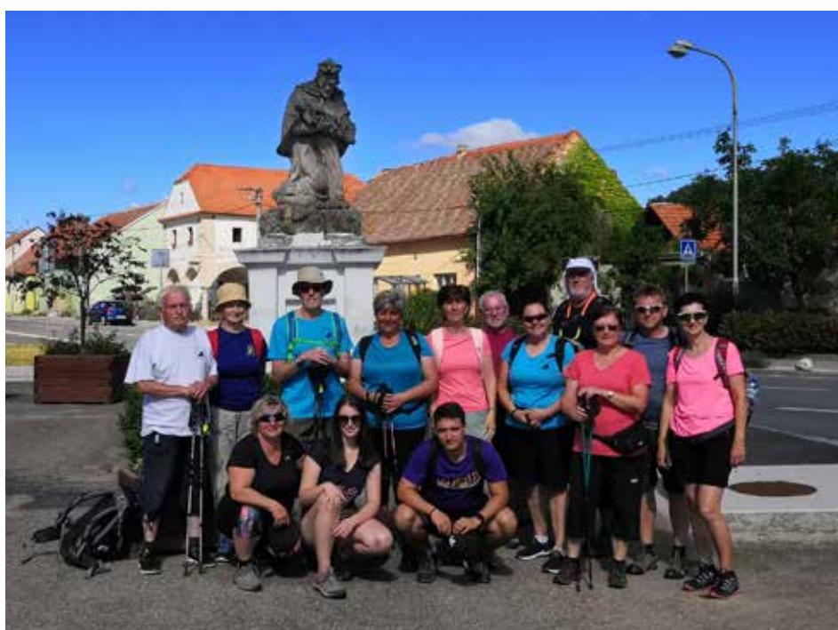
Turisté z naší Lhoty na přechodu Pálavy.