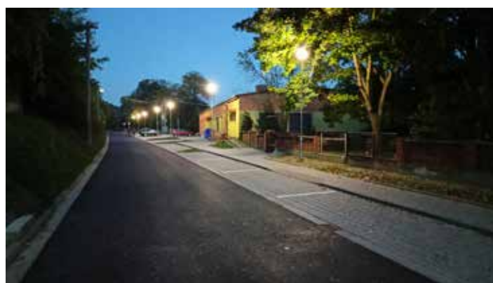
Nové veřejné osvětlení před MŠ.

se možnost vybudovat nové zázemí pro pracovníky a techniku obce u čističky odpadních vod – s tímto projektem jsem vás již seznámil v dubnovém čísle zpravodaje.