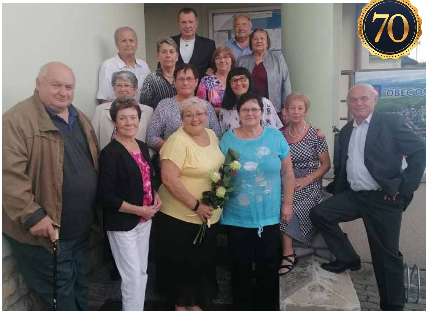
Sraz sedmdesátníků, Foto: 2 x Věra Pavlíňáková