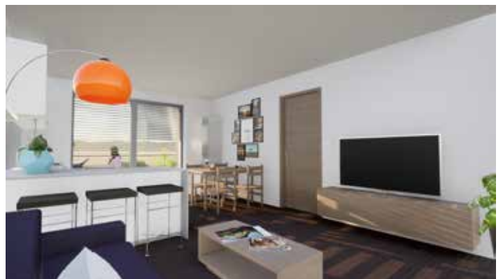
Interiér jednoho z bytů