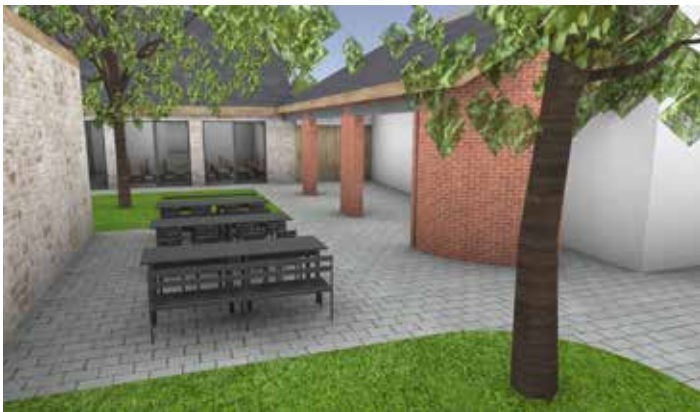
Venkovní prostor mezi obecním domem a pol. domem