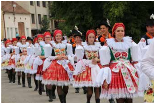
Hodová chasa šla z Hájku pro právo na obecní úřad.

„Na přípravu jsme měli čtyři týdny, což je strašně narychlo. Myslím