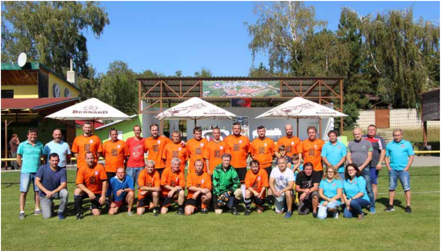
Domáci postavili velmi silný tým. Na snímku hráči a pořadatelé po slavnostním zahájení.