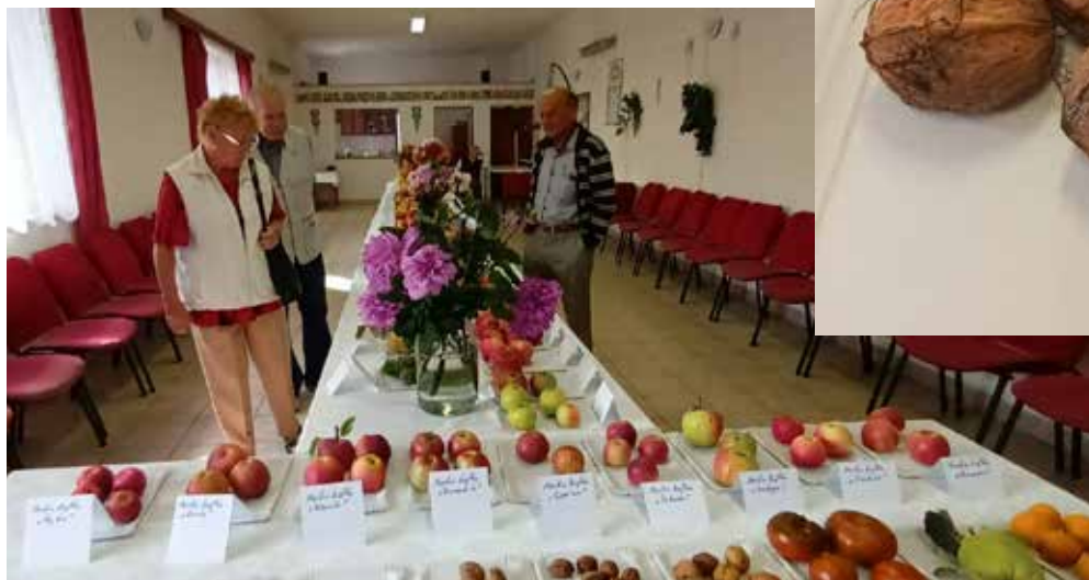
Letošní vystavené kousky věnovali zahrádkáři do školní jídelny.