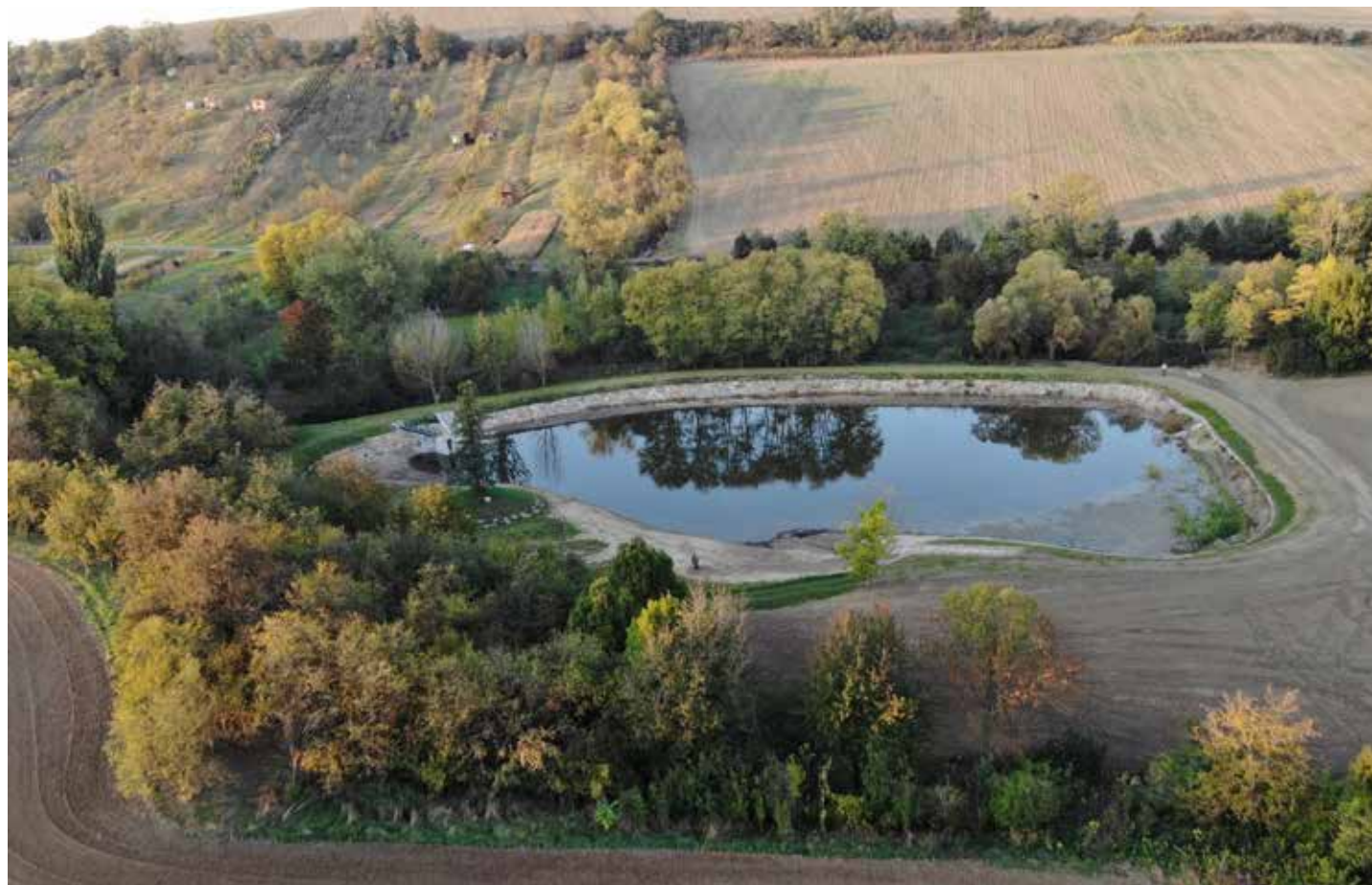
Rybník Drahy by se měl napouštět tři až čtyři týdny. Fotka je z 9.10.