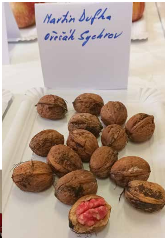
Růžový ořech – nejvzácnější exponát, který věnoval Martin Dufka.