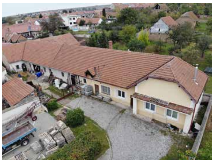
Současný stav objektu „Býkárny“.

Jedná se o projekt s názvem Polyfunkční dům Býkárny. Nyní máme zpracovanou studii, kterou zpracoval Ing. Arch. Petr Koláček. Jak již název projektu napovídá, nový polyfunkční dům je navrhovaný v místě starého objektu Býkárny, který navazuje na Obecní dům v Ostrožské Lhotě. Nyní zde má obec technické zázemí pro pracovníky a pro stroje. Abychom mohli polyfunkční dům vybudovat na místě Býkáren, bude potřeba přestěhovat nebo vybudovat nové zázemí pro pracovníky a technické zázemí obce. Nabízí