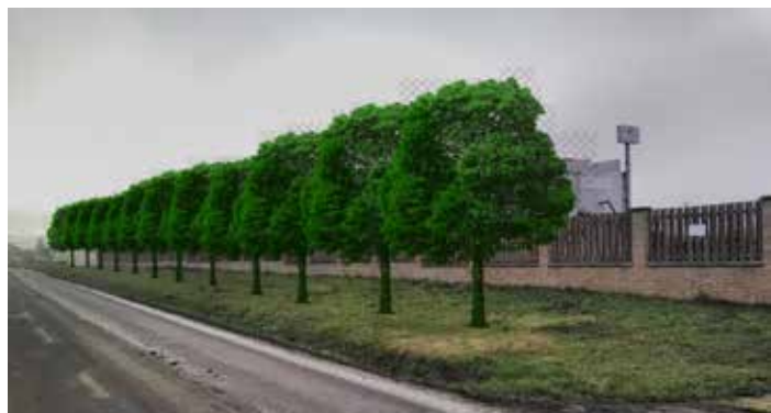
Návrh výsadby stromů u průmyslové zóny

V průmyslové zóně jsou v tuto chvíli navrženy lípy. Na ostatních místech v obci jsou v tuto chvíli navrženy kaštanovníky. Pozor, nejedná se o jírovec – koňský kaštan! Navržený kaštanovník roste pomalu, dobře snáší řez a tvarování a nerozpíná se příliš do prostoru, ale tvoří kompaktní koruny s krátkými tlustými větvemi, často i v nižších výškách, takže dokáže dobře izolovat od prachu z komunikací.