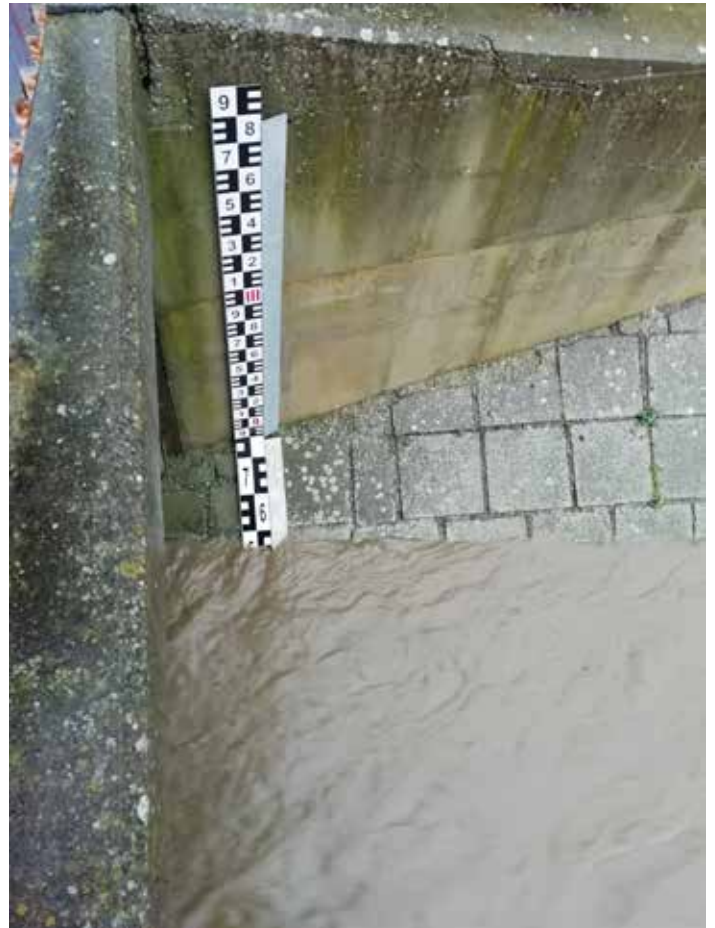
Hladinoměr u Jednoty.

Tímto všem klukům z jednotky děkuji za skvělou spolupráci.