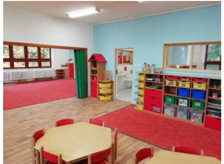
Třída nachystaná pro děti

umývárny a WC jak pro děti, tak i pro paní učitelky (samozřejmě odděleně). Na podestách schodiště, na chodbách v umývárkách, na WC a kuchyňkách jsou nové povrchy podlah. V místnostech MŠ je nová malba. Dále jsou zde nová úsporná svítidla, a hlavně nové rozvody vody a kanalizace a částečně elektriky.