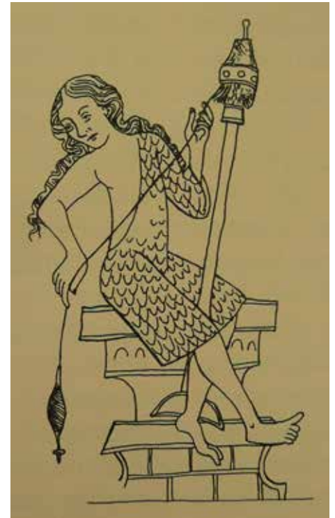
Přádky z Velislavovy bible (1. pol. 14. stol.)

Ke spřádání rostlinných vláken jsou potřebné těžší přesleny, zatímco ke spřádání vlny se hodí přesleny lehčí. Ženy proto zřejmě vlastnily několik tvarově, velikostně a váhově odlišných přeslenů pro tvorbu různých druhů příze. Tomuto závěru nasvědčují i poměrně časté nálezy a tvarová variabilita těchto artefaktů. Z časového hlediska se