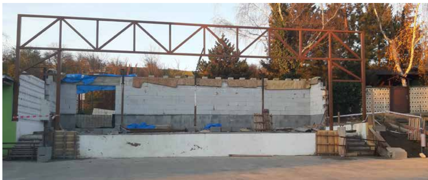
Nové pódium na našem hřišti by mělo být hotovo do hodů 2021.

„Ještě vznikne odkládací prostor vzadu, za pódium. Celé