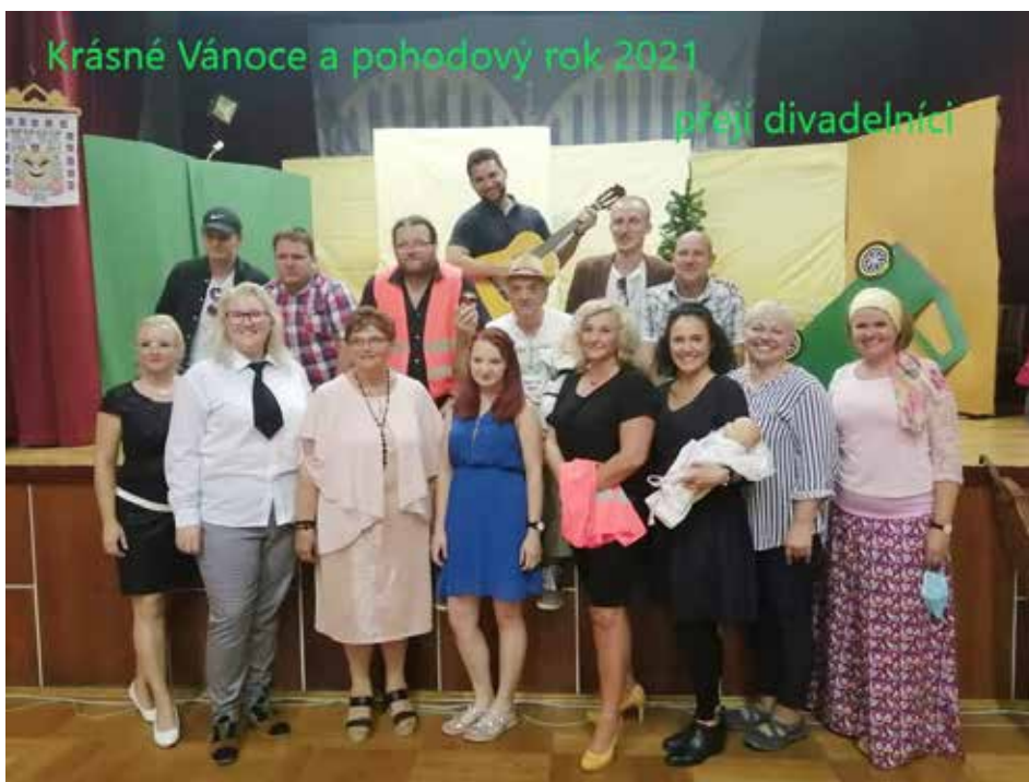
Herci Ostrožsko – Lhotského divadla.