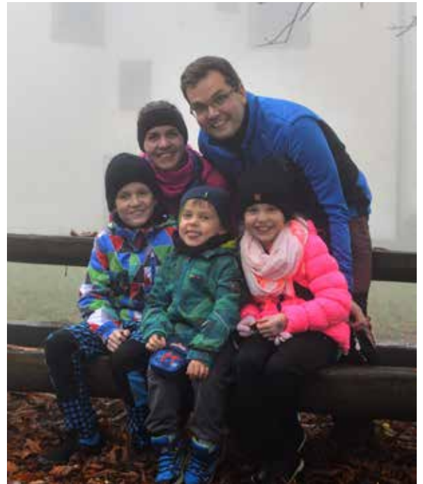
Rodinná fotka u kaple svaté Barbory na kopci Modla v Chříbech. Adéla (31), manžel Mirek (35), Lukášek (10), Matoušek (4) a Verunka (9).

Mé děti (3. a 5. třída) si musely své online hodiny i domácí úkoly hlídat