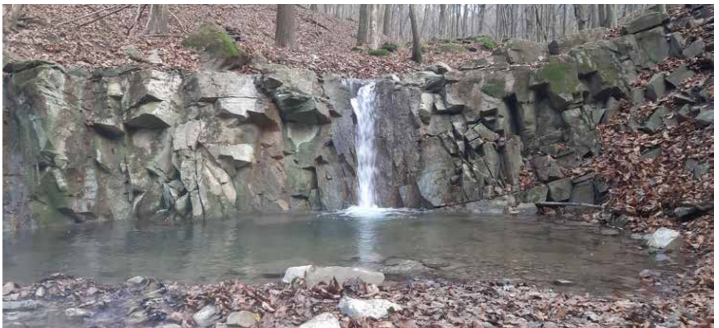
Havraní vodopád najdete pár stovek metrů od kaple.