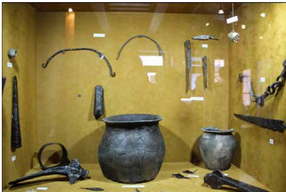
V katastru Ostrožské Lhoty je kvalitní černozem a nejstarší osídlení lokality těmi nejstaršími zemědělci je patrné podle nálezů keramiky.

V uherskohradištské ulici Dlouhá našli archeologové Slovákého muzea vzácné nálezy. Raritou byl kompletně zachovalý zlatý náramek.