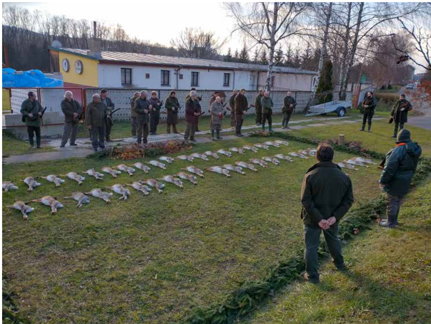
Fotka je z honu, který se konal v sobotu 5. 12.