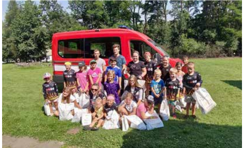
Mladí hasiči naší Lhoty po úspěšném závodě.

razilo první sobotu v říjnu autokarem směr Hostýnské vrchy – přesně do obce Chvalčov. Odtud se šlo po žluté a následně po zelené značce až na rozhlednu, která je v provozu od listopadu 2015.