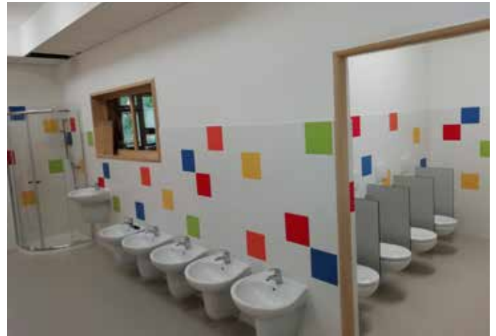
Zrekonstruované sociální zařízení