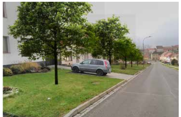
Návrh výsadby stromů ul. Dědina

Rád bych vás nyní seznámil s projektem s názvem Ozeleňení intravilánu obce Ostrožská Lhota. Jedná se stručně řečeno o výsadbu stromů v obci. Na výsadbu stromů bychom chtěli zažádat o dotaci Státní fond životního prostředí ČR, kde je potřeba splnit různé podmínky. Jednou z nich je mít zpracovaný odborný posudek. Pro nás zpracovává projekt biolog, ekolog, krajinář a environmentalista Jakub Hrubý. Řeší v něm vhodný druh stromů, ale hlavně vhodné umístění stromů vůči danému prostředí a inženýrským sítím. Pro splnění těchto podmínek moc prostoru nemáme, ale i přesto se již podařilo něco vymyslet. Stromy v intravilánu (v obci) mají velký vliv na zmírnění prašnosti i hlučnosti v obci. Držme se hesla pana Jakuba Hrubého: Každý stromek, každé