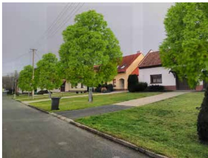
Návrh výsadby stromů ul. Pastuška

V průmyslové zóně jsou v tuto chvíli navrženy lípy. Na ostatních místech v obci jsou v tuto chvíli navrženy kaštanovníky. Pozor, nejedná se o jírovec – koňský kaštan! Navržený kaštanovník roste pomalu, dobře snáší řez a tvarování a nerozpíná se příliš do prostoru, ale tvoří kompaktní koruny s krátkými tlustými větvemi, často i v nižších výškách, takže dokáže dobře izolovat od prachu z komunikací.