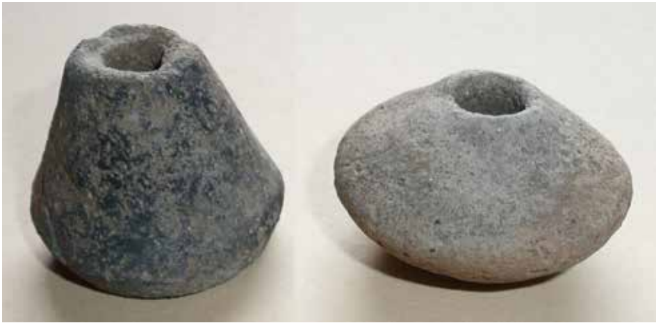
Přesleny různých tvarů a velikostí