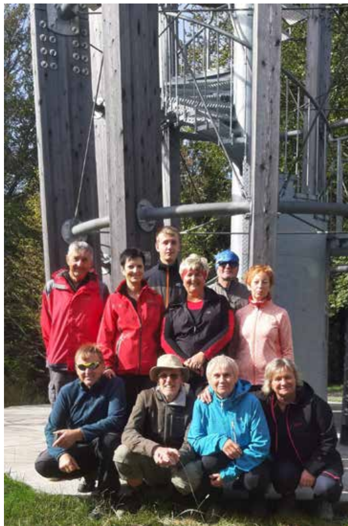
Turisté a příznivci lhotské turistiky na vrcholu Kelčského Javorníku (865 m. n. m).

legrace a třeba se někde váš kamínek časem objeví. Nezapomeňte na něj z druhé strany napsat FB #Kamínky a PSČ vašeho bydliště. Kamínky namalujte akrylovými barvami nebo akrylovými fixami, aby obrázek nesmyl deštěm.