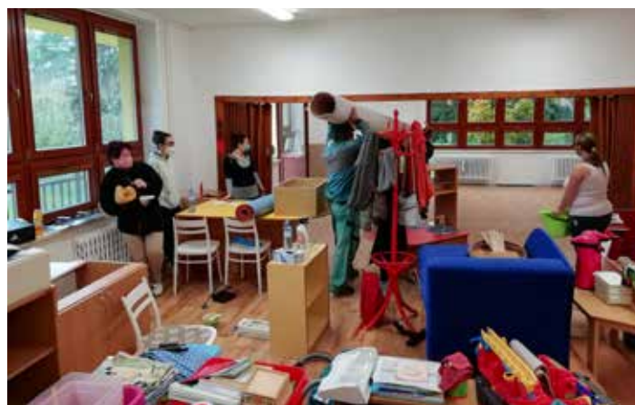
Stěhování zpět v MŠ

Po tuto dobu byl provoz MŠ přestěhován do sportovní haly. S tímto náhradním prostředím si paní učitelky i děti poradily. Koncem října byly stavební práce v MŠ dokončeny a v posledním týdnu v říjnu proběhl úklid a stěhování nábytku hraček za pomoci paní učitelek a pracovníků obce. Pomocť přišla i jedna maminka. Začátkem listopadu byly děti zpět ve svých třídách. V MŠ v obou podlažích jsou nové