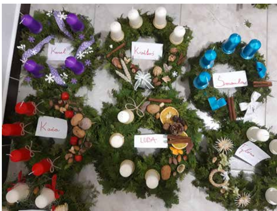
Krásné adventní věnce, které holky vtipně pojmenovaly.

Naše farnost vlastně patří taky mezi ty, jejich činnost byla citelně omezena a teprve se jako řada organizací probouzí z nuceného mrazivého spánku. Vládní omezení prakticky nedovolovala, abychom se jako farnost scházeli k bohoslužbám ani jinak. Mše svaté jsme prožívali nejčastěji doma u televizních přijímačů nebo přes internet. Uskutečnit plánované sbírky pokrývající splátky dluhu zůstávajícího po opravě našeho kostela bylo prakticky nemožné. Proto naši