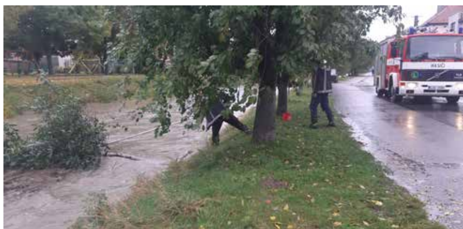
Takto rozvodnily třídenní vytrvalé deště potok Okluky.

Vážení občané, v této požehnané vánoční době Vám přejeme klid, chvílku na odpočinek, zamyšlení a mír v duších Vás všech. Pevnou víru a pokoru v čase současných zkoušek. V novém roce 2021 pak především zdraví, vzájemnou ohleduplnost a úctu jednoho k druhému.