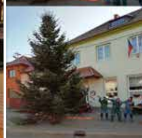
Pozvánka na předposlední straně Alka Skřenková.