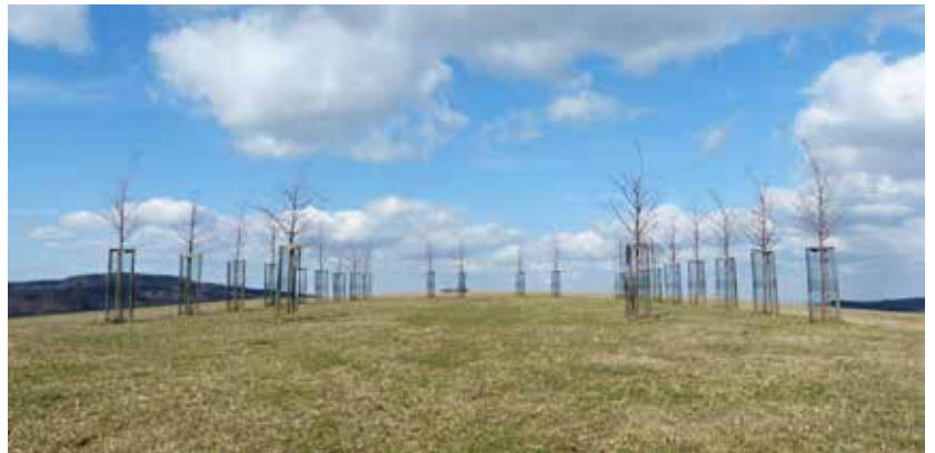
Kaple vnitřního ticha je stromová kaple u obce Nová Lhota