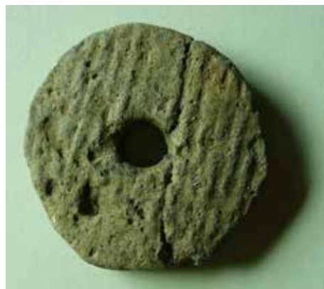
Přeslen zhotovený ze zlomku keramické nádoby.

Abyste přádky získala ze shluku vláken příze, postupovala při tom následovně: zatímco jednou rukou vytahovala z přediva vlákna a mnutím mezi prsty je zkrucovala, druhou rukou navíjela soukanou nit na roztáčené vřeteno. Byla jí dřevěná hůlka zatížená přibližně ve spodní čtvrtině své délky přeslenem. Ten udržoval vřeteno ve svislé poloze a v otáčivém pohybu. Jde