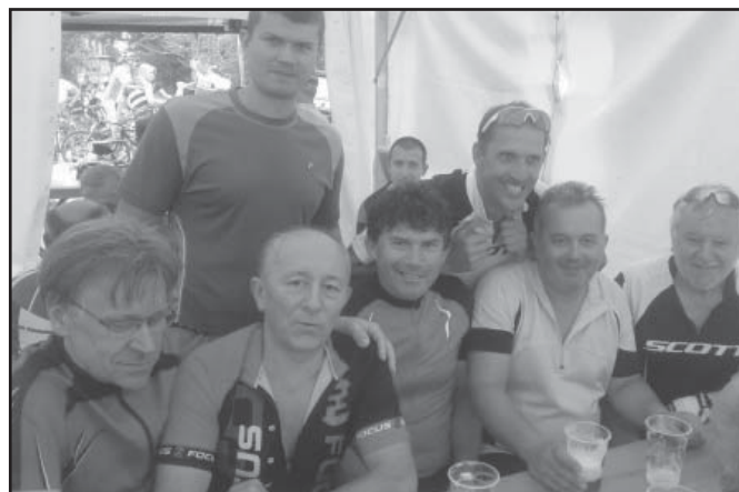
Poslední červencovou neděli se vypravili Lhoťané na vrchol Bílých Karpat.