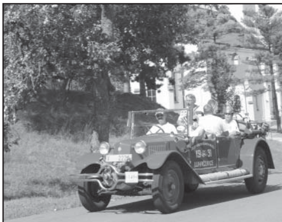
Hasiči z Luhačovic přijeli v historickém, ale plně funkčním voze.

Celkem bylo na startovní listině 61 aut, 38 motocyklů a 3 užitkové vozy. Naše Lhota byla na trase první etapy, která startovala v Uherském Hradišti a přes zastávku na Svatém Antonínku končila v Kyjově. Podle pořadatelů neodstartoval jenom jeden vůz, kterému se ještě před startem utrhla řadicí páka.