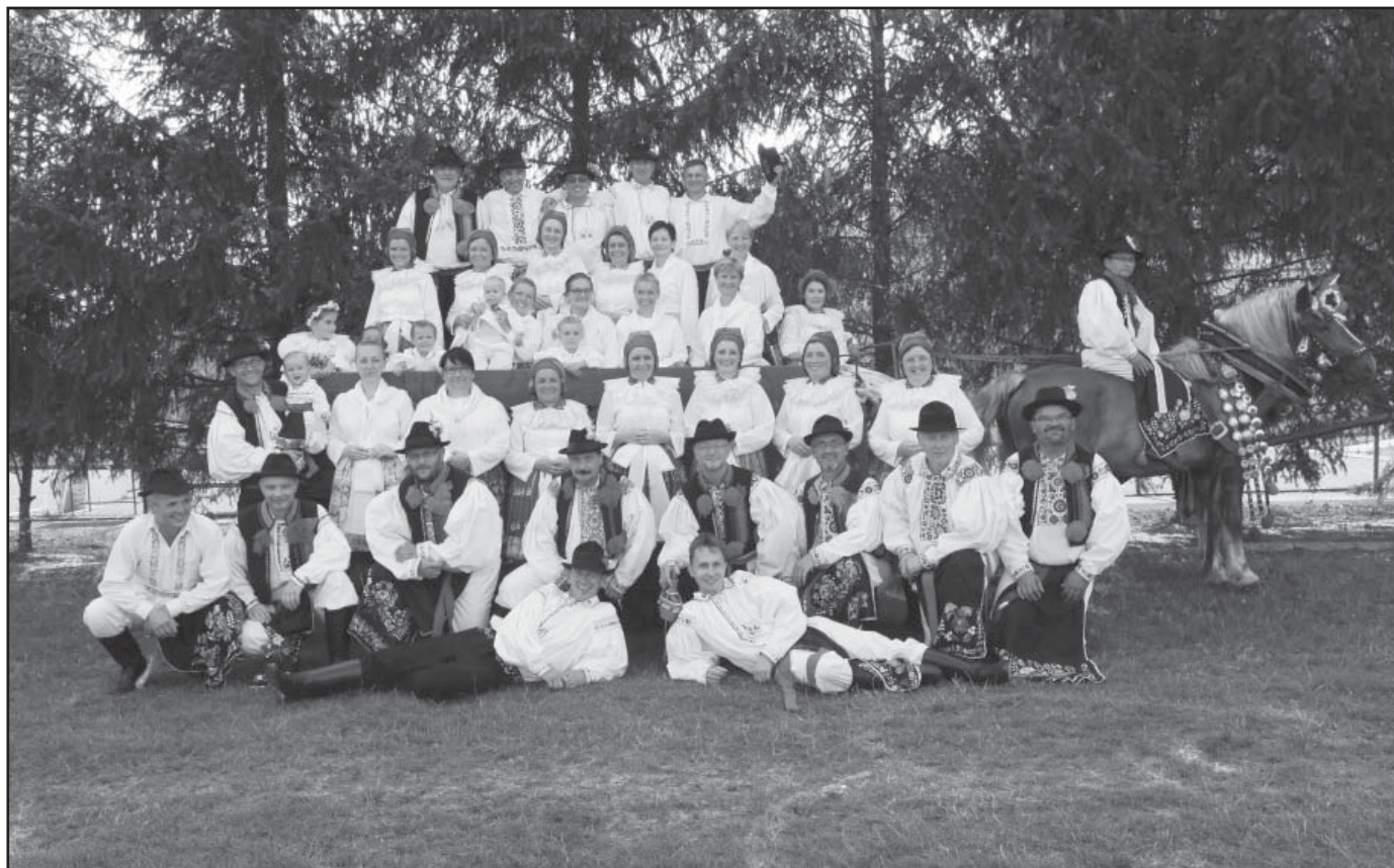
Ženáčské hody nacvičovalo 16 párů ve věkovém rozmezí 25 až 58 let.