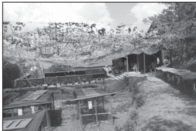
Areál zahrádkářů je nad novým pečovatelským domem.