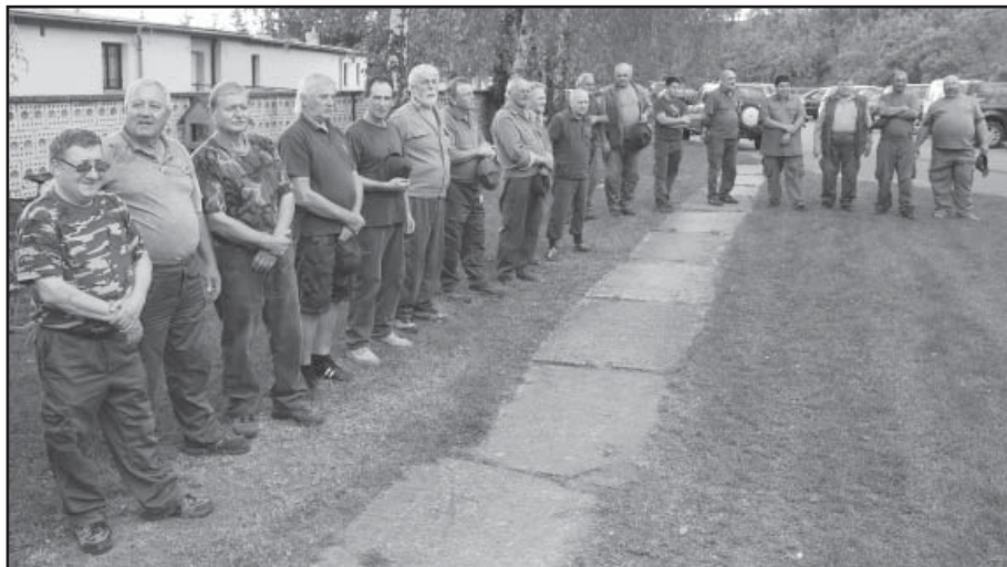
Zkoušky organizačně zajišťovalo Myslivecké sdružení Ostrožská Lhota.

Na zkoušky se přihlásilo patnáct psů. Všichni byli připraveni složit zkoušku lovecké upotřebitelnosti, která je potřebná pro praktický lov