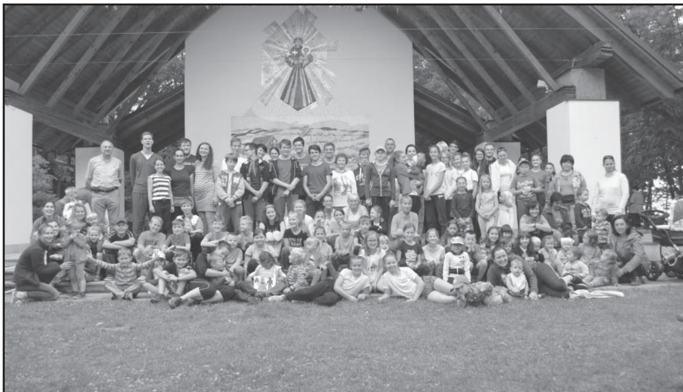
Hromadná fotka většiny účastníků Antonínkova léta.