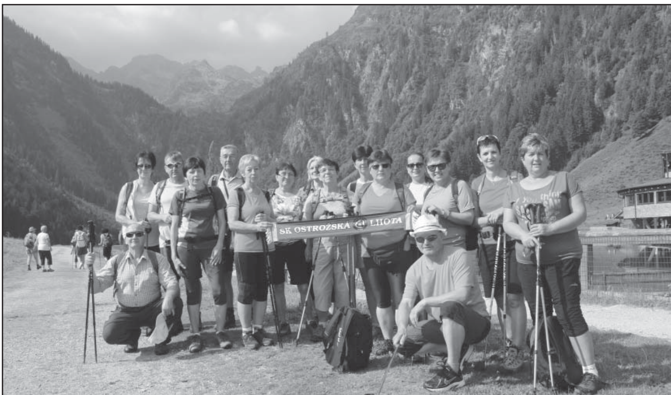
Skupina lhotských turistů těsně před putováním po třech rakouských jezerech.