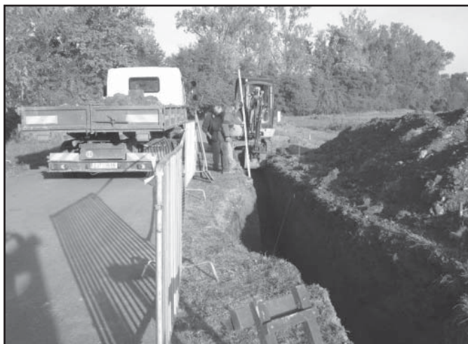
Výkopové práce pro vodovod- Kříbské zahrady

Na Lubech se začíná pracovat na potřebné komunikaci a následně na inženýrských sítích v délce asi 120 m. Tato první etapa pro dva rozestavěné RD bude ukončena do 30. 11. 2018.