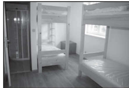
Takto vypadá čtyřlůžkový pokoj, ke kterému patří sociálky a kuchyňka.

Za noc v nové ubytovně zaplatíte dvě stovky, pokud tedy spíte na pokoji sám. Pokud je vás víc, tak je ubytování levnější. Při plném obsazení stojí například čtyřlůžkový pokoj na jednu noc pět stovek.