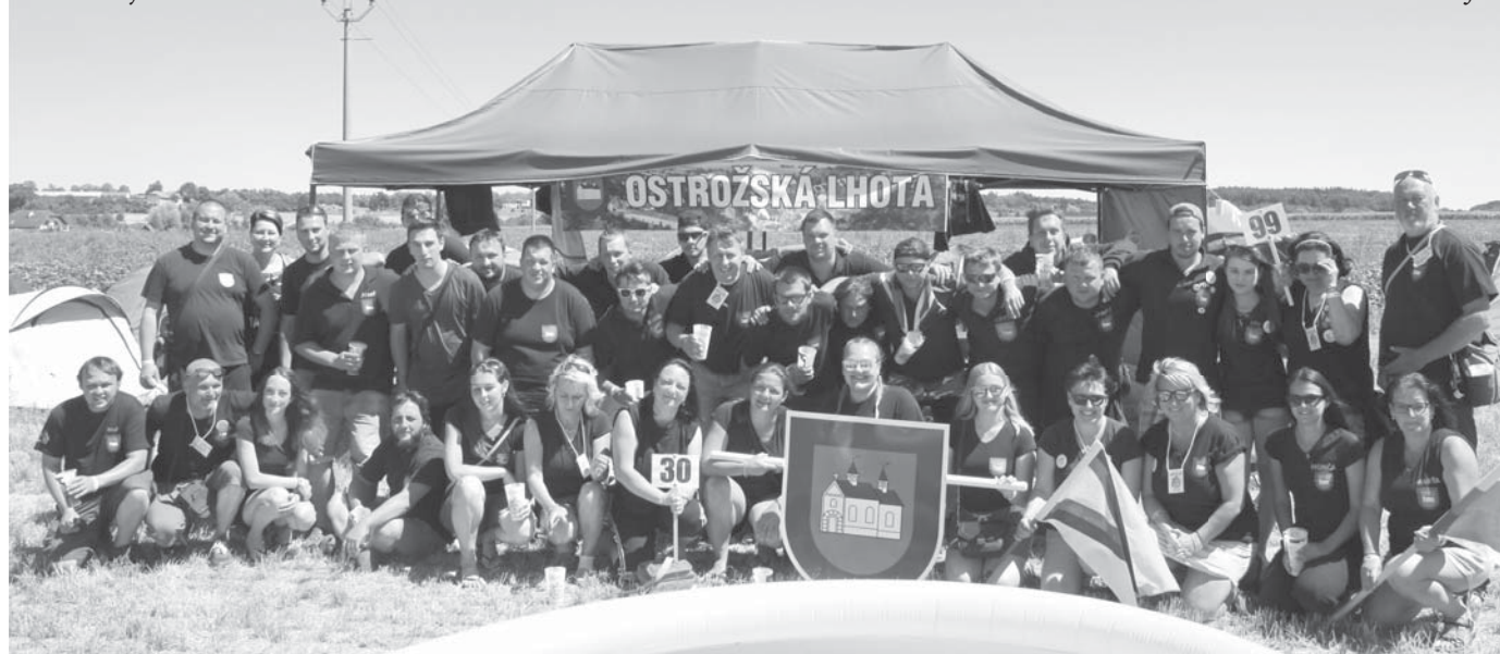
Výprava naší Lhoty na 38. srazu Lhot a Lehot.