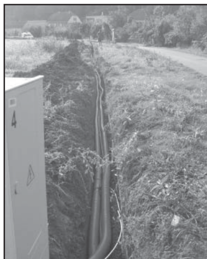
Rozvody NN, VO a KT v Kříbských zahradách

V Kříbských zahradách se jedná o sítě v délce asi 260 m (kanalizace a komunikace zde jsou). Je dokončen rozvod NN, veřejného osvětlení a kabelové televize. Dokončuje se rozvod vody a do konce září bude dokončen i rozvod plynu. V lokalitě začala i výstavba prvního soukromého domu.