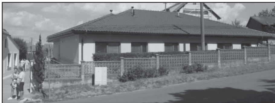
Dílo, které má hodnotu přes devět miliónů korun, se začalo stavět v září loňského roku.