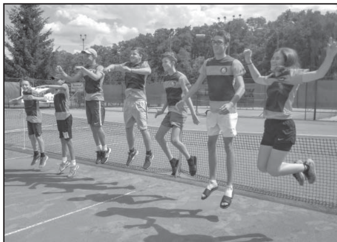
Mladí tenisté Ostrožské Lhoty do našeho zpravodaje netradičně zapózovali.