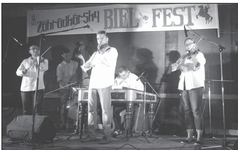
Lhotská cimbálovka Višňa na festivalu BielFest ve Velkom Bielu, okres Senec.