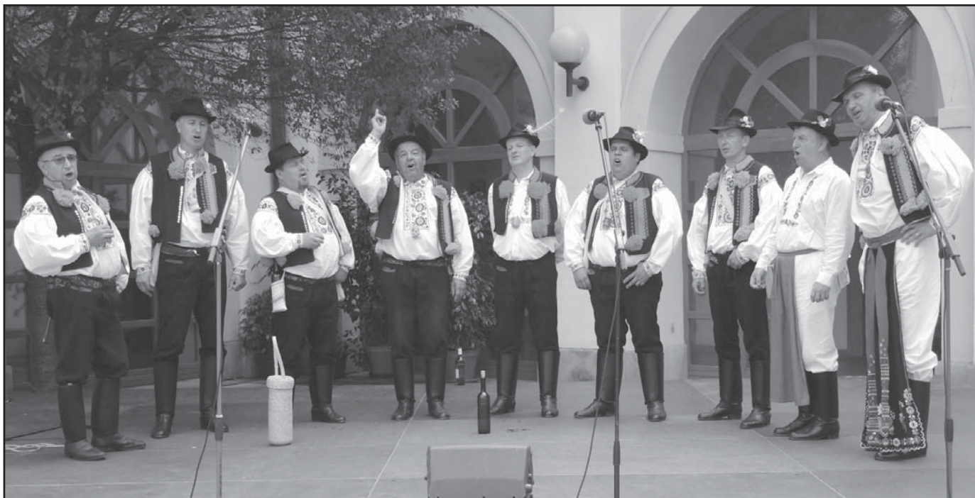
Mužský pěvecký sbor na letošních Slavnostech vína v Uherském Hradišti.