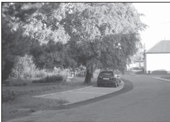
Parkoviště v Hájku

Celá akce je dokončena. Chodník v ulici Lánová umožňuje bezpečnou chůzi občanů na autobusovou zastávku a do prodejny. Nové parkoviště mezi hřbitovem a kostelem bylo v průběhu prací rozšířeno na 7 parkovacích míst. Nové je i parkoviště v ulici Hájek (pod vyústěním ulice Školní) na hranici parku.