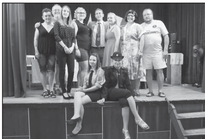
Ostrožsko - Lhotské divadlo při své premiéře hry Zase ti tupitelé. Hrál se ve Lhotě.