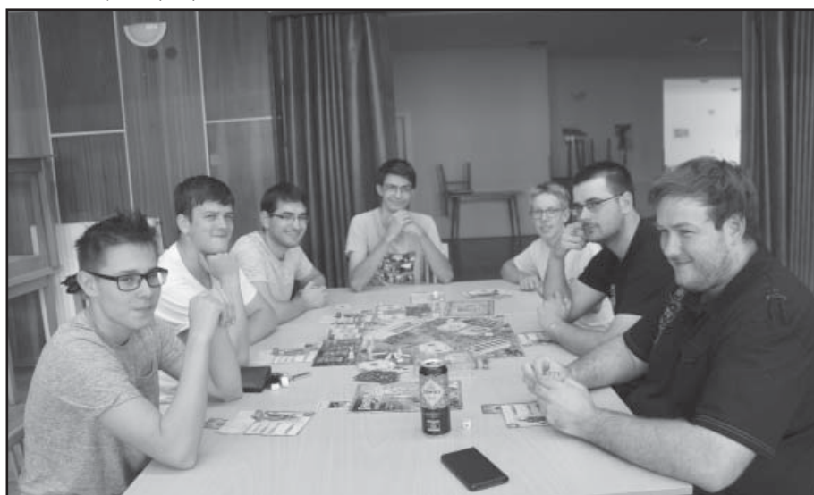
Většina účastníků Lhotského deskohraní, které se konalo první sobotu v září.