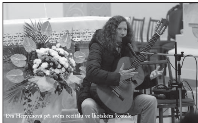
Eva Henychová při svém recitálu ve lhotském kostele