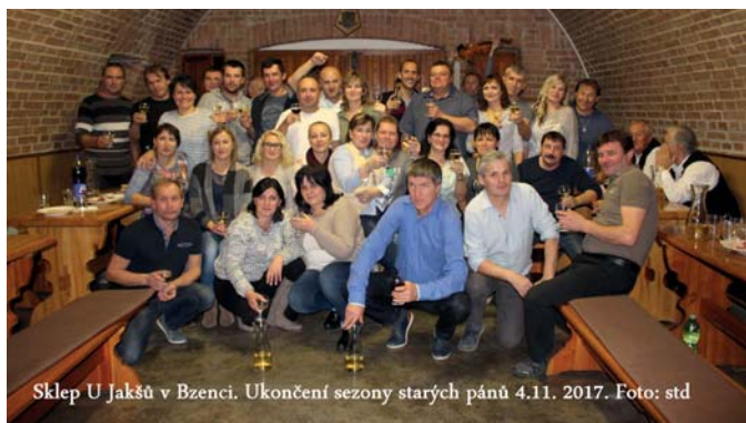
Sklep U Jakšů v Bzenci. Ukončení sezony starých pánů 4.11. 2017.