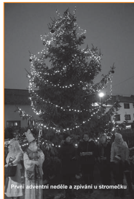
První adventní neděle a zpívání u stromečku