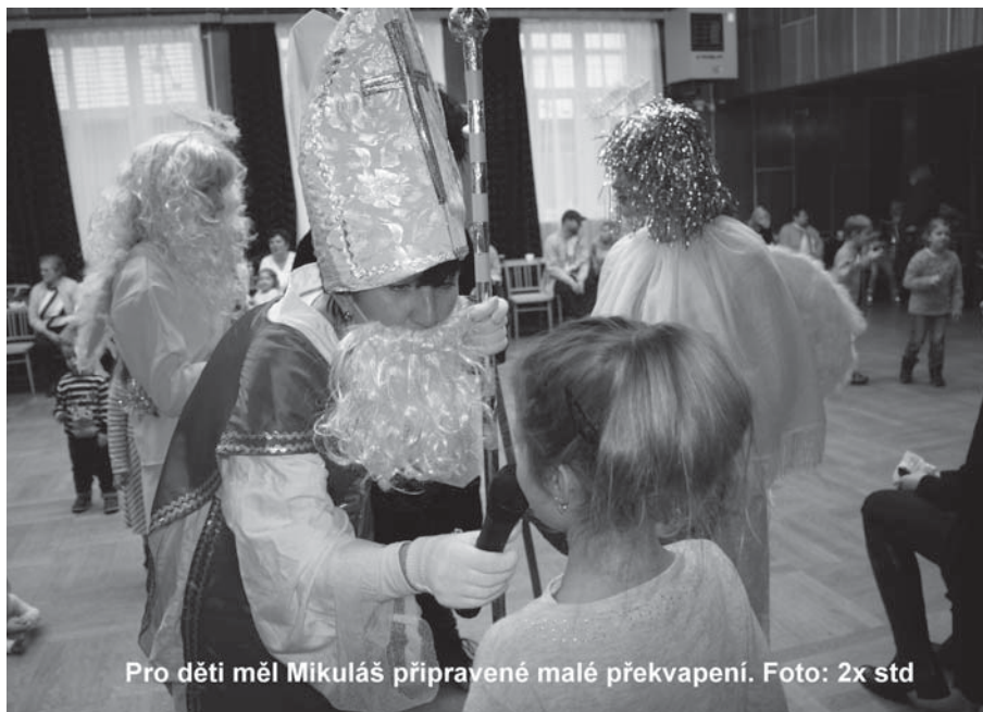
Pro děti měl Mikuláš připravené malé překvapení.