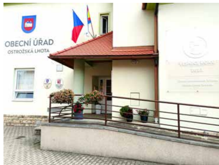
Květinová výzdoba u OÚ

Pro vážení suti byla na sběrný dvůr pořízena nadzemní automobilová váha o rozměrech 2,5 x 6 m do 10 t s ES ověřením – cejchováním a s tiskárnou. Váhu