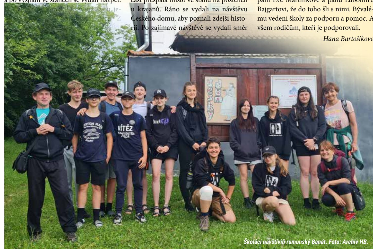
Školáci navštívili rumunský Banát.