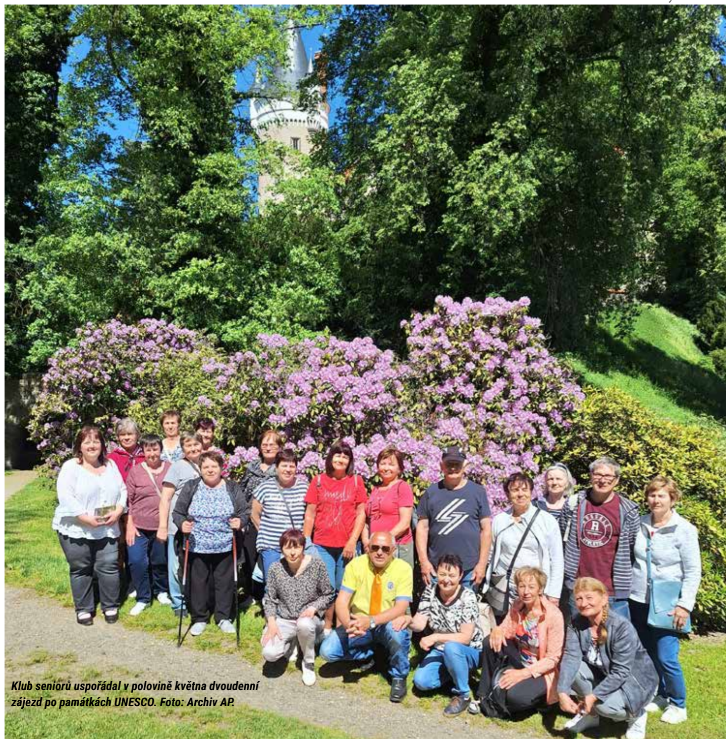
Klub seniorů uspořádal v polovině května dvoudenní zájezd po památkách UNESCO.