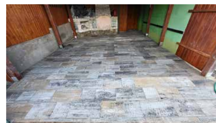
Nová podlaha u tenistů

Na stavební objekt Chodníky máme podanou žádost o dotaci na SFDI (Státní fond dopravní infrastruktury).