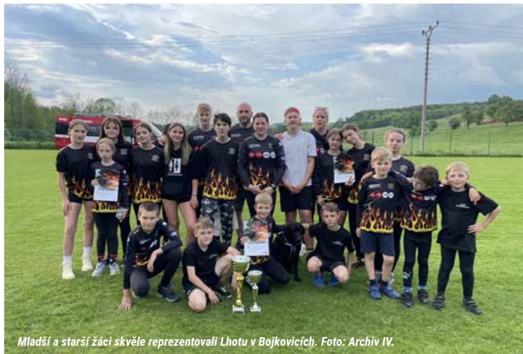
Mladší a starší žáci skvěle reprezentovali Lhotu v Bojkovicích.