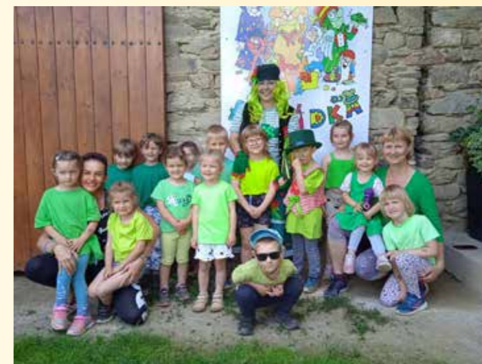
Škola v přírodě