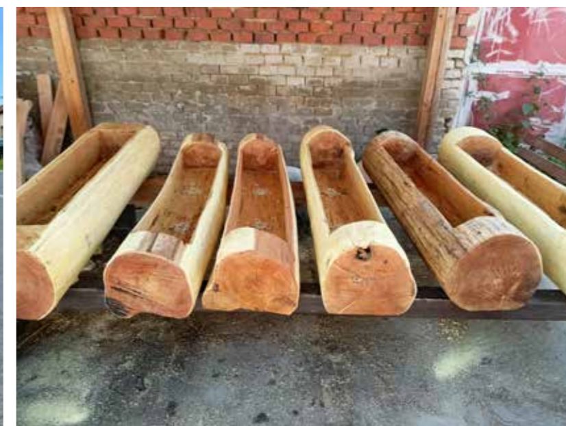
Květináče z akátu.

O výsadbu a údržbu zeleně v obci se starají zaměstnanci obce, hlavní zahradnice Vierka Zalubilová a občané, kteří udržují veřejný prostor před svým rodinným domem, za což jsme rádi a děkujeme.