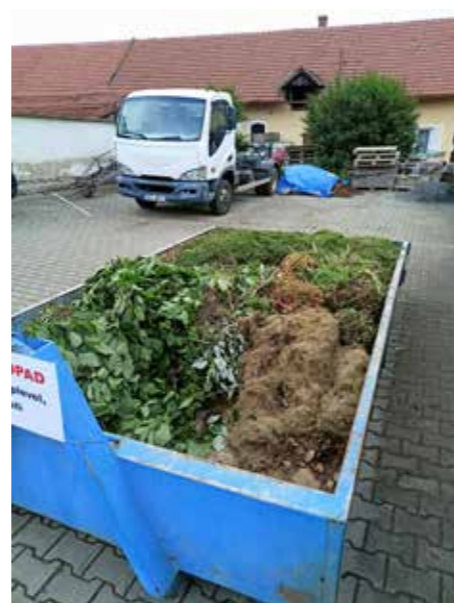
Kontejner na bioodpad u Býkáren

dodala firma Váhy Kulhánek na základě výběrového řízení za 286 104 Kč s DPH (náklady za likvidaci suti stály obec 220 tis. Kč/rok). V poplatku za likvidaci komunálního odpadu není zahrnuto uložení stavební suti.