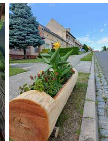
Květináč s akátu v ul. Dědina