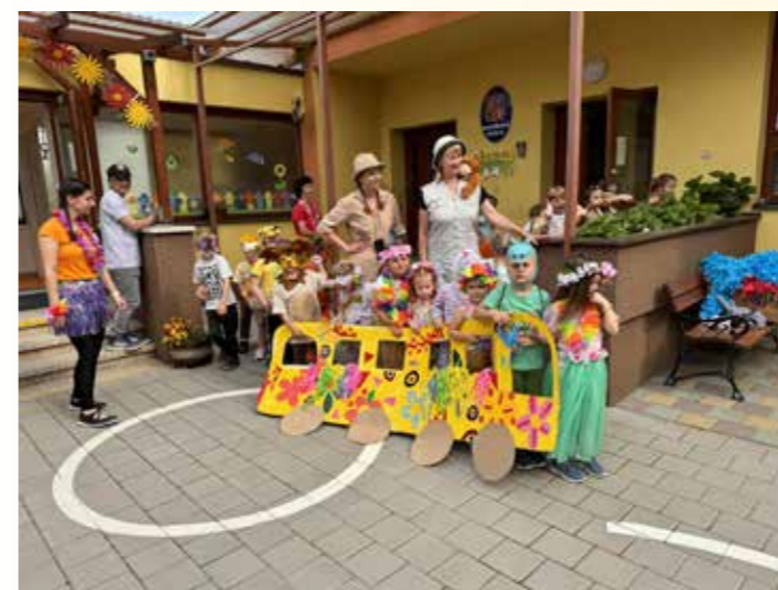
Piknik pro rodinu

Mimo jiné jsme v tomto měsíci uspořádali mini-olympiádu, kde děti zdárně zdolávaly různé sportovní disciplíny, za které byly odměněny medailí a sportovním diplomem. Konec měsíce odzvonilo loutkové divadlo Rolnička, které nám zahrálo pohádku; O krtkovi a dráčkovi.