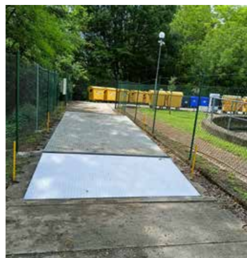
Automobilová váha na sběrném dvoře.

dodala firma Váhy Kulhánek na základě výběrového řízení za 286 104 Kč s DPH (náklady za likvidaci suti stály obec 220 tis. Kč/rok). V poplatku za likvidaci komunálního odpadu není zahrnuto uložení stavební suti.