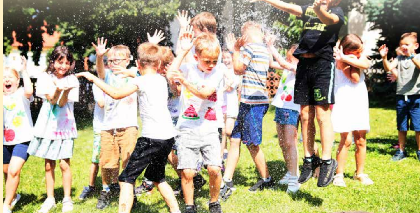
Zahradní slavnost se vydařila na jedničku a byla důkazem, že spolupráce mezi žáky, učiteli a rodiči může přinést skvělé výsledky.