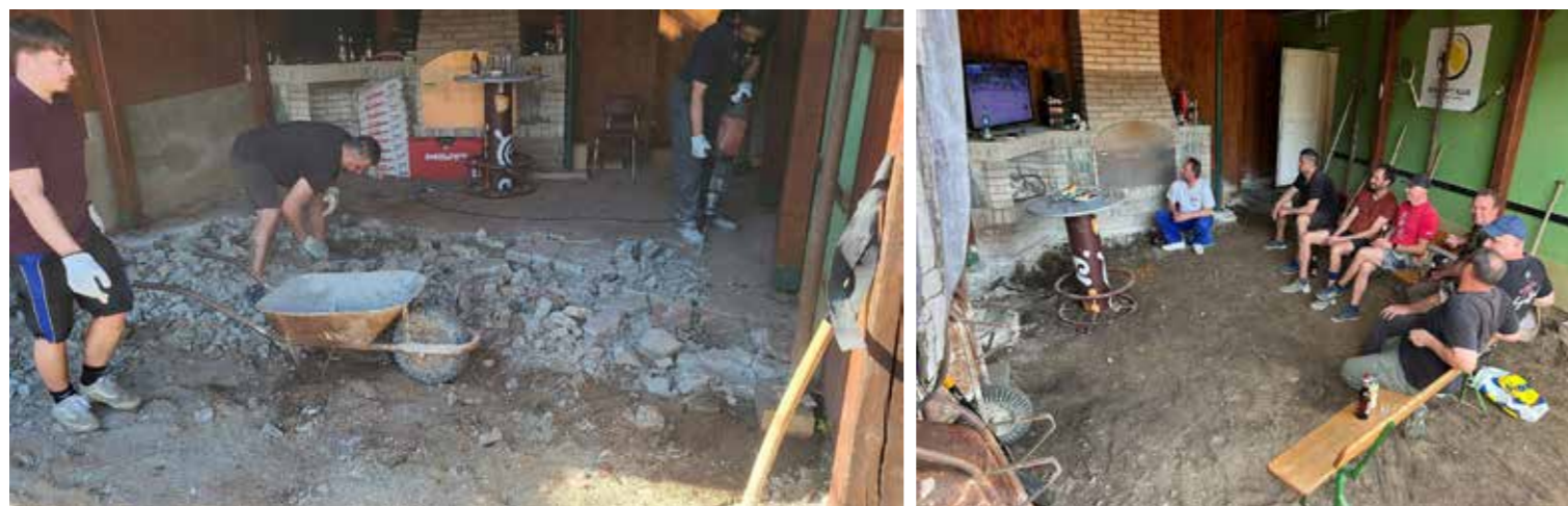
Brigáda tenistů, odstranění staré podlahy a provedení zemních prací