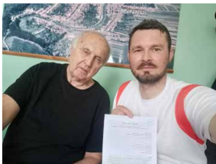
Podpis kupní smlouvy ze strany obce.

Pokud máte také zajímavou myšlenku, jak obec zvelebit a chcete svůj projekt zrealizovat, tak budu rád, když přijedete na obec váš nápad odprezentovat.