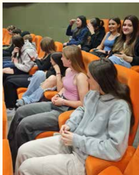
Osmáci a devátáci v kině na filmu Vězení dějin.

a další. Nejrychlejší tým byl z Ostrožské Nové Vsi a stihl doběhnout ve skvělém čase 1:30:14. Se zpožděním čtyř minut je následoval tým ze ZŠ Starý Hrozenkov. V patách jim byl tým ze ZŠ Mariánské náměstí Uherský Brod, ti potřebovali k dokončení závodu ještě minutu navíc. Dle slov učitelů, kteří k nám přijeli z okolních škol, je Memoriál kapitána Bogataje jedinečná akce v krásném prostředí se zajímavými úkoly, která nemá obdoby. Stejně jako my se už všichni těší na příští rok.