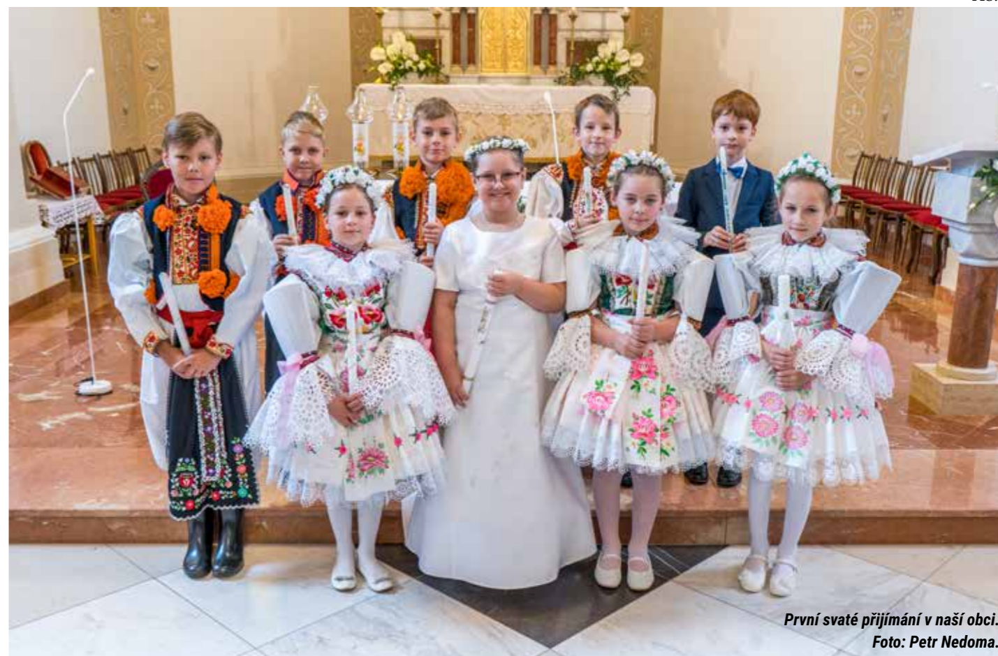
První svaté přijímání v naší obci.