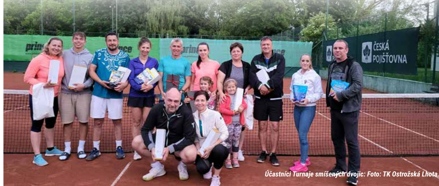
Účastníci Turnaje smíšených dvojic.