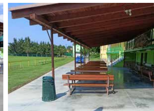
Nová podlaha před hospůdkou