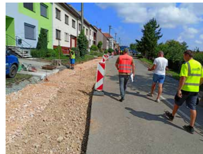
Práce na rekonstrukci chodníku ul. Chřib.