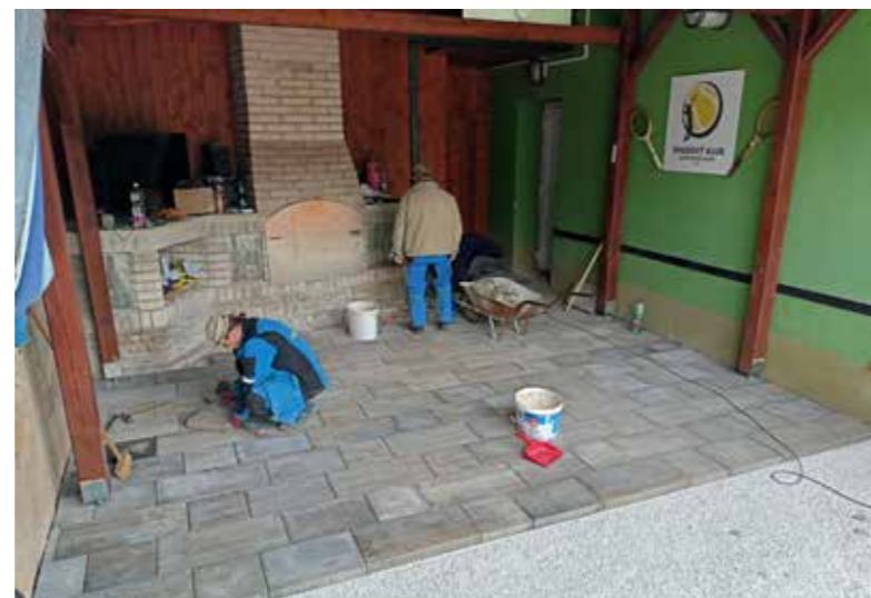
Nová podlaha u tenistů