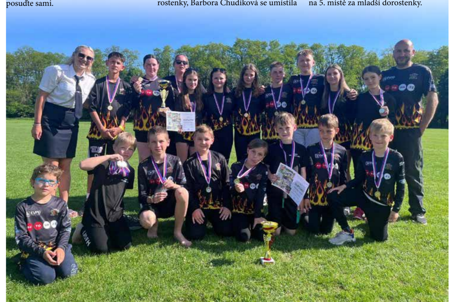
S výsledky starších i mladších žáků byla spokojenost.