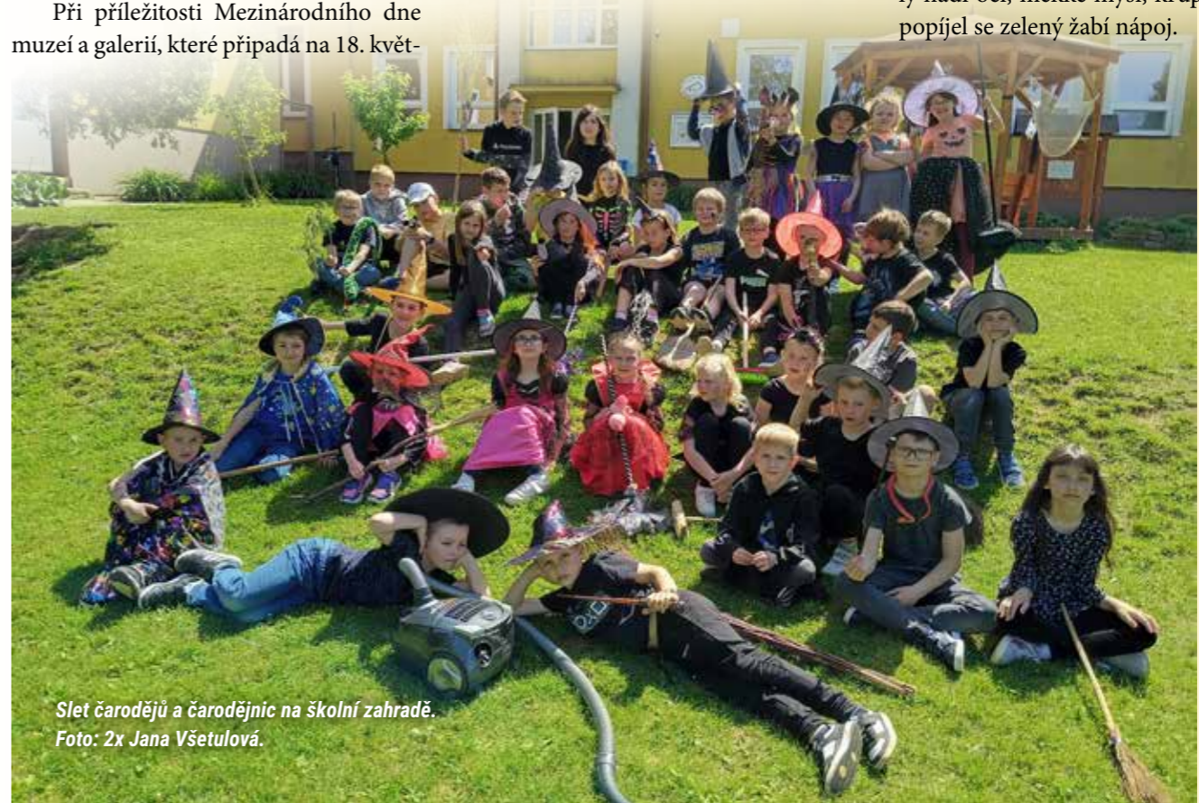
Slet čarodějů a čarodějnic na školní zahradě.