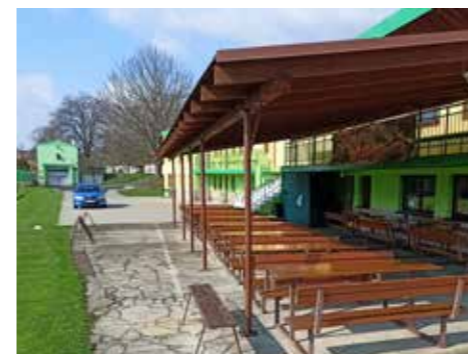
Podlaha před rekonstrukcí