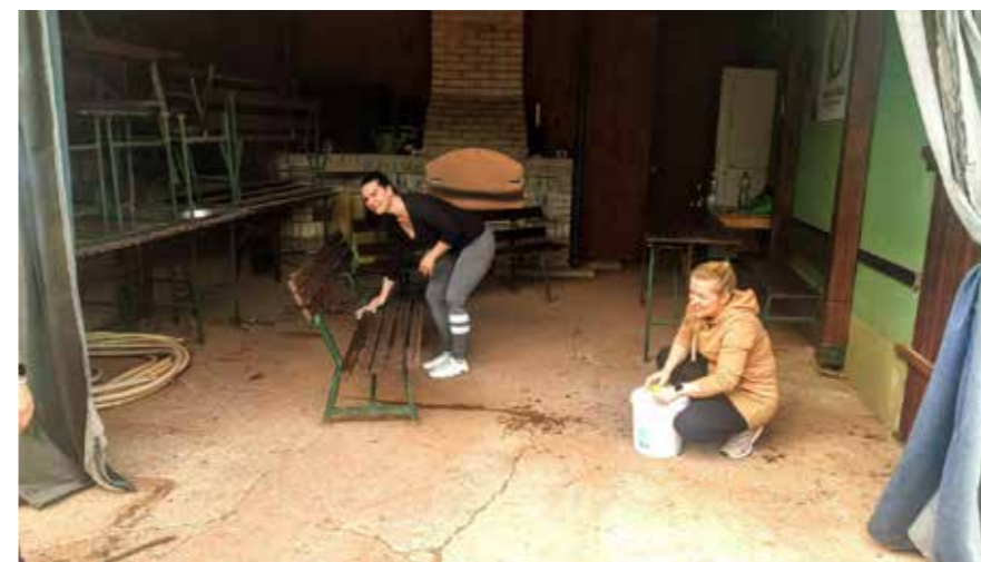
Brigáda tenistek. Podlaha před rekonstrukcí

zaměstnanci obce rozprostřeli podkladní drť a položili zámkovou dlažbu. Materiál financovala obec, dlažba a drť stála 26 tis. Kč s DPH. Spolupráce proběhla na jedničku. Děkuji tenistům, že se vzorně starají o svěřené prostory a obětují svůj volný čas na zvelebení, modernizaci a údržbu těchto prostor.