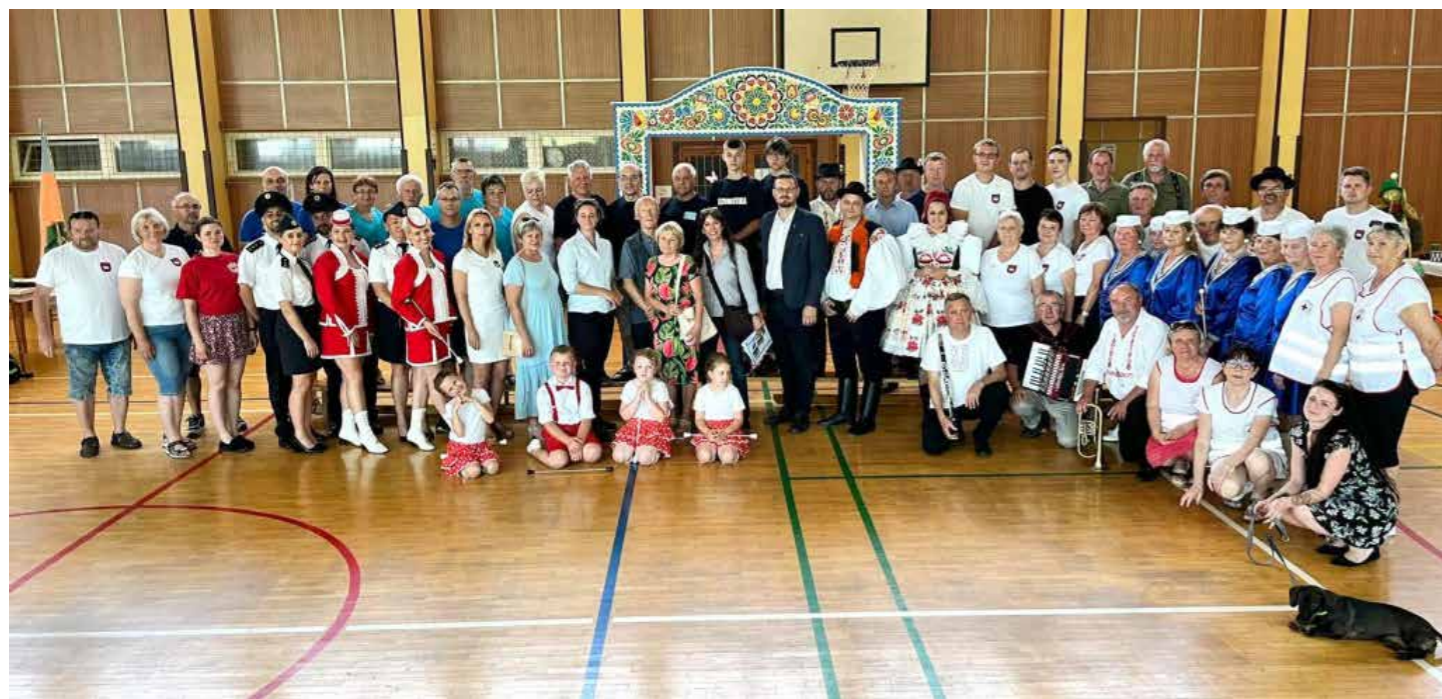
Společné foto při Evropské soutěži.