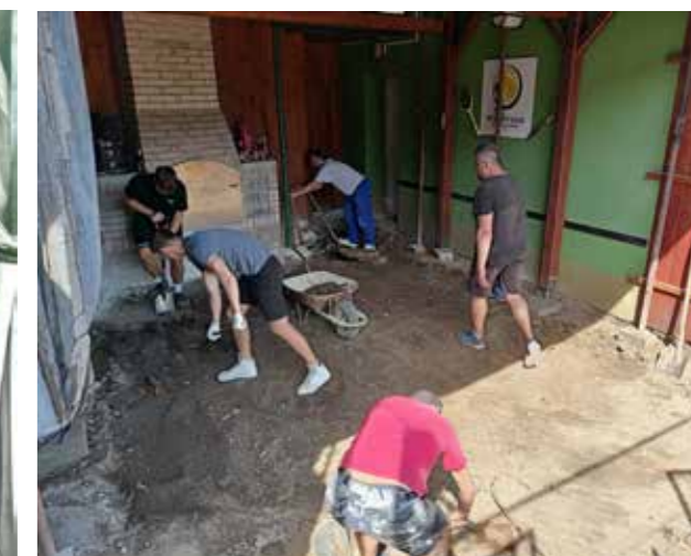
Brigáda tenistů, odstranění staré podlahy a provedení zemních prací