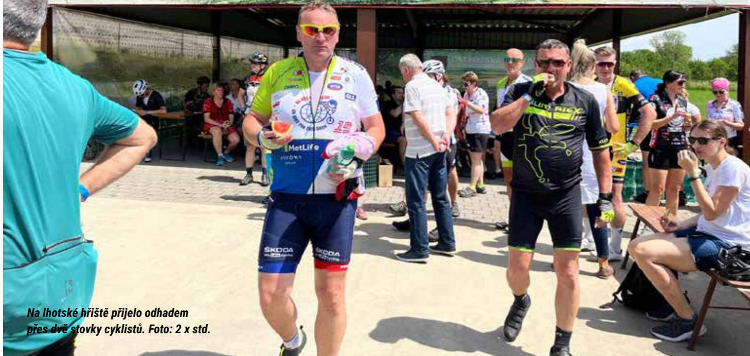
Na lhotské hřiště přijelo odhadem přes dvě stovky cyklistů.