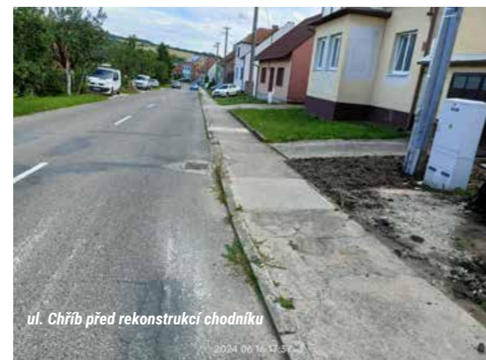
ul. Chřib před rekonstrukcí chodníku