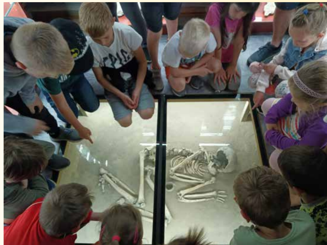
Návštěva lhotského muzea. Dětem se nejvíce líbila kostra ženy.

Při příležitosti Mezinárodního dne muzeí a galerií, které připadá na 18. kvě-