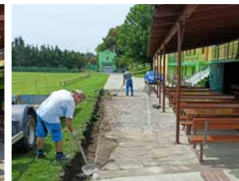
Příprava na osazení obrub