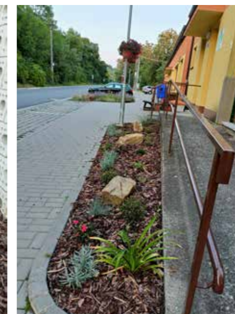
Nový záhon u lékárny