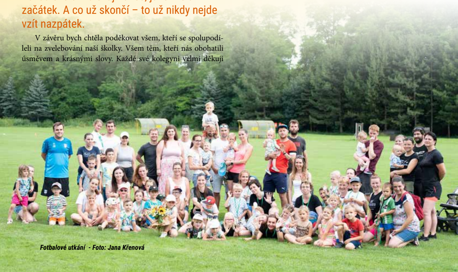
Fotbalové utkání