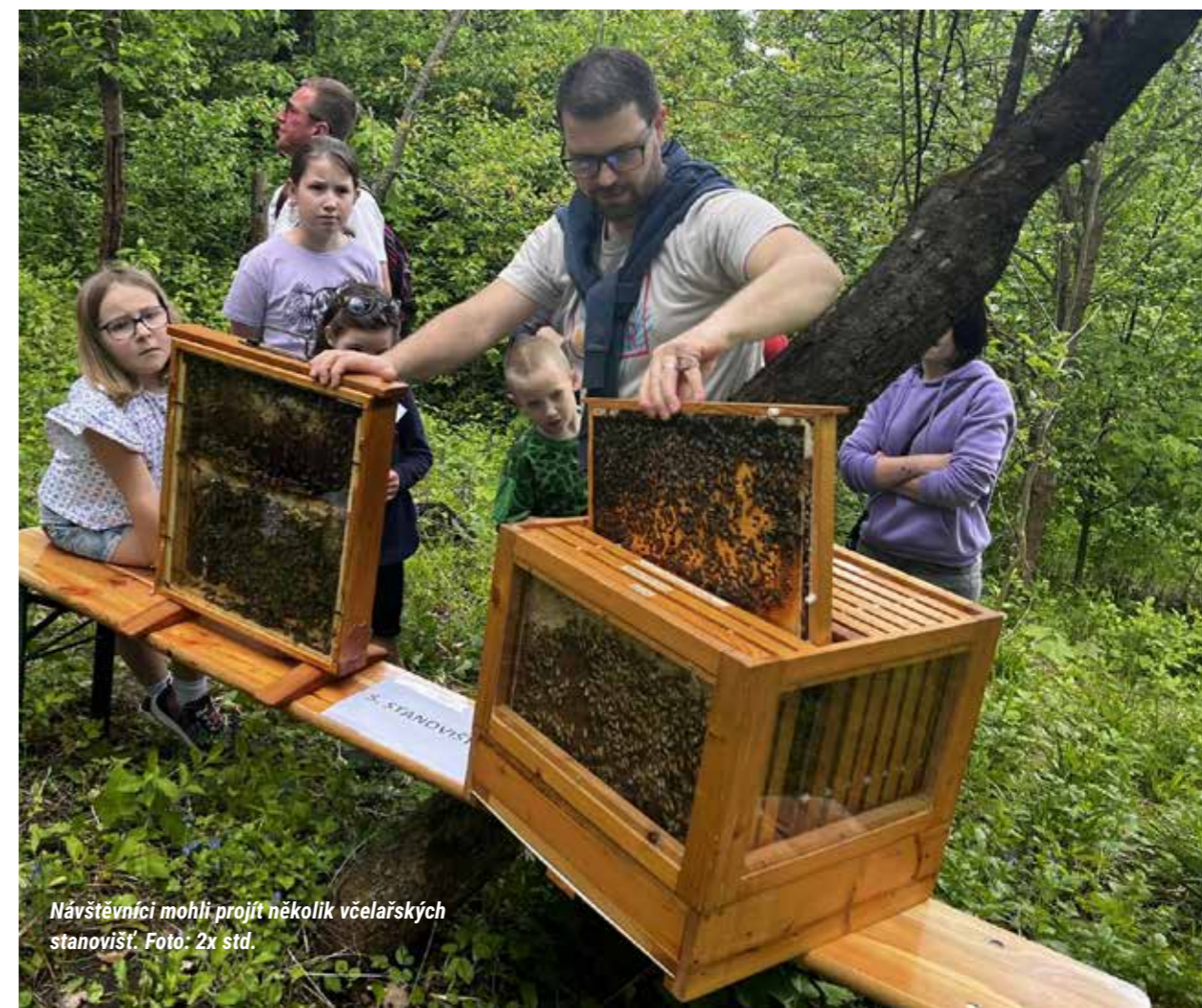
Návštěvníci mohli projít několik včelařských stanovišť.