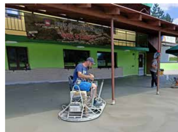
Leštění povrchu betonu