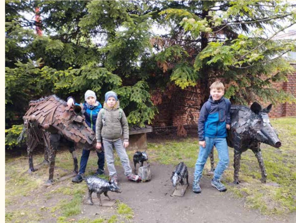
Den Země v KovoZoo ve Starém Městě.