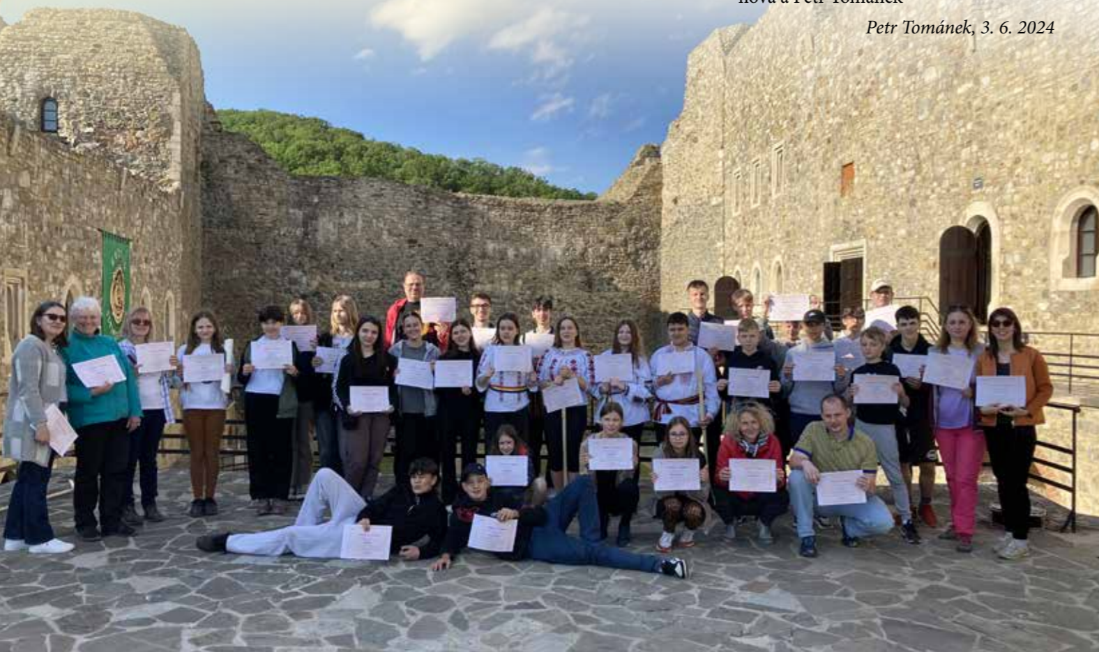
Ceremoniál v Neamț Citadel.