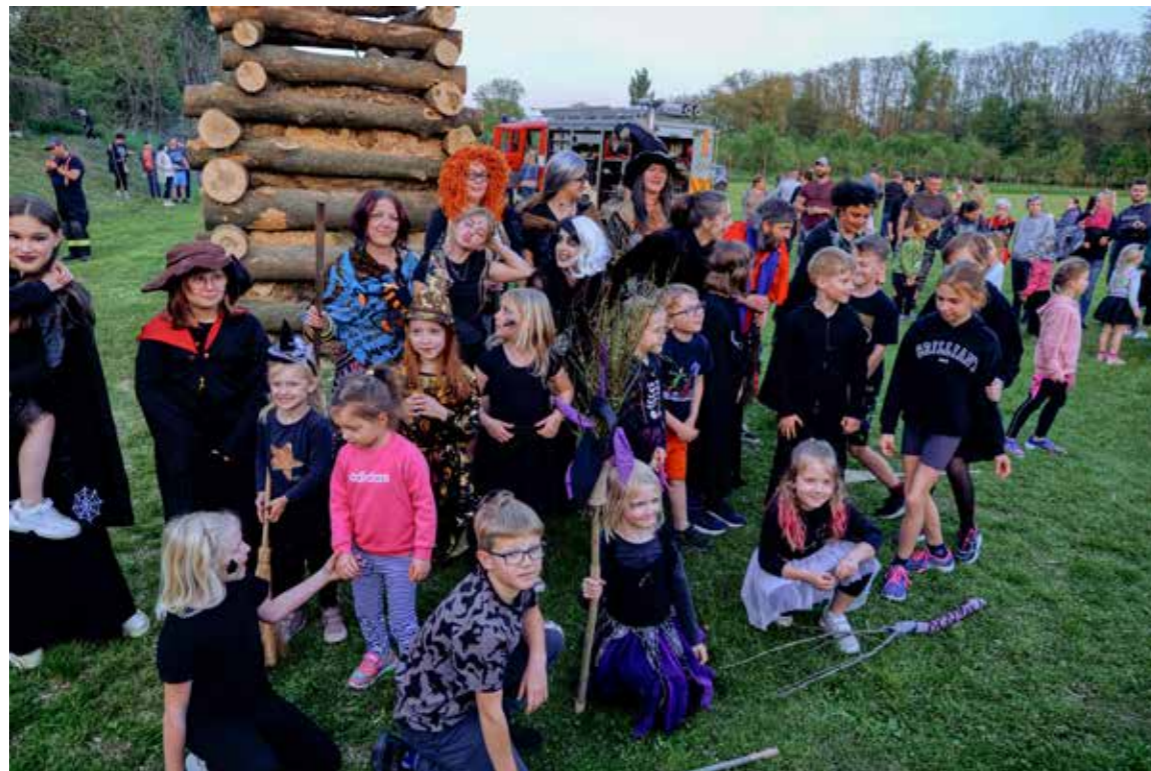
Sbor dobrovolných hasičů z naší obce hostil na hřišti tradiční akci Pálení čarodějnic.

Hlavní atrakcí večera byla vysoká vatra, kterou pod pečlivým dohledem