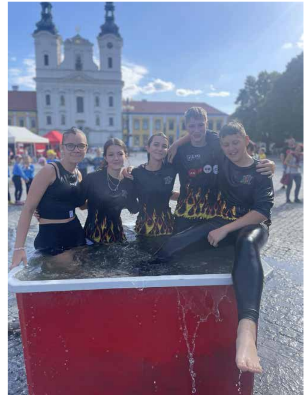
Konec sezony mladých hasičů byl na závodech v Uherském Hradišti.

Přejeme všem krásné prázdniny. Ivana Vaňurová