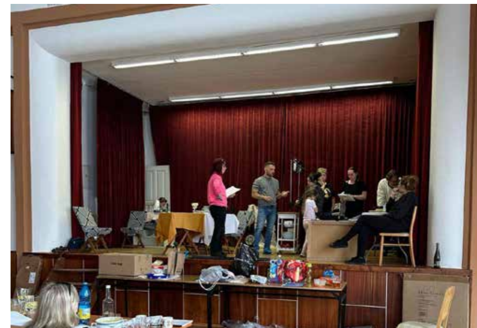
Zkouška Ostrožsko Lhotského divadla.

Za Ostrožsko-Lhotské divadlo Eva Zajícová