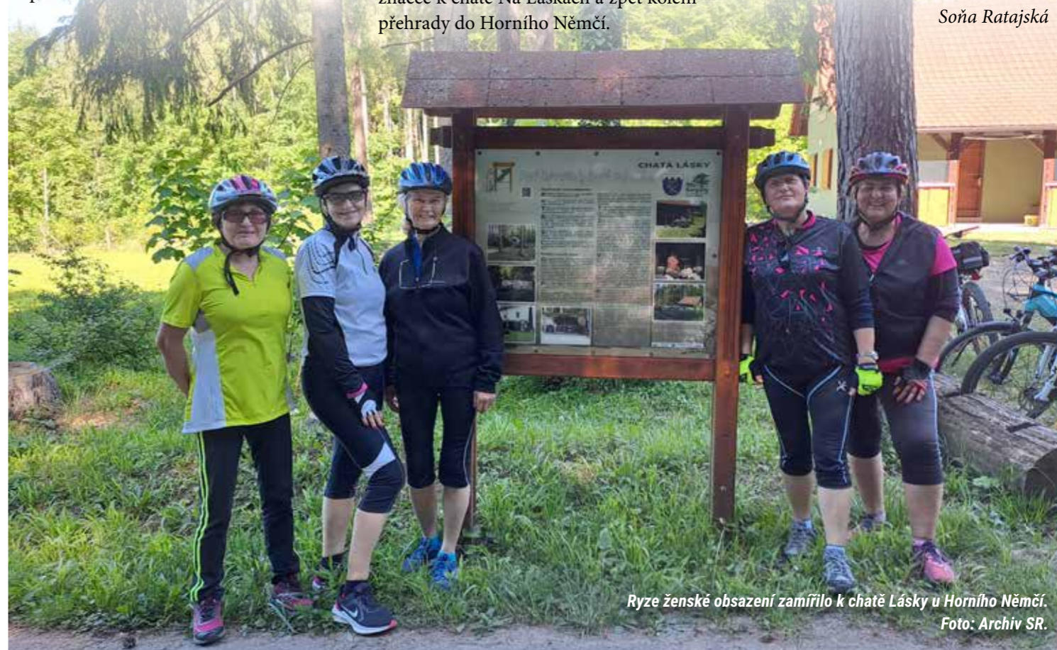
Ryze ženské obsazení zamířilo k chatě Lásky u Horního Němčí.