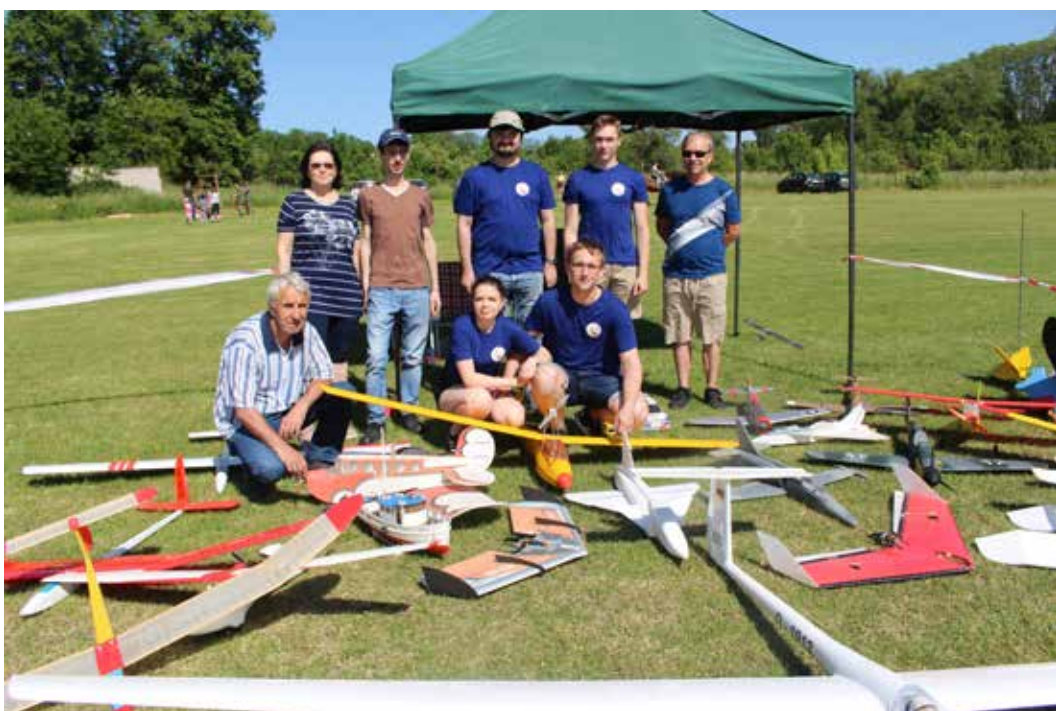
Modeláři na Dětském dnu.

Jak už bylo uvedeno, vznikl v roce 1957. Modeláři měli tehdy dílnu v bývalých garážích ČSAD. O něco později se schá-