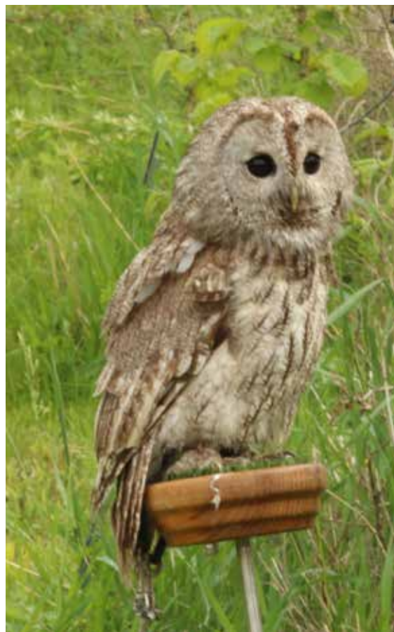
K vidění byl také Puštík obecný, to je nejběžnější česká sova, je to představitelka z filmu Tři oříšky pro Popelku, kde hrála Rozárka.

Velký zájem návštěvníků poutalo stanoviště stanice ochrany fauny z nedalekého Hluku. Stanoviště precizně představila slečna, která se před-