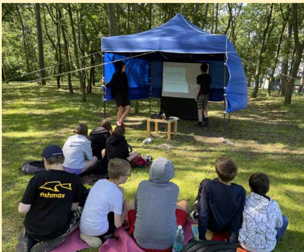
Celodenní projektový den žáků 6. třídy, který se uskutečnil 12. 6., se nesl v duchu Světových náboženství. Uskutečnil se na svatém Antonínku.

Naši školní družinu navštívili vedoucí skautského oddílu Čejka z Veselí nad Moravou.