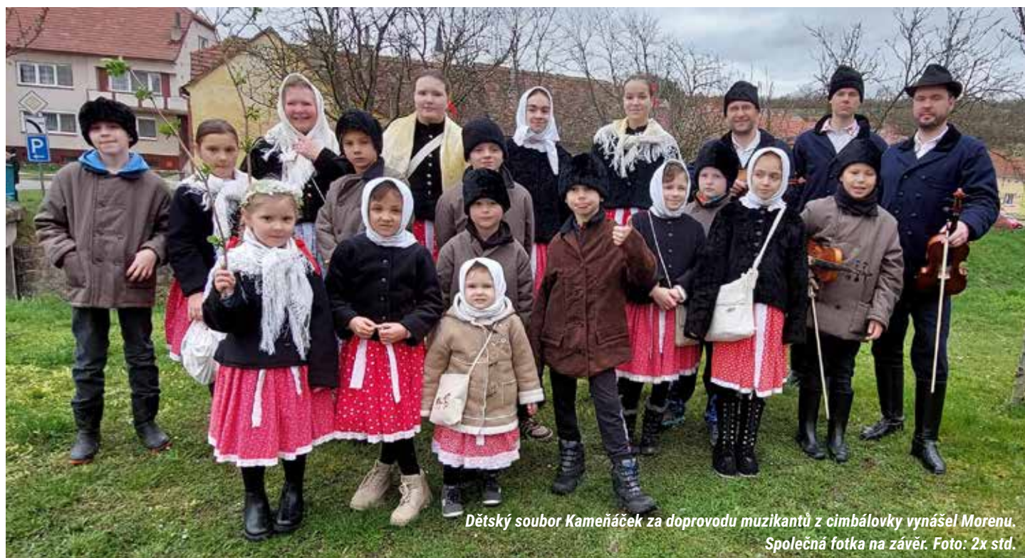
Dětský soubor Kameňáček za doprovodu muzikantů z cimbálkovky vynášel Morenu. Společná fotka na závěr.