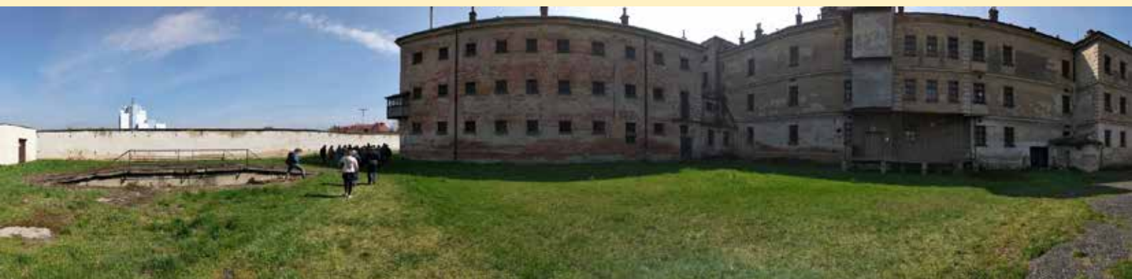
Věznice v Uherském Hradišti: Foto: JŠ.