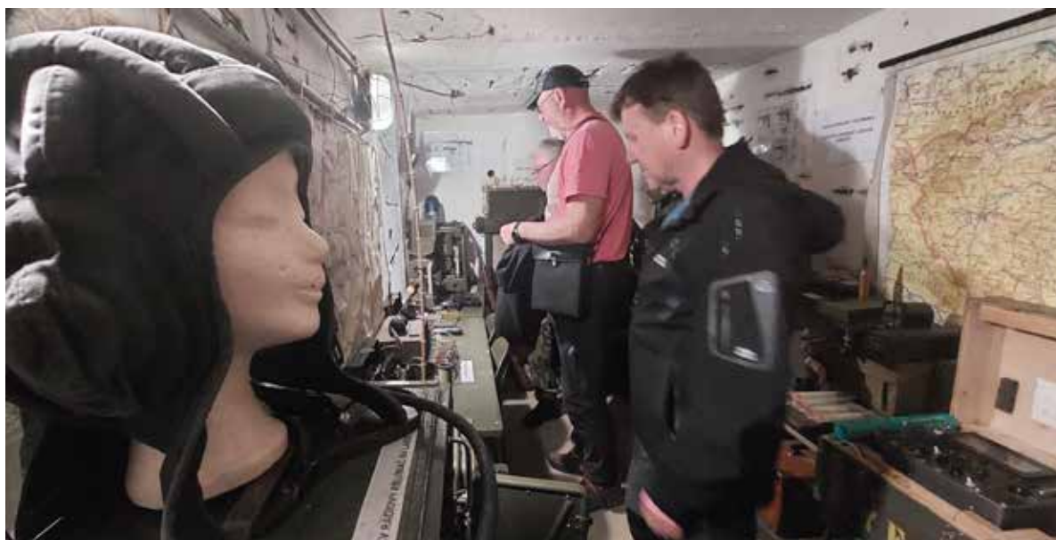
Bunkr je pro veřejnost otevřen každou neděli od 14 do 17 hodin.