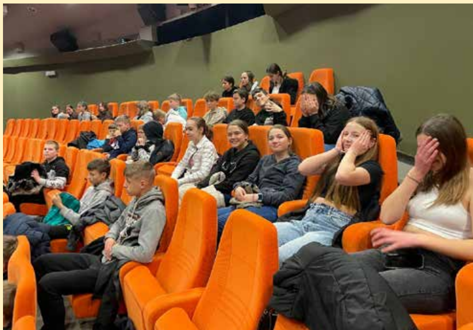
Žáci 6. a 7. třídy na Mezinárodním festivalu dokumentárních filmů o lidských právech.