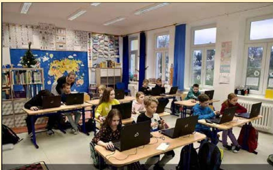
Žáci lhotské školy při výuce využívají nejmodernější technologie a novodobý vzdělávací koncept STEM.

Cílem revize je podle ministerstva školství rozvoj informatického myšlení žáků a jejich přirozené schopnosti efektivně a bezpečně využívat digitální technologie. K tomu navíc schopnost rozeznat a bránit se kybernetickému ohrožení všeho