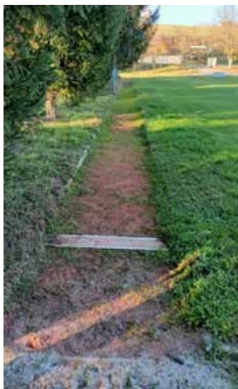
Rozběhová dráha před úpravami

- Na zahradě MŠ bude zrekonstruován starý chodník včetně okapových chodníků.