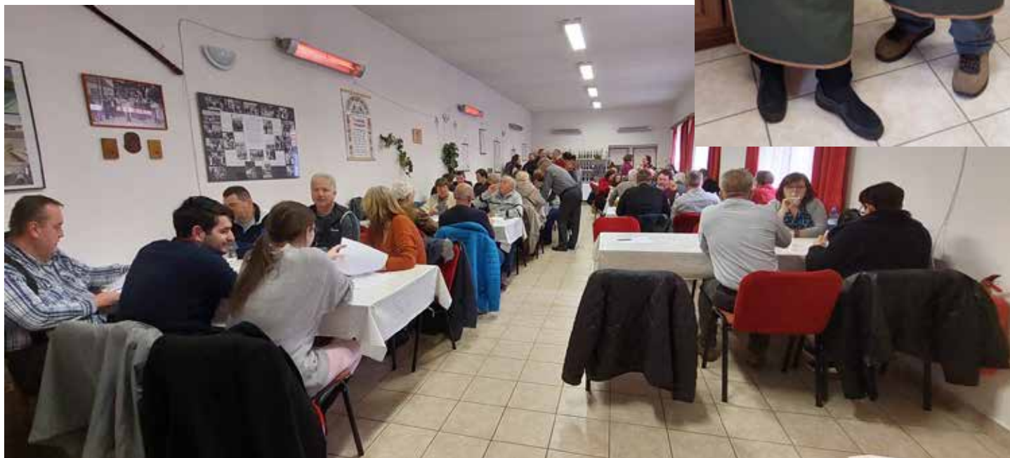
Zahrádkáři už tradičně uspořádali Velikonoční výstavu vína v prostorách staré sokolovny.