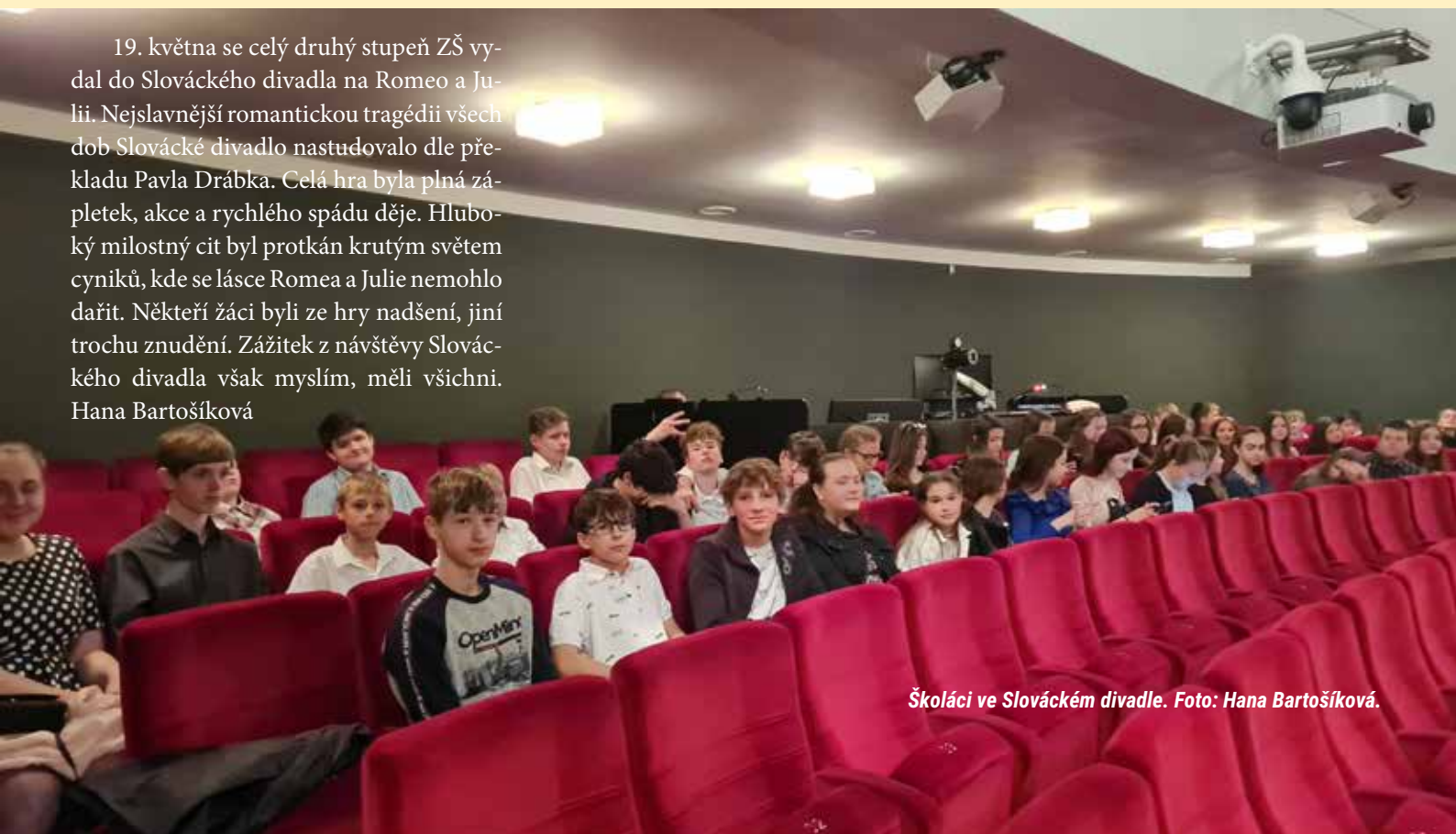
Školáci ve Slováckém divadle.

19. května se celý druhý stupeň ZŠ vydal do Slováckého divadla na Romeo a Julii. Nejslavnější romantickou tragédií všech dob Slovácké divadlo nastudovalo dle překladu Pavla Drábka. Celá hra byla plná zápletek, akce a rychlého spádu děje. Hluboký milostný cit byl protkáán krutým světem cyniků, kde se lásce Romea a Julie nemohlo dařit. Někteří žáci byli ze hry nadšení, jiní trochu znučení. Zážitek z návštěvy Slováckého divadla však myslím, měli všichni. Hana Bartošíková