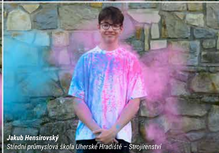
Jakub Hensirovský Střední průmyslová škola Uherské Hradiště - Strojrenství