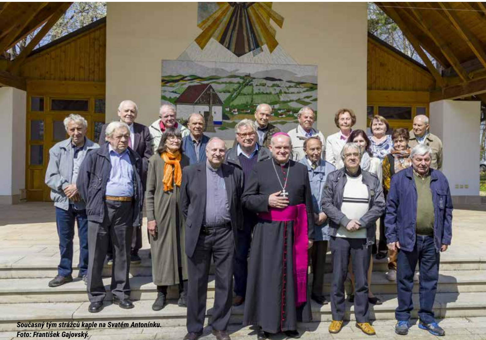
Současný tým strážců kaple na Svatém Antonínku.