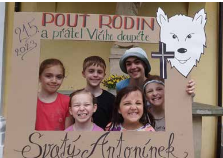
Pouť rodin a přátel Vlčího doupěte se vydařila: Foto: Ludmila Pavelková.