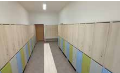
Nové chlapecké šatny