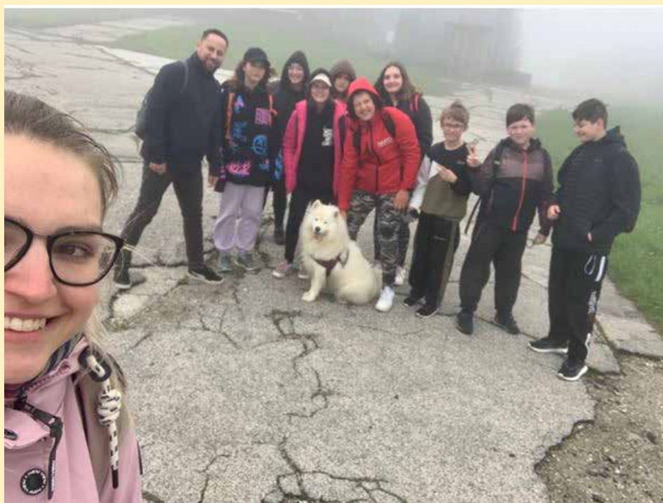
Šestáci na nejvyšším bělokarpatském vrcholu - na Velké Javořině.