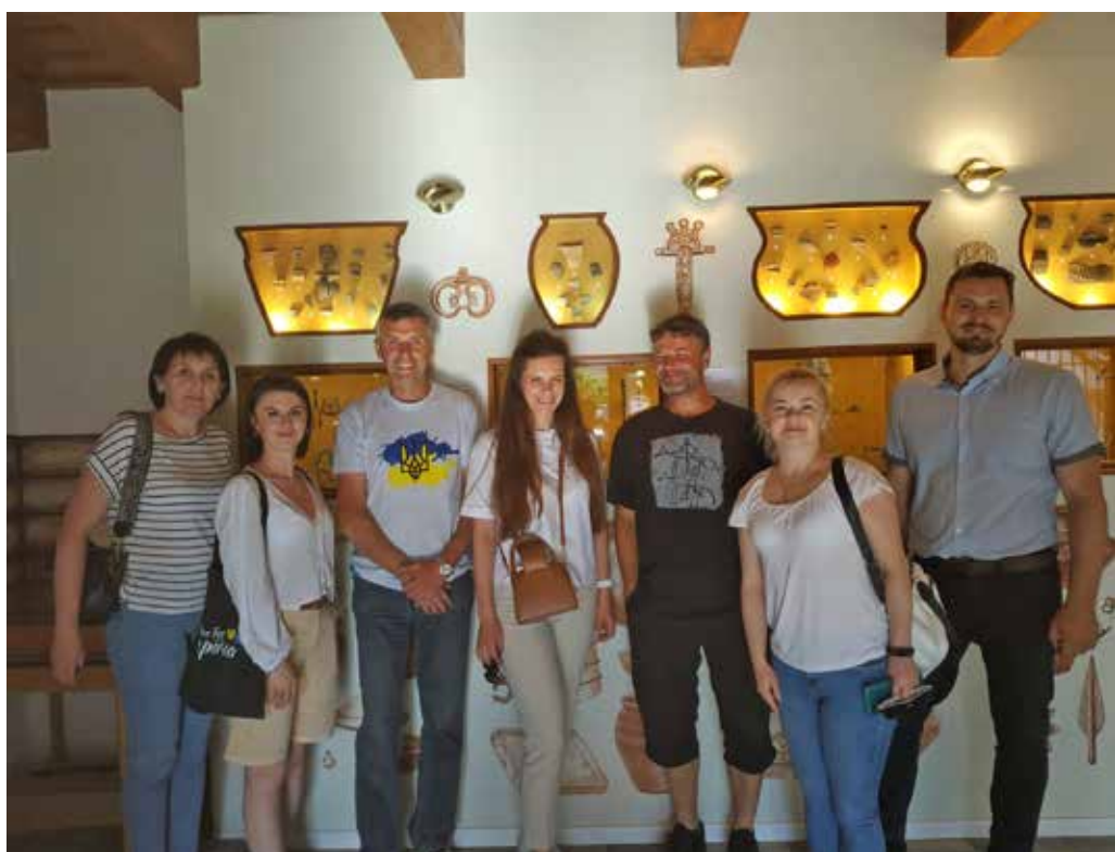
Skupina se zastavila také v naší obci a prohlédla si Obecní muzeum s archeologickými nálezy.