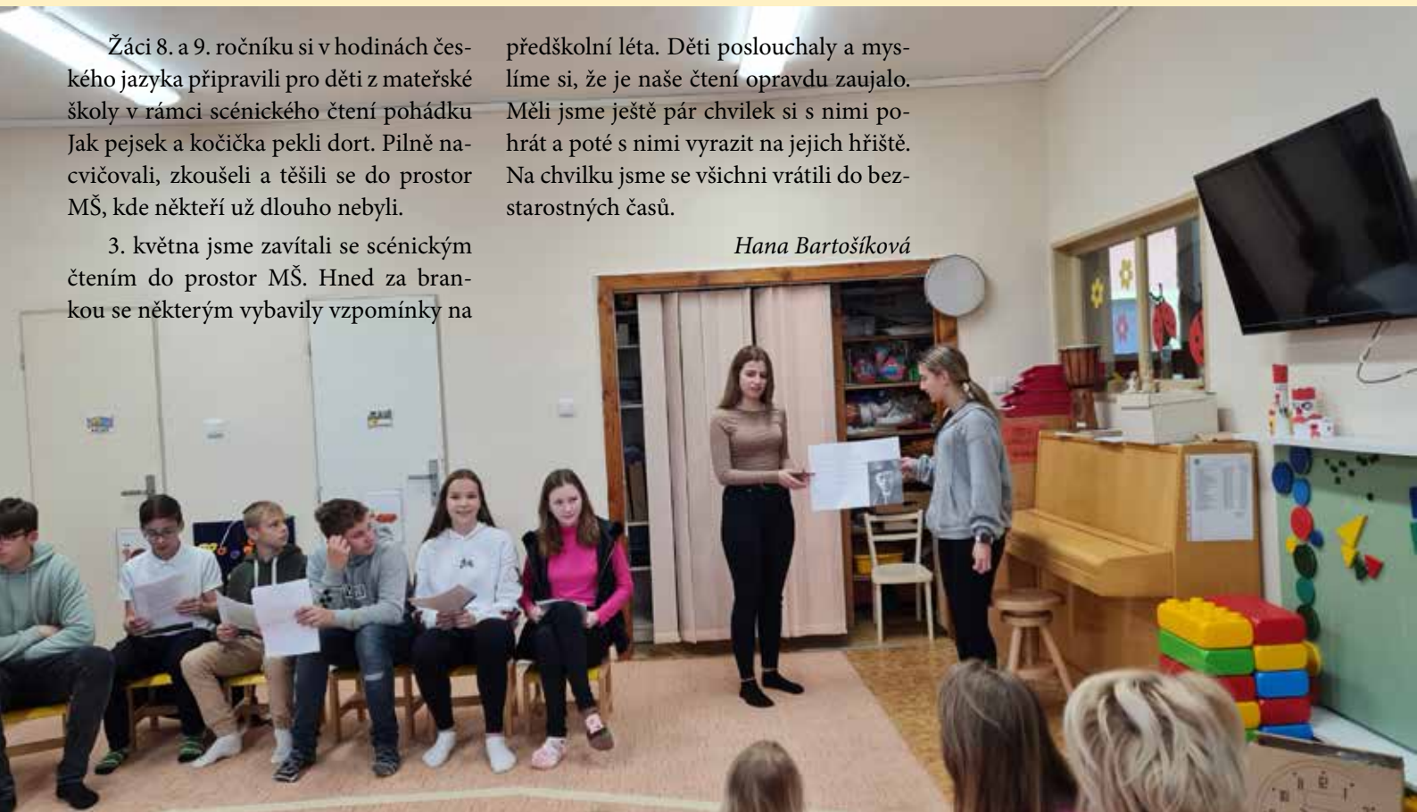
Děti ve školce poslouchaly a myslíme si, že je naše čtení opravdu zaujalo.