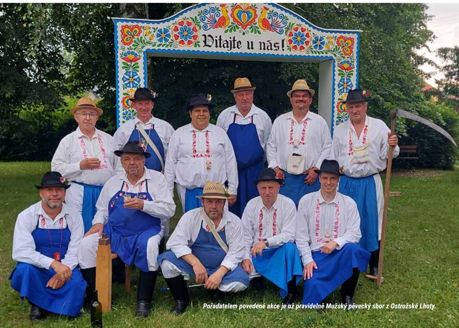
Pořadatelem provedené akce je už pravidelně Mužský pěvecký sbor z Ostrožské Lhoty.