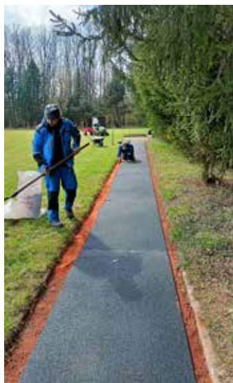
Rekonstrukce rozběhové dráhy