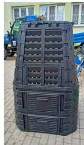
Vzorek kompostéru foto na str. 5 až 7 OÚ Ostrožská Lhota

V minulém čísle zpravodaje jste byli informováni o záměru pořídit domácnostem, které mají zájem, kompostér pro podporu domácího kompostování biologicky rozložitelného odpadu v kompostérech a tím eliminovat ukládání biologického odpadu do popelnic na komunální odpad. Pořízení kompostérů bylo podmíněno zájmem občanů (byla provedena anketa) a získání dotace z Operačního programu Životního prostředí (OPŽP). I přes to, že dotaci z OPŽP na kompostéry nezískáme, protože alokace financí v daném dotačním programu byla rychle vyčerpána, tak kompostéry do domácností, které projeví zájem, pořídíme. Nyní vybíráme vhodný kompostér. Vydržte, kompostér bude.