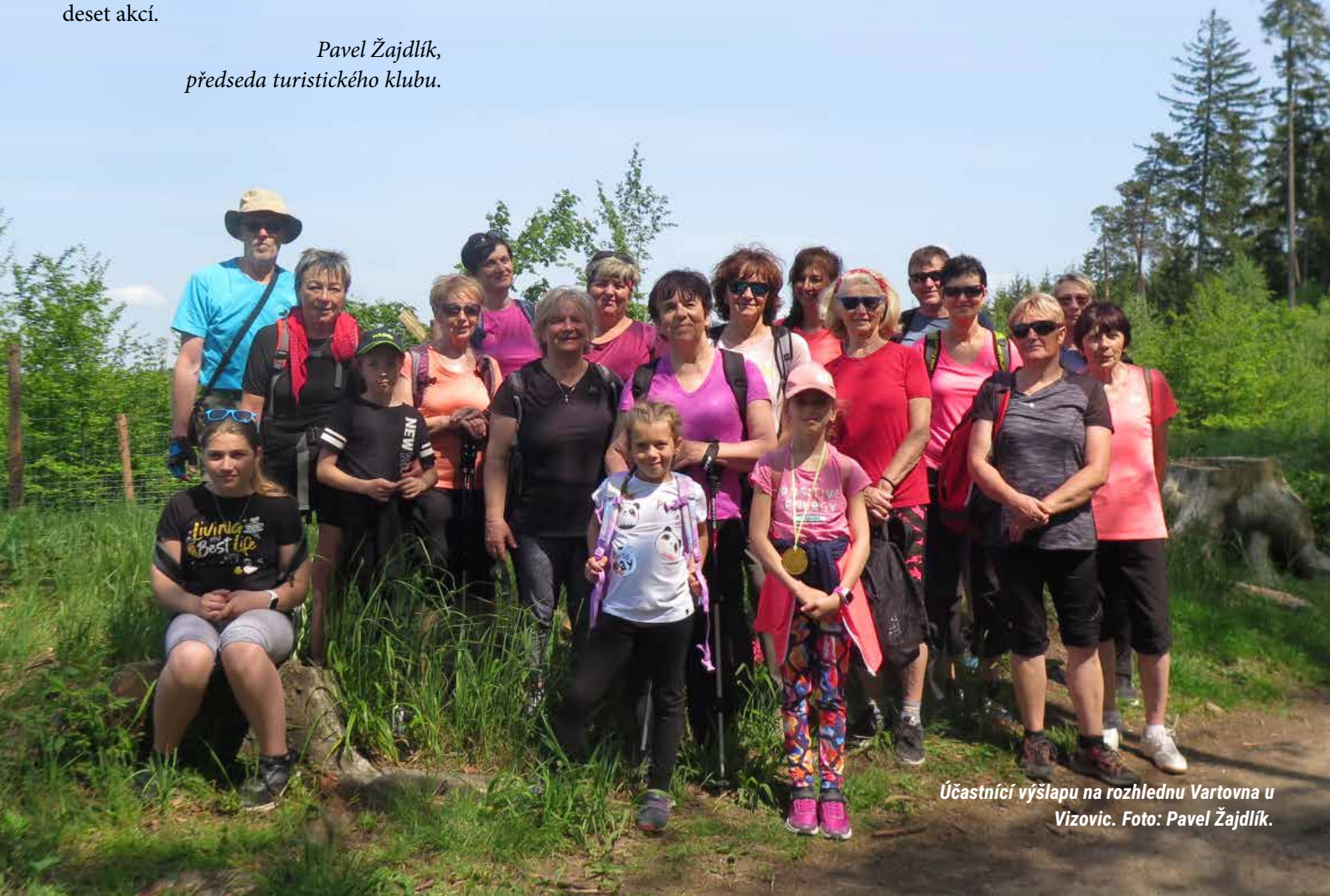
Účastníci výšlapu na rozhlednu Vartovna u Vizovic.