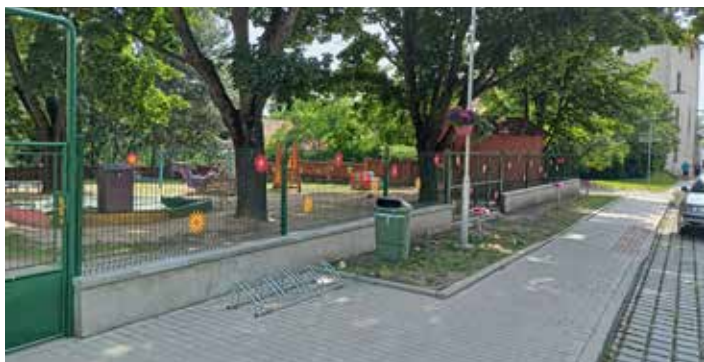
Nové oplocení mateřské školky