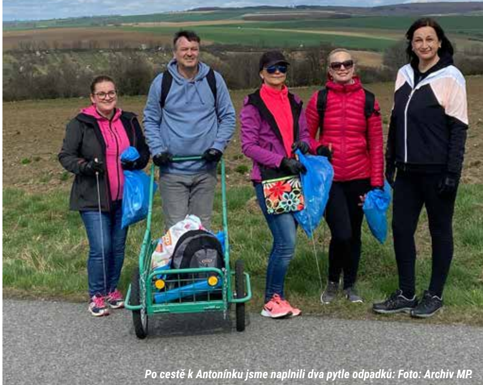
Po cestě k Antonínku jsme naplnili dva pytle odpadků: Foto: Archiv MP.