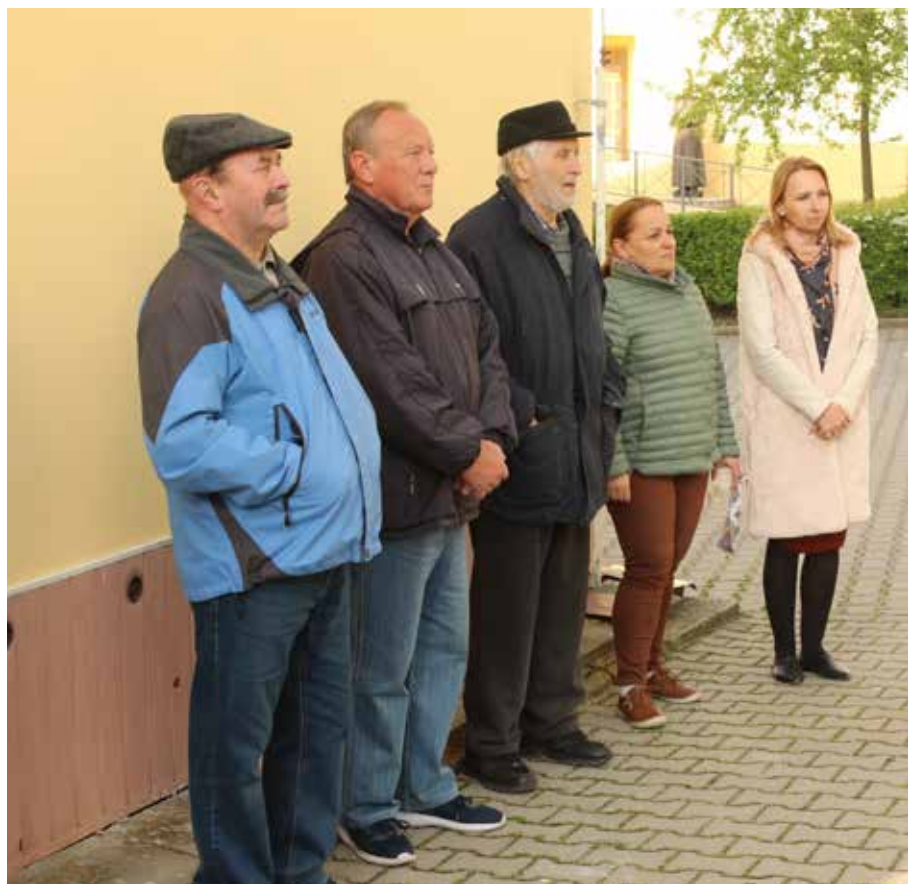
Občané při slavnostním aktu.