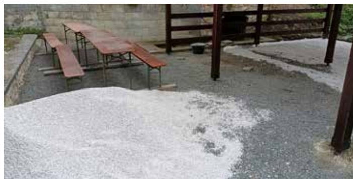
Před položením dlažby

- Na přípravách slavnostního předávání ocenění soutěže Vesnice roku 2023.