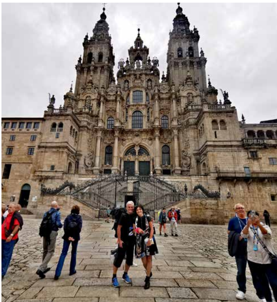
Po necelých 13 dnech jsem stanula před katedrálou v Santiagu.

Délka této trasy z Porta je oficiálně 280 km, ale protože cesta skýtá více variant, měla jsem v nohách po necelých 13