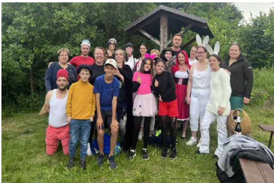
Lhotští nadšenci ve spolupráci s místními hasiči uspořádali po dlouhé sedmileté pauze Pohádkový les.