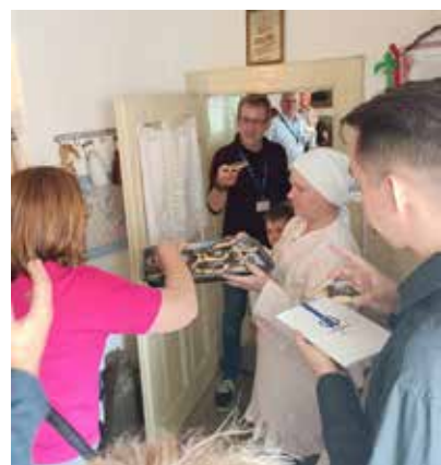
Prohlídka památkového domku.