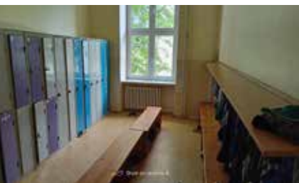
Původní chlapecké šatny