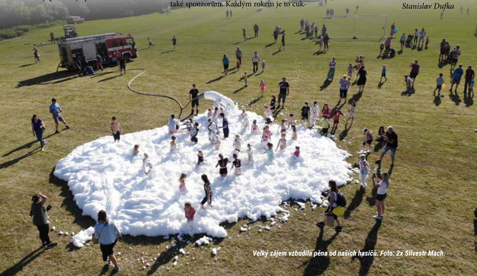
Velký zájem vzbudila pěna od našich hasičů.