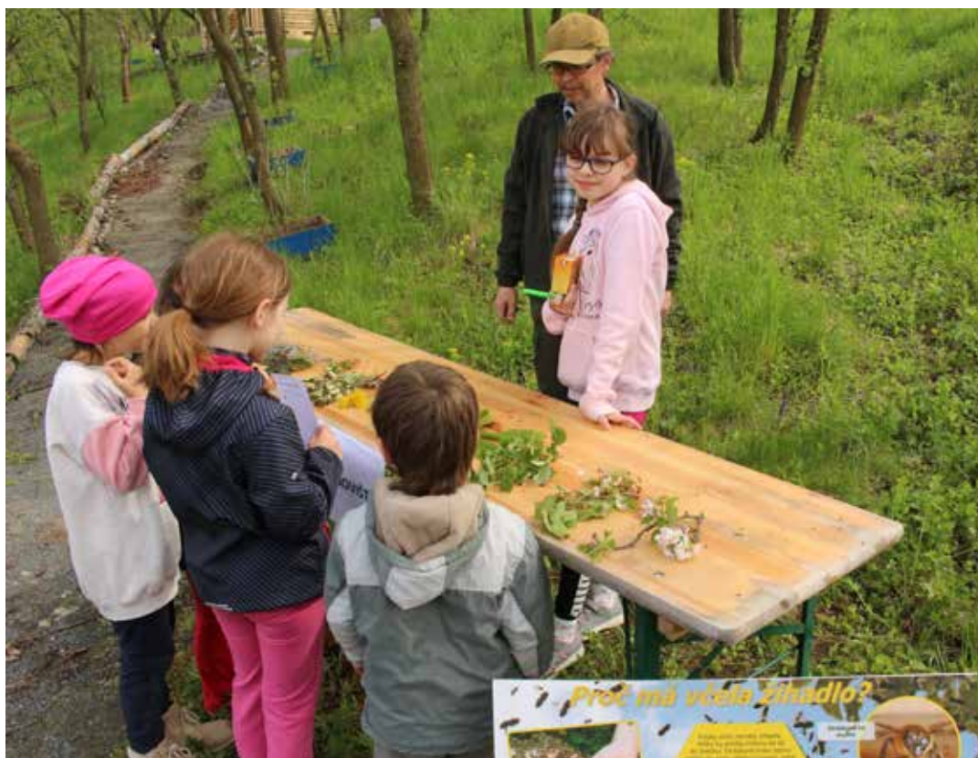
Pro děti připravili pořadatelé pět stanovišť, jedno z nich bylo poznávání rostlin.