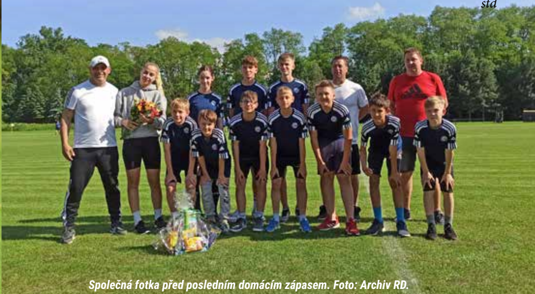
Společná fotka před posledním domácím zápasem.