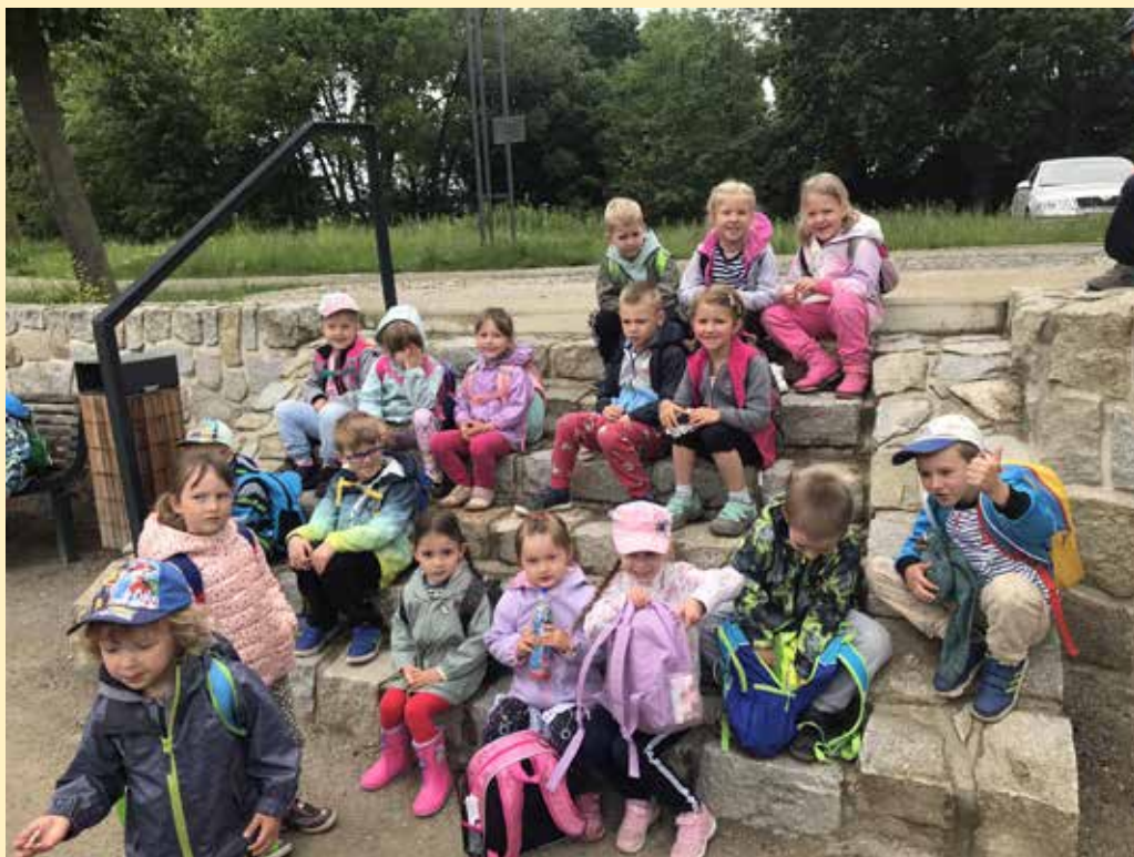
Fotka je z výletu dětí na Baťově kanále.

věnovala Diakonie z Uherského Hradiště, pod vedením naší bývalé zástupkyně ředitelky Jitky Hrdinové. Celkový výtěžek 3 425 Kč bude použit na nákup materiálu pro další tvorbu klientů.