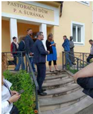
Prohlídka pastoračního domu