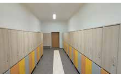
Nové dívčí šatny