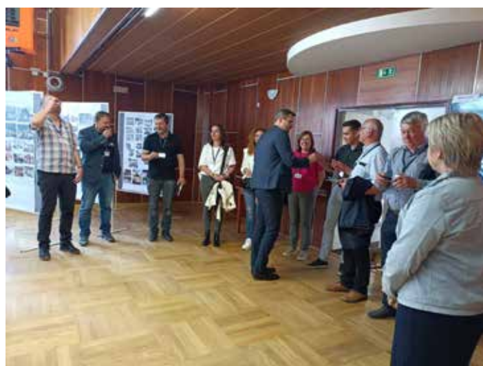
Přivítání komise v obecním sále

a připravené projekty. Sál zdobili také fotografie z historie obce a v televizích byla puštěna videa – podnikání v obci a šikovné ruce. Následně jsme vzali komisi na prohlídku obce. Přemístovali jsme se autobusem společnosti Ostrožsko a.s. a pěšky.