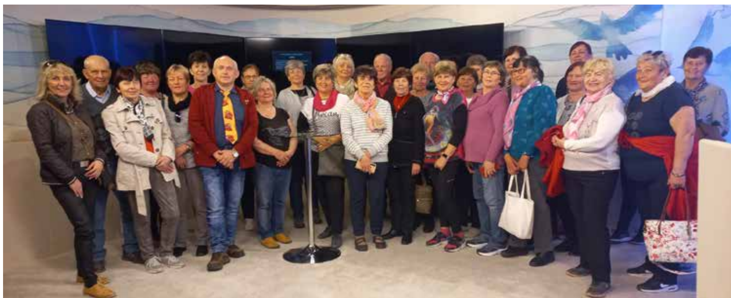
Český červený kříž z naší obce uspořádal předposlední dubnovou neděli zájezd do Ostravy. Cílem bylo studio televize Noe.