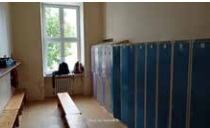
Původní dívčí šatny