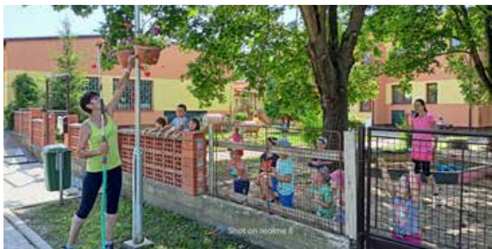
Původní oplocení mateřské školky