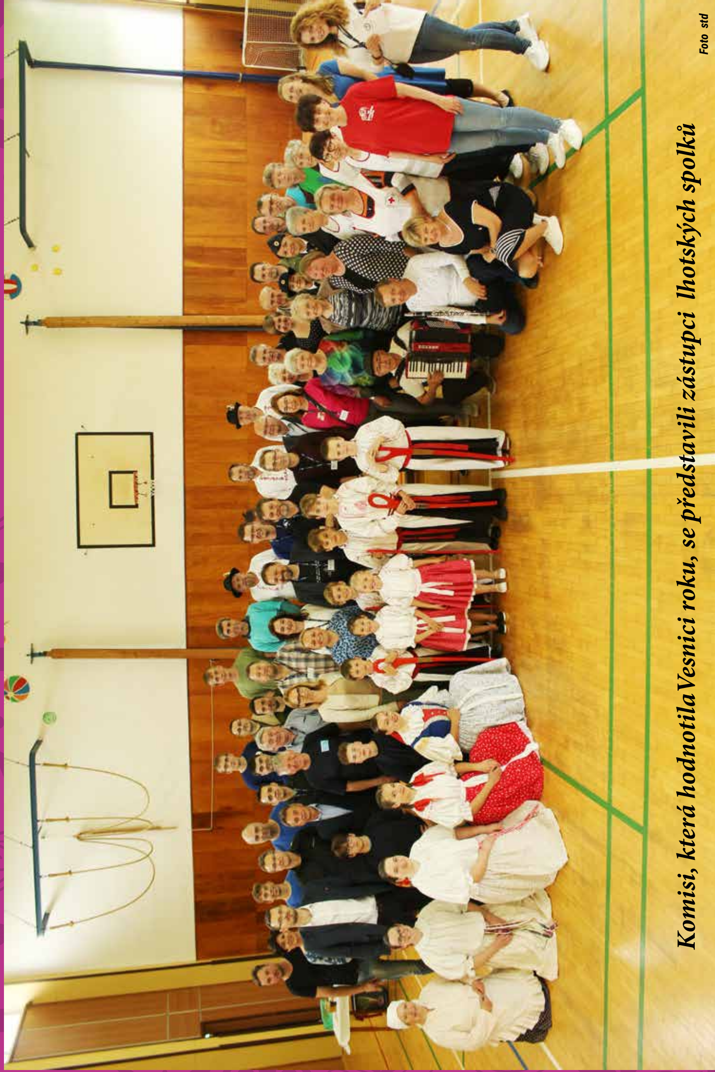
Komisi, která hodnotila Vesnici roku, se představili zástupci lhotských spolků