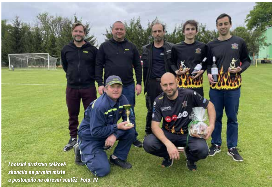
Lhotské družstvo celkově skončilo na prvním místě a postoupilo na okresní soutěž.