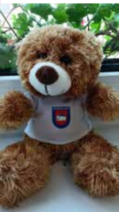
Medvídek pro děti

Dne 3. června obec se spolky a kluby uspořádala již tradiční dětský den, který se uskutečnil jako obvykle ve sportovním areálu (na hřišti). Na pořádání dětského dne se podíleli zaměstnanci obce, a to jak děvčata z kanceláře, tak chlapi z provozu. Jednotlivá zábavná stanoviště připravili členové spolků: myslivců, rybářů, včelařů, Háječku, mužského pěveckého sboru, Fašankbendu, klubu přátel historie, Červeného kříže, hasičů, volejbalistů, kulturistů, tenistů, hokejistů a fotbalistů. Divadelníci a COŠ měli na starost u vstupu vysvětlit dětem program dětského dne, turisté měli dohled u nafukovacích obřích atrakcí a senioři měli na starost jako obvykle občerstvení a opékání