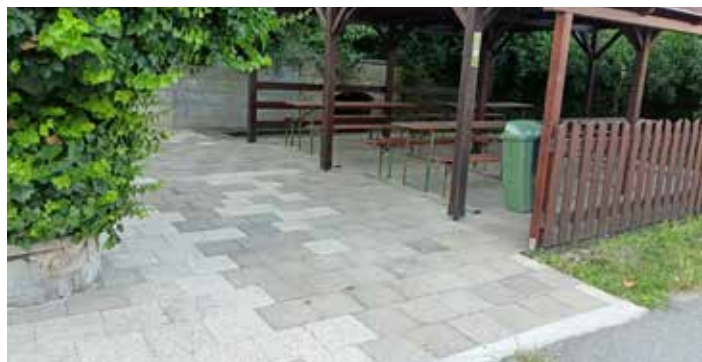
Položení dlažby u památkového domku