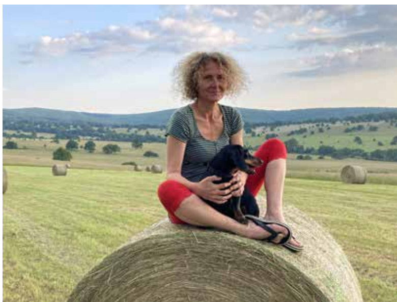
Autorka pozvánky Martina Šalomounová.