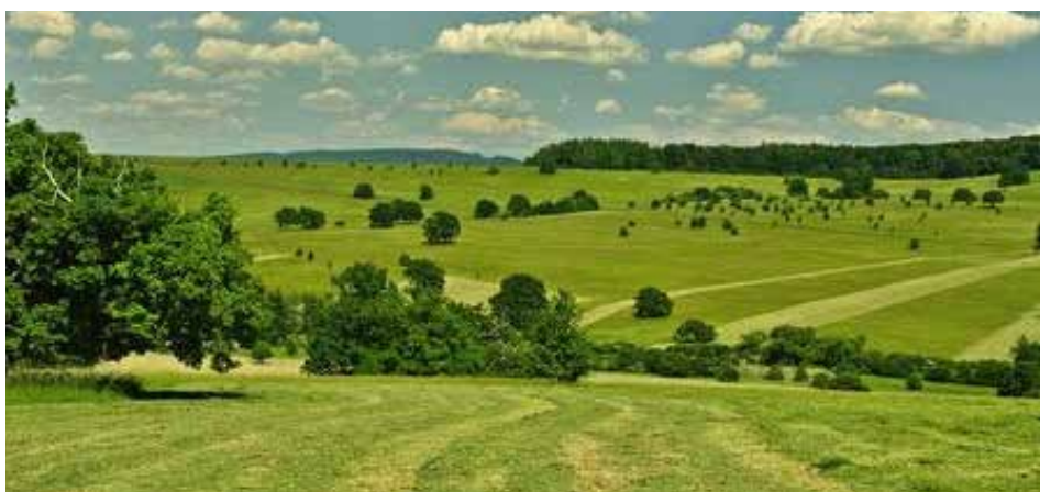
Národní přírodní rezervace Čertoryje a Vojšické Louky.

Nejzajímavější je však na tomto místě jeho unikátní flóra. Roste zde na 20 druhů orchidejí a celková druhová rozmanitost v některých místech dosahuje až 133 druhů na 100 m 2 , což je zdaleka nejvíce v České republice a patří k nejvyšším hodnotám v celé Evropě, potažmo na celém světě. Tomuto fenoménu trochu napomohl člověk, kdy pozvolna svou činností přeměnil původní lesostep na louky s častým výskytem soliterních dubů. Tyto louky jsou zpravidla jednosečné, tedy ke kosení dochází jen jednou za rok, v době, kdy se stihne většina druhů již vysemenit.